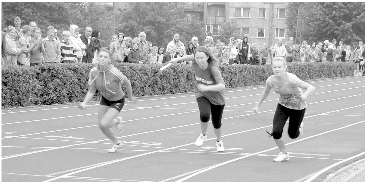
Dots starts Olimpiskās dienas stafetei

Sestdien, 11. septembrī, Limbažos pulcējās bijušā rajona skolēni no 1. līdz 12. klasei, lai piedalītos Olimpiskajā dienā Uzstādi savu olimpisko rekordu! . Šāda diena tika organizēta visos 7 Latvijas olimpiskajos centros, popularizējot olimpisko kustību, dažādus sporta veidus un veselīga dzīvesveida nozīmi.