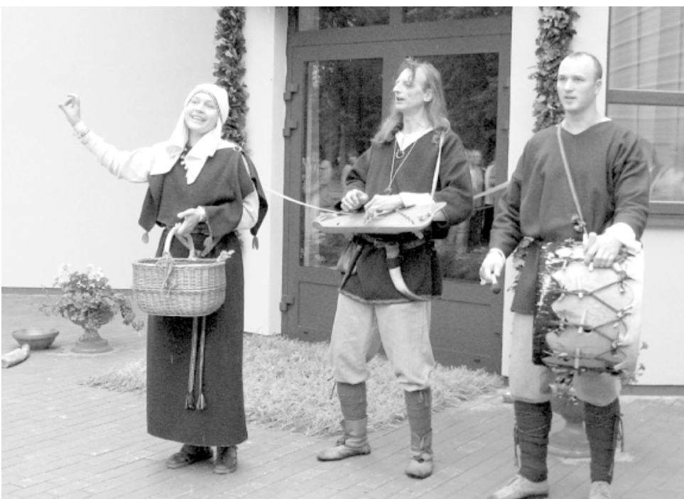
Nama atvēršanu ieskandinā folkoras kopa Delve