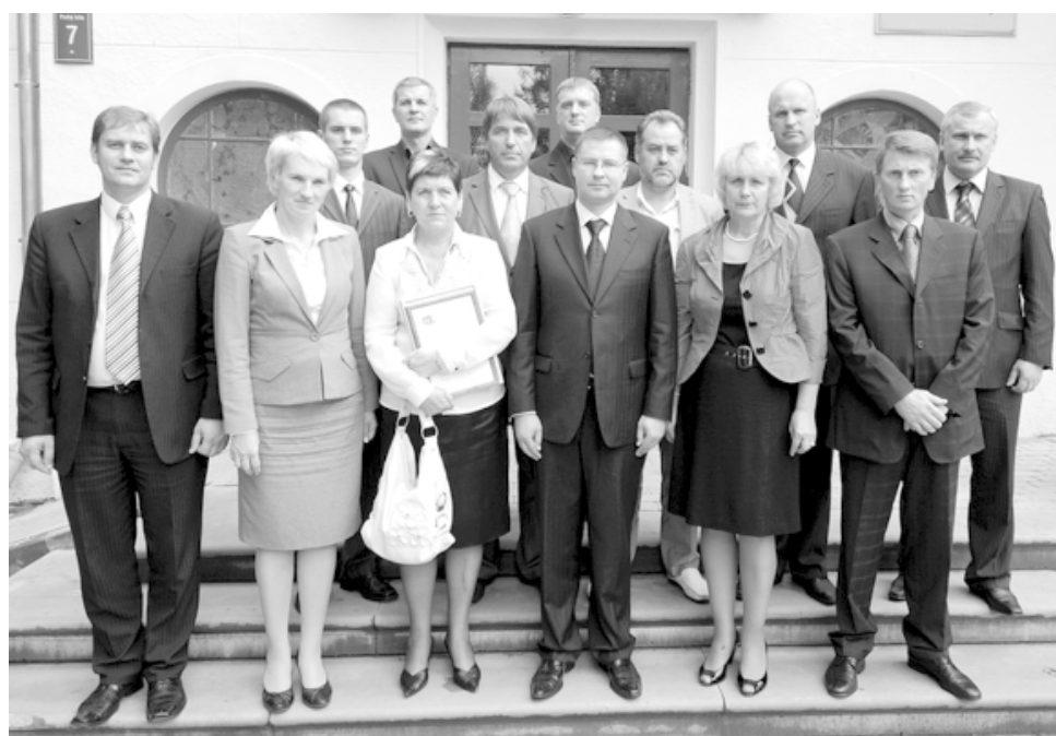
Mirkļis pēc Vidzemes lielāko eksporta uzņēmēju sumināšanas Limbažos kopā Ministru prezidentu Valdi Dombrovski (vidū), ekonomikas ministru Arti Kamparu (2. rindā otrais no kreisās), Limbažu novada pašvaldības vadītāju Didzi Zemmeru (pirmais no kreisās) un uzņēmumu un pašvaldību pārstāvjiem

Vizītes otrajā daļā Ministru prezidents, ekonomikas ministrs un novada pašvaldības vadītājs devās uz Teātra māju, kur godināja Vidzemes uzņēmējus par nozīmīgu ieguldījumu Latvijas tautsaimniecības attīstībā 2009. gadā.