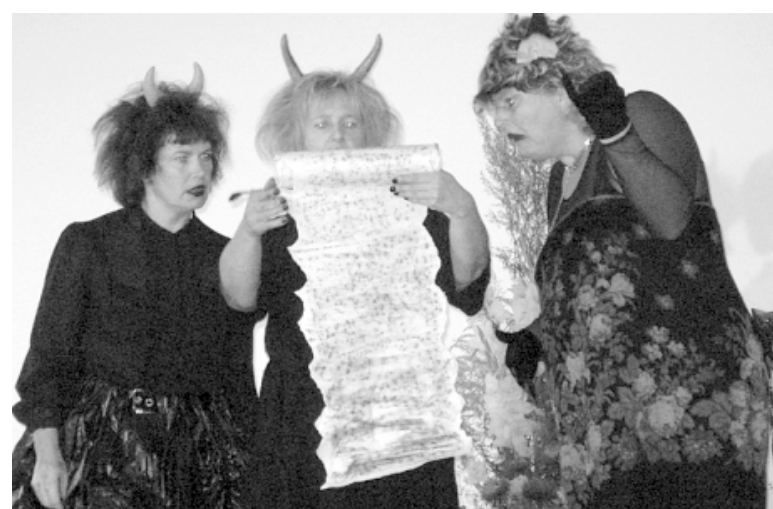
Iekļūt jaunajā zālē pamanījušies arī velniņi

Vakarpusē uz izrādi Īsa pamācība milēšanā aicināja Krimuldas novada amatiereteātris. Priekšnesu-