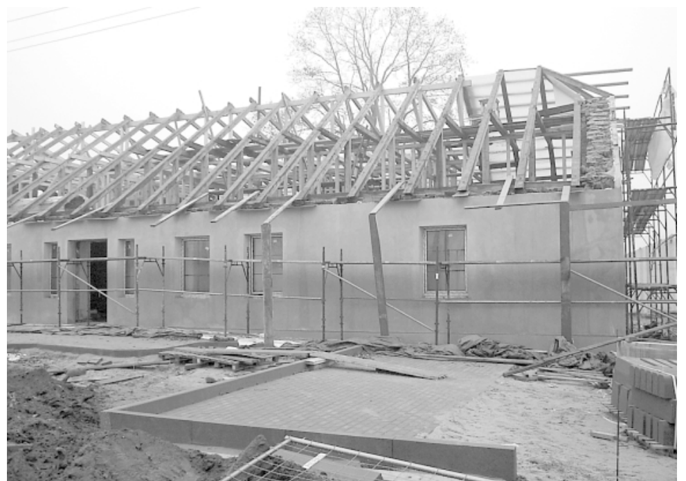
Sabiedriskā centra ēka Lādē nosiltināta, tagad tā gaida jumta segumu