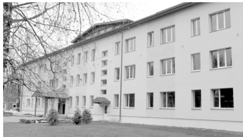
Katvaru speciālā internātpamatskola pēc renovācijas

Speciālists Latvijas apstākļos neiesaka izvēlēties gaisu - ūdens sūkni, kas jau pie -10° grādiem var nestrādāt. Ja uzstāda šādu ierīci, noteikti jādomā par alternatīvu apkures veidu.