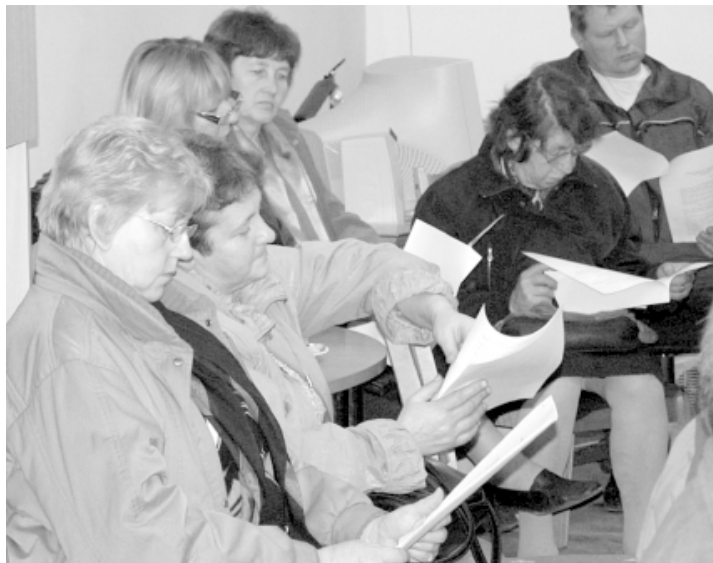
Viļķenes pagasta iedzīvotāji iepazīstas ar iedzīvotāju padomes nolikuma projektu

Uz tikšanos Pālē bija ieradies tikpat kupls iedzīvotāju pulks kā Viļķenē. Tur izskanēja