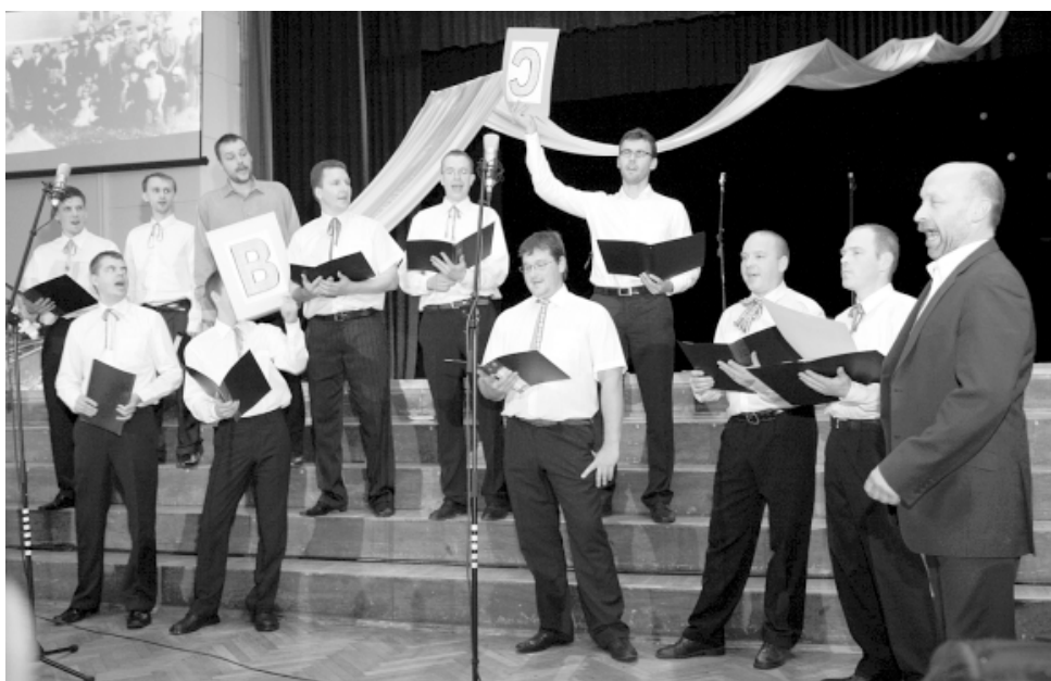
Jautrību skatītājos raisīja kādreizējais skolas zēnu koris