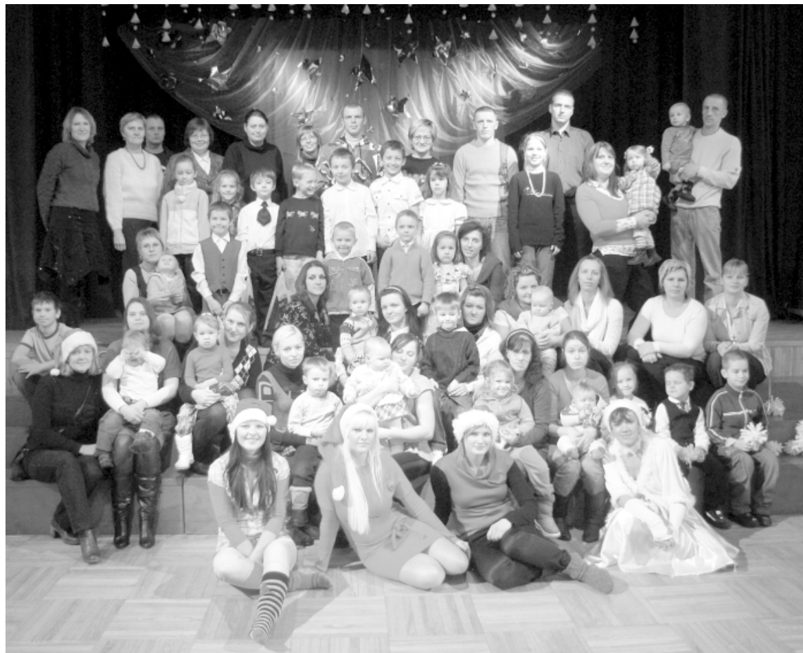
Limbažu jauniešu un pieaugušo vakara (maiņu) vidusskolas tradicionālās Rūķu balles dalībnieki

Svētku dalībniekus, kā parasti, sagaidīja rūķi (skolēnu domes pārstāves) un laipni ierādīja vietas zālē, kāds nobijies ballētājs (tik daudz nepazīstamu seju visapkārt!) saņēma arī pa uzmundrinājumam. Kad zālē ieradās Sniegpārslīņa, sākās varena jautrība, jo viņa līdzī bija atvedusi dāvanu maisu. Bet dāvanas, kā zināms, ir jānopelna, tāpēc visi