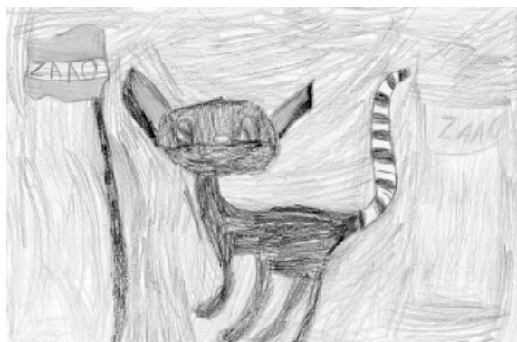
Ance Brekše, 6 gadi, Ozolaines bērnudārzs