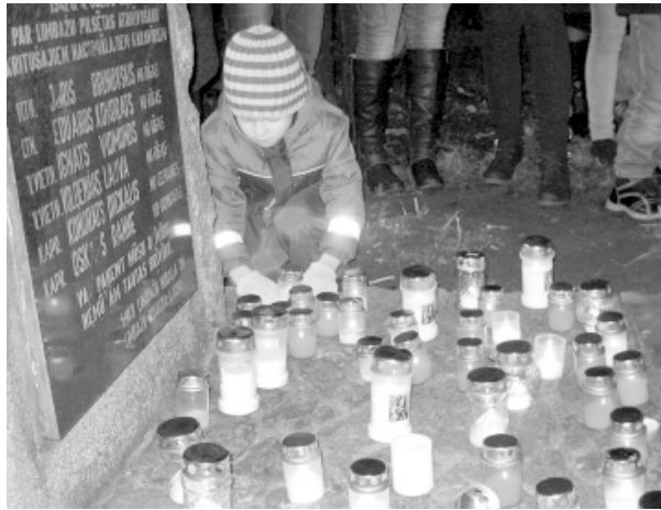
Svētbrīdi Limbažu ev.lut. baznīcas dārzā svečītes brīvības cīņāju piemiņai noliek arī jaunā paaudze

Limbažu Galvenajā bibliotēkā bija skatāma literatūras izstāde Lāčplēša dienu piemiņot , bet Limbažu Bērnu bibliotēkā - izstāde Mana Latvija . Savukārt Dienas