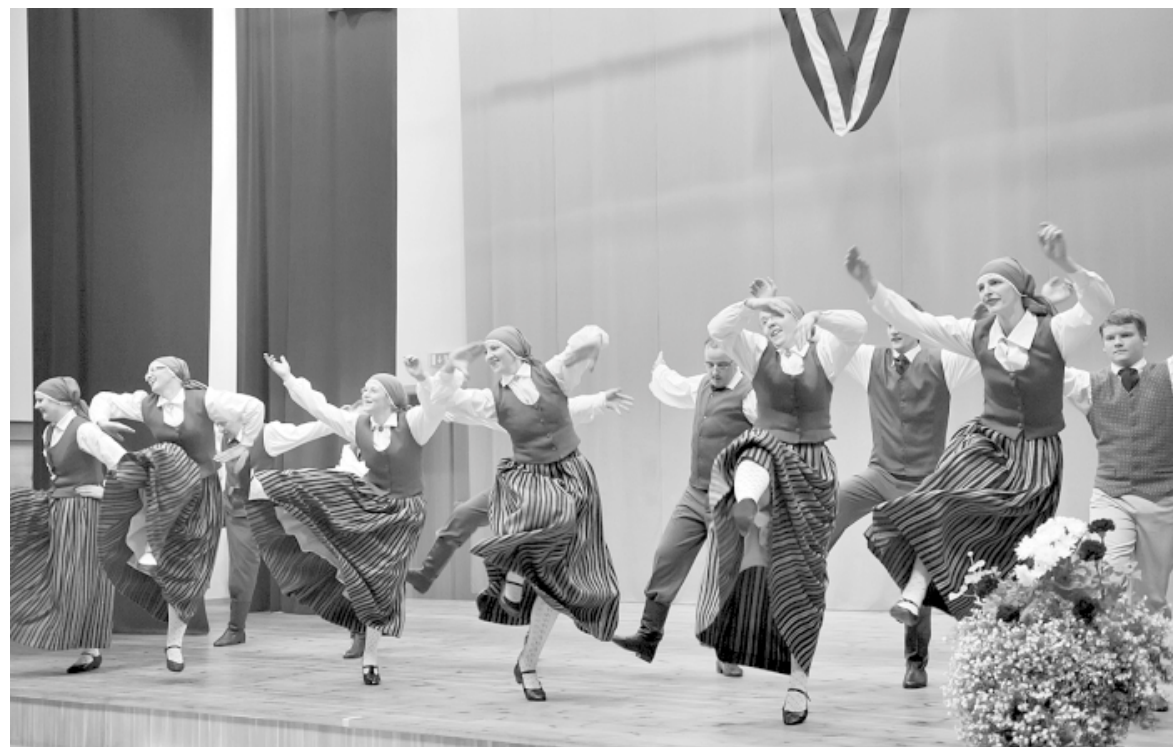
Skultes vidējās paaudzes deju kolektīvs Lecam pa vecam