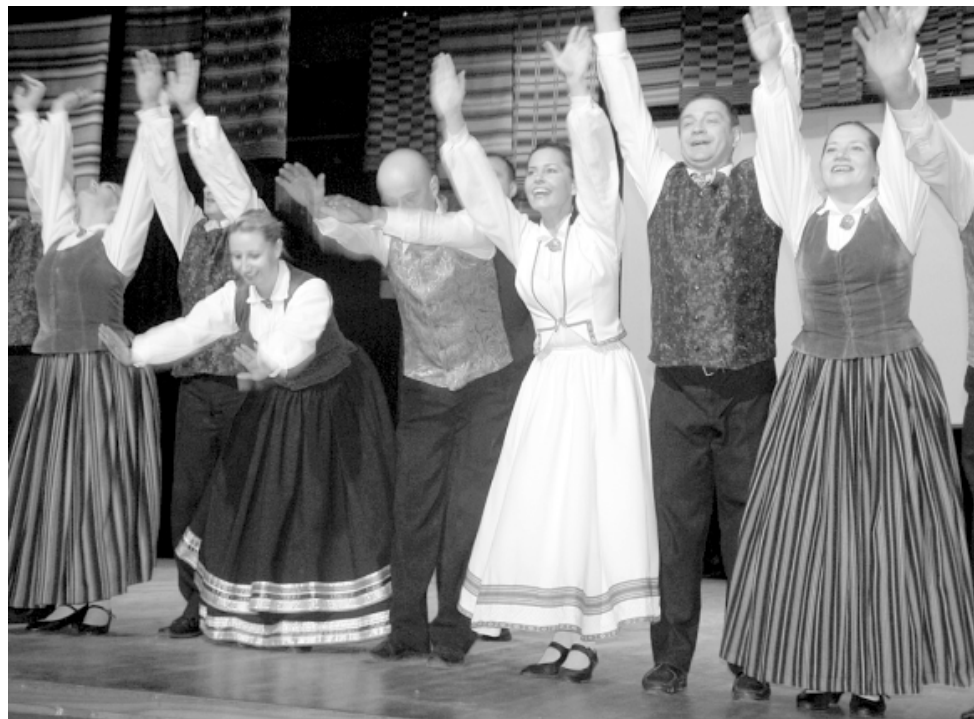
Deju kolektīvs Jampadracis deju beidz ar pateicības sveicienu skatītājiem

Svinīgās daļas noslēguma kultūras nama direktore S. Mieze pateicās visiem par atrasto iespēju būt kopā šajā jubilejas reizē un uzsvēra: - Ja nebūtu daudzo cilvēku, kas sēž zālē, un kultūras darbinieku, kas strādāja pirms manis, nebūtu arī šī nama tradīciju, ko turpinām saglabāt. Vēlējamies, lai svētki patiktu mums un būtu dāvana jums. Lai visiem izdodas!