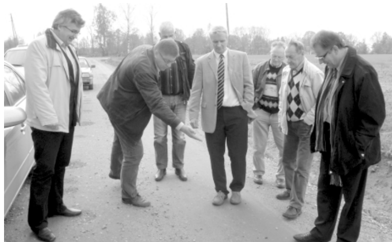
Umurgā rekonstruēto ceļu novērtē novada pašvaldības pārstāvji un ceļu būvnieki

2010. gadā Limbažu pagastā SIA Limbažu komunālserviss neveica saimniecisko darbību, tarifu aprēķinam izmantotas 2011. gada plānotās izmaksas.