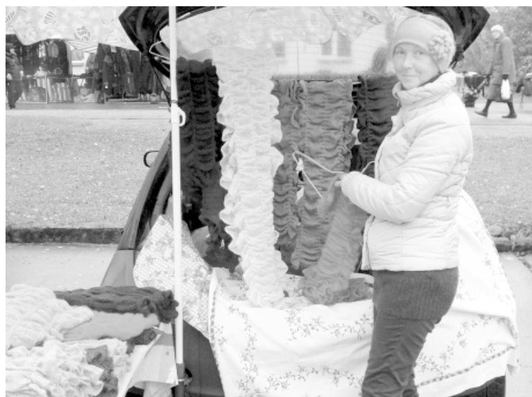
Mīkstas un pūkainas šalles uzrunāja ikvienu svētku apmeklētāju