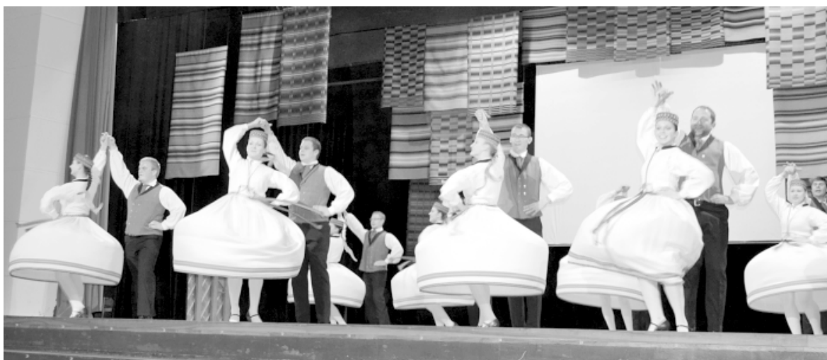
Latvijas dzimšanas dienai un atzinības saņēmējiem par godu dejo TDA Katvari