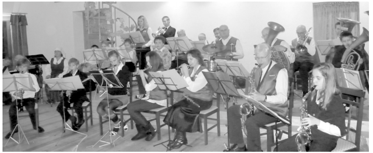
Limbažu pagasta Stūrīšos pūtēju orķestris Lemisele priecēja gan ar jaunām, gan jau pazīstamām melodijām

22. oktobrī Stūrīšos notika pūtēju orķestra Lemisele un kapelas Labi, ka tā koncerts ar devīzi Lustīgu dzīvošanu . Tāds bija arī pats koncerts. Lai gan tajā dienā tika solīts kārtējais pasaules gals, pie tik jaukas koncerta programmas tas nemaz nebija iespējams. Koncertā skanēja gan klasika, gan jaunas un jau arī pazīstamas melodijas.