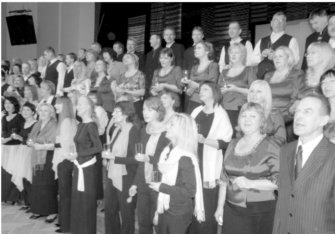
Limbažu kultūras nama apvienotais koris sumina ar dziesmu Daudz baltu dieniņu