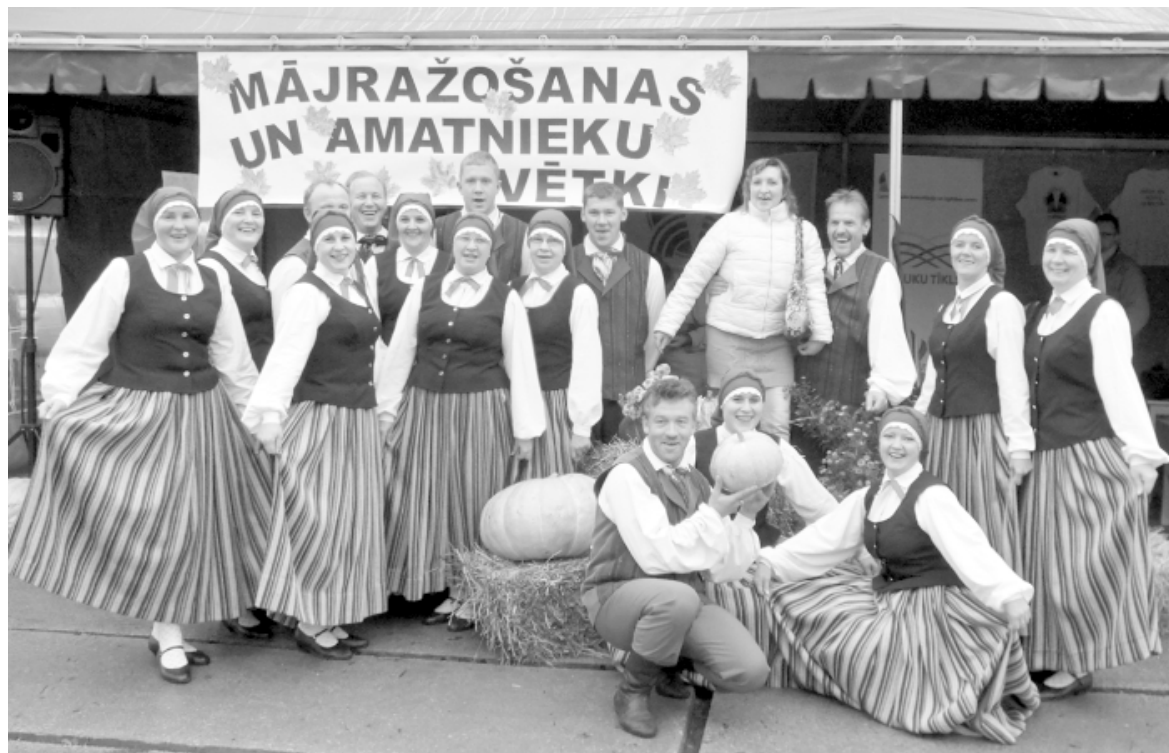
Jautru garu svētkos uzturēja deju kopa Lādezers