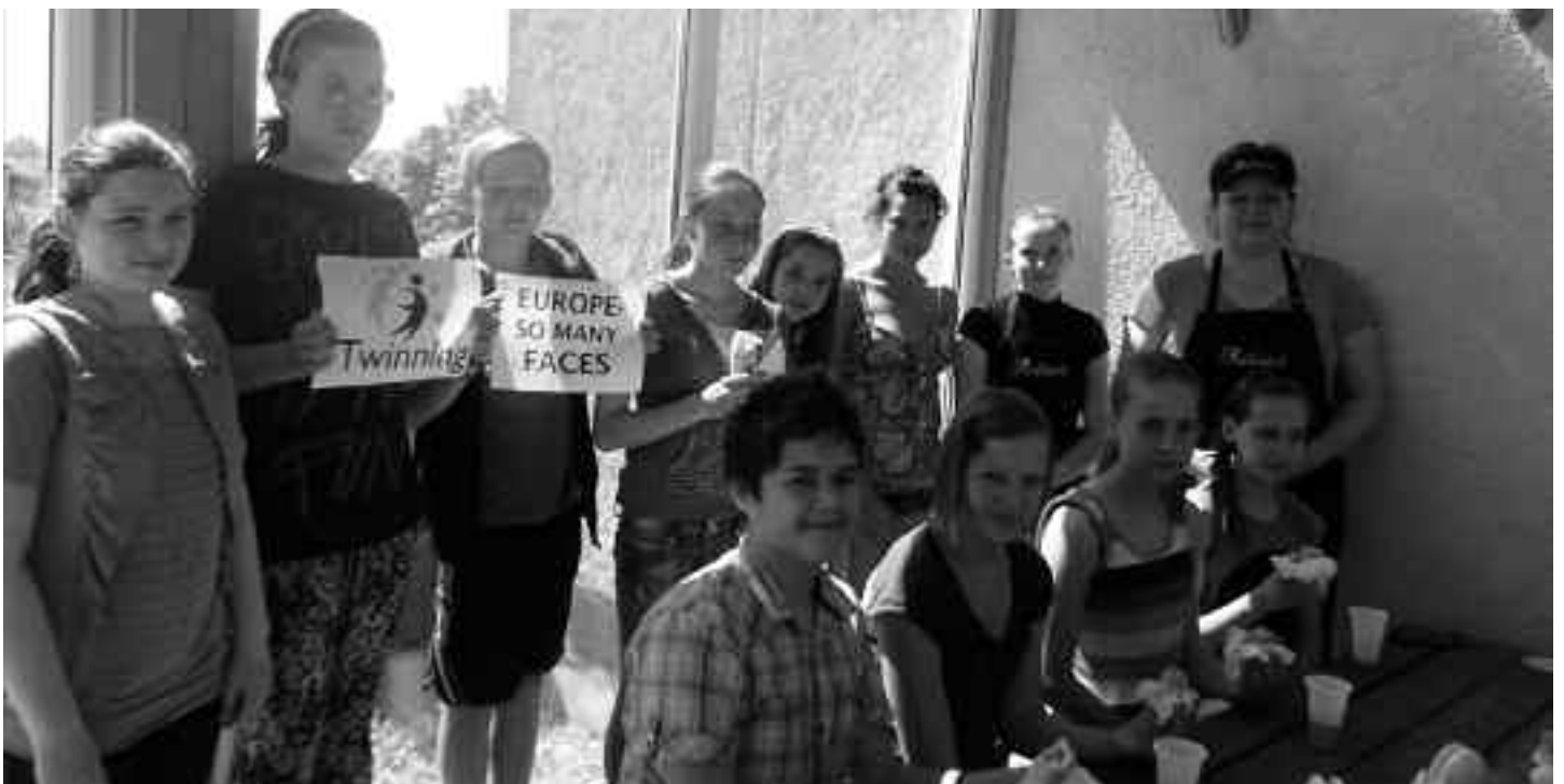
Foto: eTwinning projekta „Europe so many faces” noslēguma pasākums kafejnīcā „Kalniņā”

eTwinning projektus var lieliski pielāgot gan svešvalodu un IKT prasmju uzlabošanai mācību procesā, gan organizējot dažādas ārpusstundu aktivitātes.