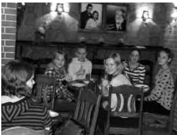
Foto:Tartu zinātniskajā centrā AHHA ( Igaunija) 2013.gada 28.oktobrī