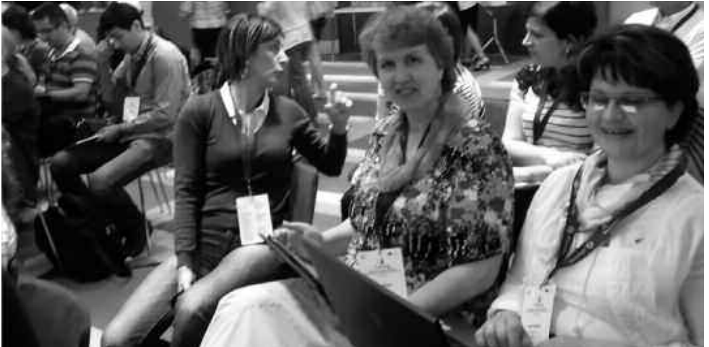
Foto: Skolotāju profesionālās pilnveides seminārā Stambulā, 2014.gada 21-24.maijā