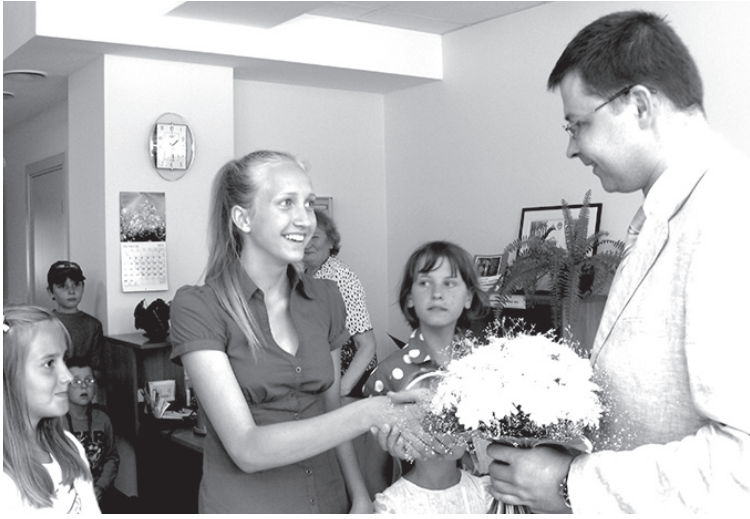
Pērn Aizkraukli ar pāris stundu ilgu vizīti pagodināja Latvijas Republikas Ministru prezidents Valdis Dombrovskis. Ar ziediem viņu sveica pilsētas bibliotēkas jaunās lasītājas.