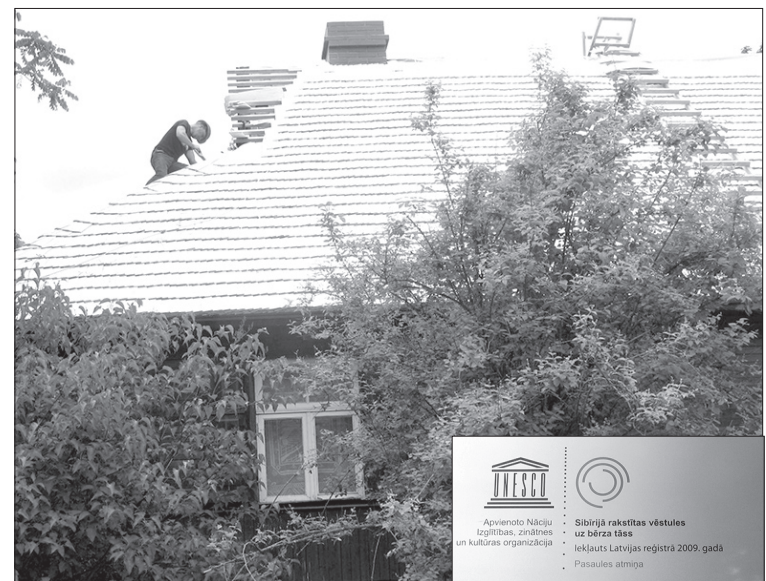
Aizvadītajā vasarā uzliktais jaunais jumts „Kalna Ziedu” galvenajai ēkai ne tikai nodrošina pret lietus un sniega radītajiem negadījumiem muzeja pastāvīgo ekspozīciju, tas labi saglabā arī siltumu telpās un darbinieki jūtas ērtāk un ir drošāki par muzeja vērtībām.

Šogad beidzas novada Integrētās Attīstības programmas termiņš. Programmu pildot, esam realizējuši daudzas kopīgas ieceres, kuras plānoja iepriekšējo sasaukumu deputāti kopā ar speciālistiem un iedzīvotājiem. Kopējā darbā esam veidojuši un attīstījuši savu novadu tādu, kādu to iecerējām. Paldies visiem, kuri iesaistī-