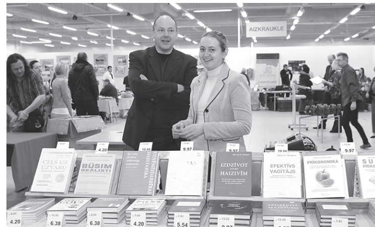
Zoldnera izdevniecība piedāvāja biznesa literatūru, kuras izdošanā viņi ir specializējušies.

Ar Eiropas Savienības fondu atbalstu rekonstruēta pārtikas noliktava.