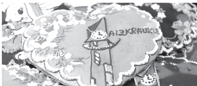
Suveniru-piparkūku ar Aizkraukles pulksteni uzņēmēju dienā piedāvāja IK „Keipenieši”.

Aizkraukles novada pašvaldības budžetā pilsētas un pagasta bibliotēku krājuma papildināšanai šogad iedalīti 9620 latu.