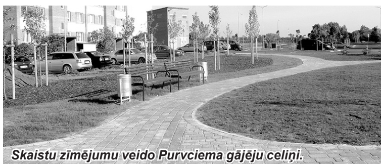
Skaistu zīmējumu veido Purvciema gājēju celiņi.

V aivaru tehnisko palīdzēkļu centrs 12. novembrī rīko izbraukumu uz Aizkraukli. Ergoterapeits no 11:00 līdz 12:00 pieņems klientus domes sēžu zālē (1. stāvā), Lāčplēša ielā 1.