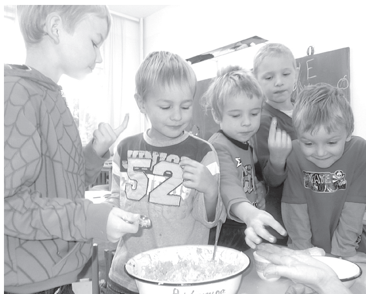
Sešgadnieki gatavo salātus