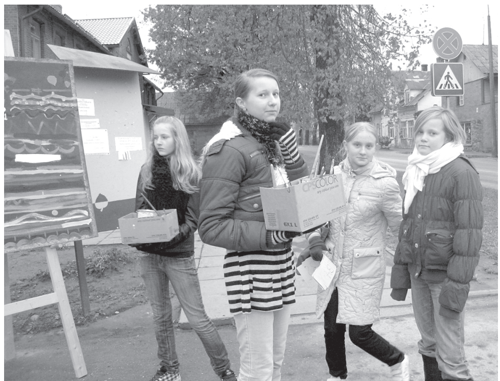
Akcijas organizatori - Aļoju mūzikas un mākslas skolas mākslas nodaļas 5. klases audzēkņi

Akcija Es par kultūru valstī tika rīkota, lai pievērstu sabiedrības uzmanību latviskās kultūras saglabāšanas problēmām nākotnē.