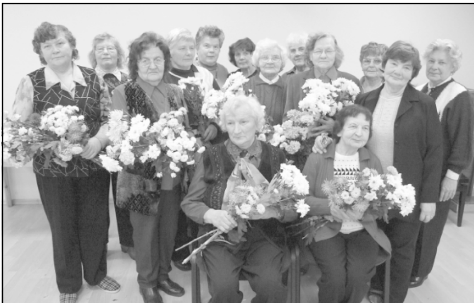
Saulgriezēs dāmas 2008. gada novembrī

Aktīvi un nenogurstoši darbojoties, pagājušis jau 10 gadu. 18. decembrī Staiceles Diēnas aprūpes centrā kopā ar Ziemassvētku svinībām notika klubīņa 10. dzimšanas dienas svinības. Hronistes Ausmas Virses veidotais