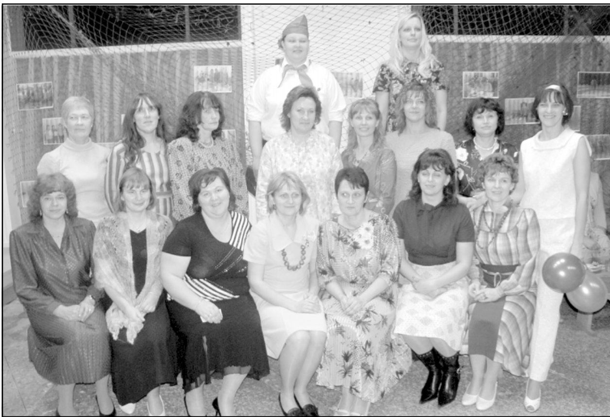
Liepales dalībnieces, 2009. gada novembrī atklājot pašu spēkiem izremontētās telpas