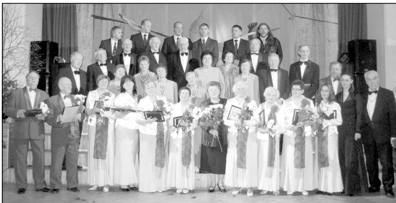
Jubilāri - Dziesmu draugi - kopā ar saviem viesko- lektīviem