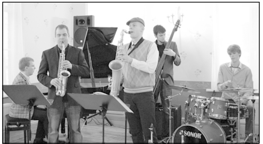
Staiceles mūzikas un mākslas skolas Kamīna zālē muzicē Silvesteri Orkesteri profesionāļi

Koncertā Silvesteri Orkesteri atskaņoja bebop ēras dižgaru kompozīcijas - skaņdarbus no Charlie Parker, Sam Jones, Sonny Rollins, Cannonball Adderley u.c. repertuāra. Ar šo programmu viņi gribēja radīt noskaņu atbilstoši 20. gs. 40. - 60. gadiem, kad bija aktuāls bebop novirziens (tam raksturīgi ātri tempi, instrumentālā virtuozitāte un harmoniskā intensitāte) džeza.