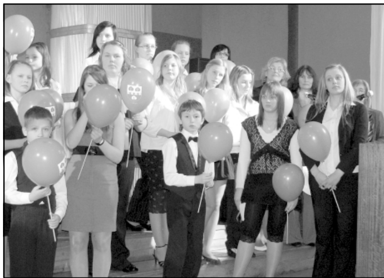
Katrs koncerta Dziesmu svītra dalībnieks no Alojas kultūras nama dāvanā saņēma krāsainu balonu

X Latvijas Skolu jaunatnes dziesmu un deju svētku koncepcija ir Svītra kods - dažādu krāsu svītras Latvijas novadu etnogrāfiskajos brunčos. Brunču audums ir unikālu līniju ritma salikuma bezgalīgs atkārtojums. Kā mūsu dzīve. Dziesmu svītra ir sarkanās krāsas svītra svētku logo. Deju svītra zilā - violetā.