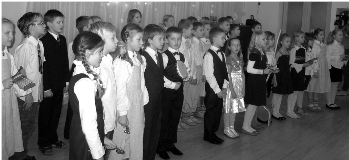
Pilsētas dzimšanas dienā Aizkraukles Goda pilsoņi apmeklēja Aizkraukles pagasta sākumskolu, iepazīs ar mācību, sporta un atpūtas iespējām, noklausījās audzēkņu (ieskaitot pirmsskolas) koncertu.

Aizkraukles uzņēmēji! Esiet aktīvi izstādes-gadatirgus dalībnieki, apmeklētāji grib redzēt un dzirdēt vairāk savējo.