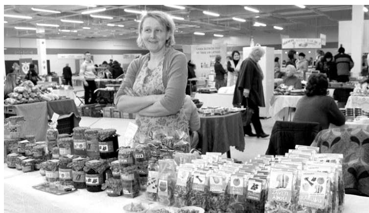
Uzņēmēju dienas – 2013. kopskats.