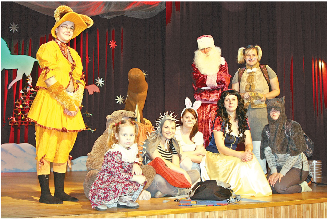
Sniegbaltītes skolā mācības var sākties

Jau piecpadsmito gadu vakarskolā notika Rūķu balle. Arī šogad to organizēja skolas pedagogi, darbinieki un skolēnu dome. Vakarskolas Rūķu balle ir īpašs pasākums, jo audzēkņi te satiekas nevis klasē, bet pavisam citā gaisotnē. Šī balle ir kā vakarskolas spogulis, reizi gadā tā parāda, kas mēs esam un kāda ir vakarskolas īpašā vieta pārējo skolu saimē. Šogad varam lepoties kopumā ar 84 mūsu audzēkņu atvasītēm.