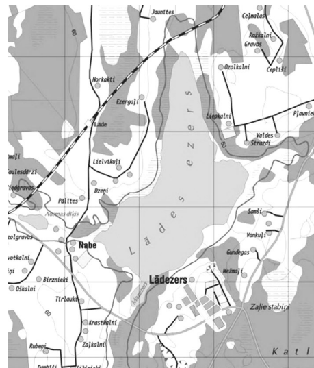
Lādes ezera karte