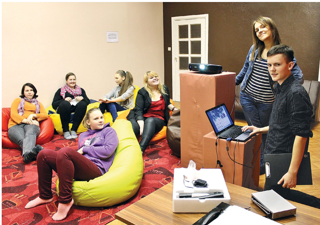
Jauniešu domes aktīvistu nākotnē raugās ar cerīgu skatu

17. janvārī Limbažu Jauniešu centrā (LJC) kā skudras pūznī nūdzēja Limbažu Novada jauniešu domes (LNJD) aktīvistu. Iemesls tam bija pavisam nopietns – 18. janvāris ir LNJD dibināšanas datums. Tieši tad 2011. gadā novada pašvaldības ēkas lielajā zālē pulcējās pirmais LNJD aktīvistu sastāvs. Nu jau trešo gadu mēģinājām apkopot, atcerēties un analizēt visu labo, kas līdz šim paveikts, un, nopūšot tortē svečītes, katrs pats un visi kopā varējām izteikt vismaz vienu vēlēšanos. Jāatzīmē, ka tik plašas svinības varējām rīkot, pateicoties tam, ka 2013. gadā tikām pie jaunām, skaistām un plašām telpām – LNJD par savu mājvietu kopš septembra sauc LJC.