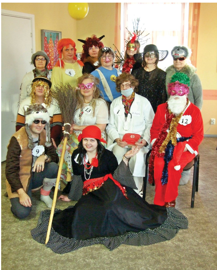
Pasākuma dalībnieki krāšņos tērpos un maskās

13. janvārī Limbažu Dienas centrā tika gaidītas dažādas maskas. Atnāca Vilks un Sarkangalvīte, Suns un Karlsons, Salavecītis un Piķa dāma, Velneņīte un Meža Gariņš, Daktere, Čigānmeitene un Panks, atlidoja Brīnumputns. Sarīkojumu vadīja Raganīņa. Gan maskas, gan skatītāji labprāt ie-