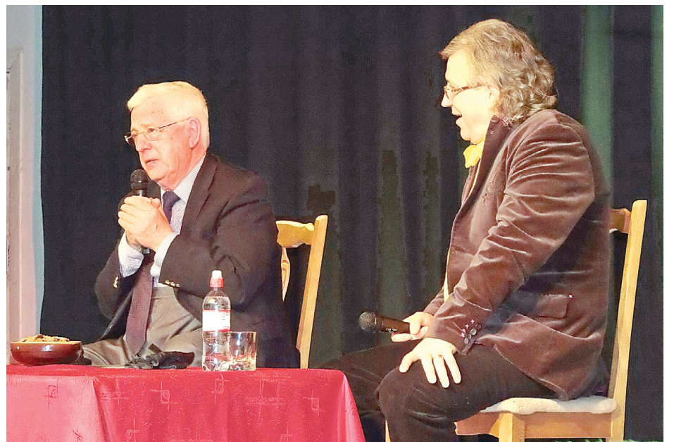
Saruna ar Raimonu Paulu un Andri Bērziņu par aktuālo, muzicēšanu un kārtīgām klavierēm