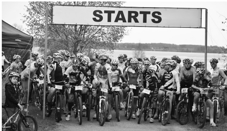
100 velobraucēju startam gatavi.