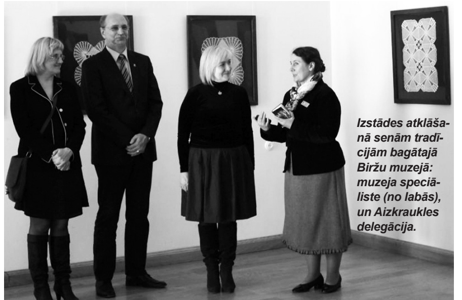
Izstādes atklāšanā senām tradīcijām bagātajā Biržu muzejā: muzeja speciāliste (no labās), un Aizkraukles delegācija.

Mežģīņu izstādes atklāšanā piedalījās novada domes