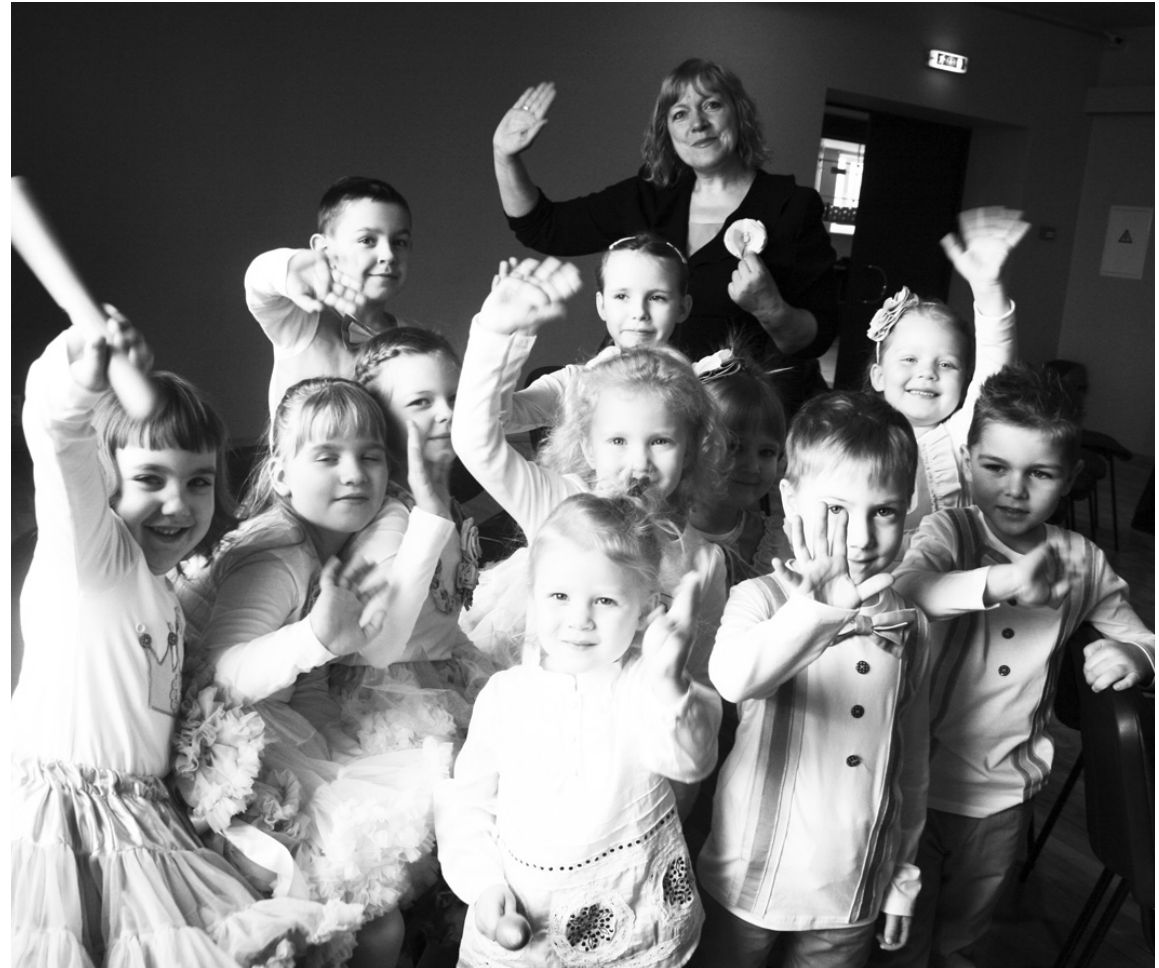
1. jūnijs – Starptautiskā bērnu aizsardzības diena. Lai mazajām „Meduslāsītēm” jauka un skanīga vasara!

Apsveicam topošos jaunus māksliniekus un skolotājas!