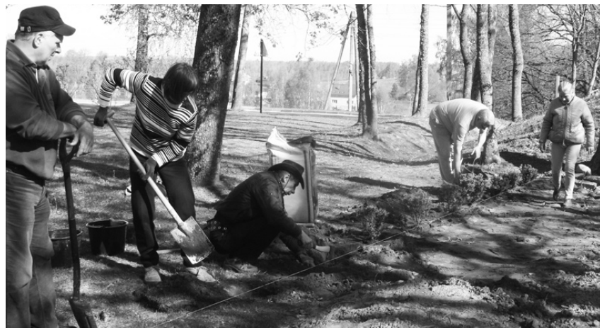
„Laika zīme”: ja domes vadītājs (pa kreisi) savācis visus zarus Kalna Ziedu pilskalnā, šogad līgosim tur.