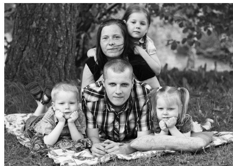
Neiju ģimenes foto „Kopā ar sirdi un cieņu”.

Šī nodarbība nebija tikai izklaide, jo katrai ģimenei bija dots uzdevums sagatavot sa-