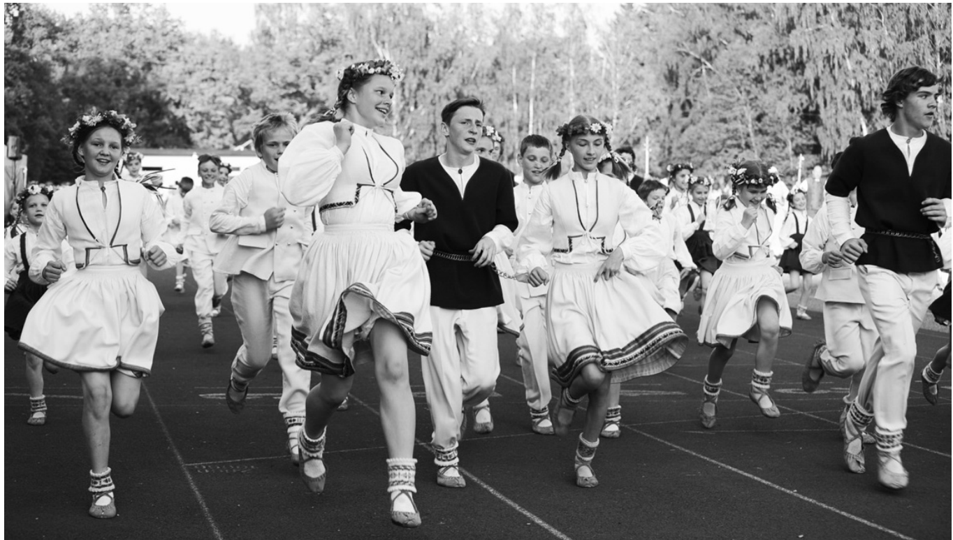
Kur jaunība, tur prieks, atraisītība, liksme. To novada svētkos netrūka ne ielās, laukumos, ne stadionā. Viesu deju kolektīvu ģeogrāfija – visa Latvija no Daugavpils līdz Liepājai.

Bilētes: www.bilesuparadize.lv/ . Bilēšu cenas 18, 15, 12, 10, un 7 eiro.