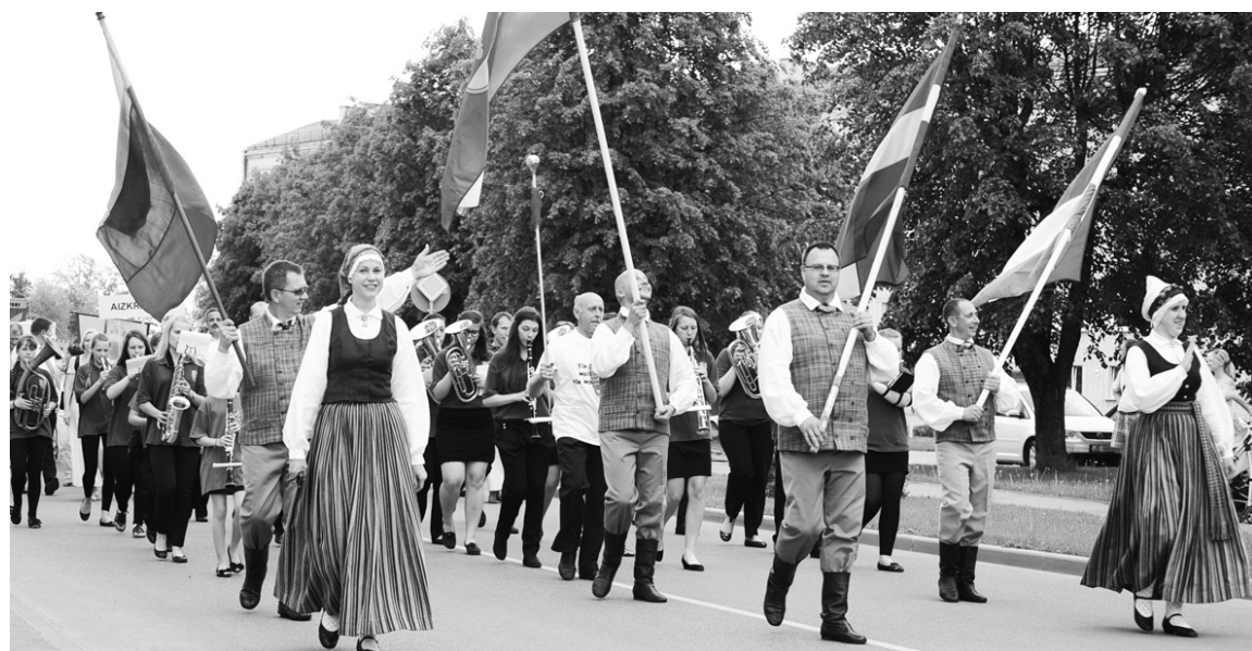
Novada svētkos. Gandrīz 4000 dejojošu bērnu no visas Latvijas veidoja skaistāko svētku gājieni novada vēsturē. Priekšplānā valstu – Lietuvas, Latvijas un Ungārijas karogi, protams, arī Aizkraukles novada karogs. Gājieni patika gan pašiem dalībniekiem, kuri ar apbrīnu vēroja mūsu pilsētu, gan aizkraukļiem skatoties.