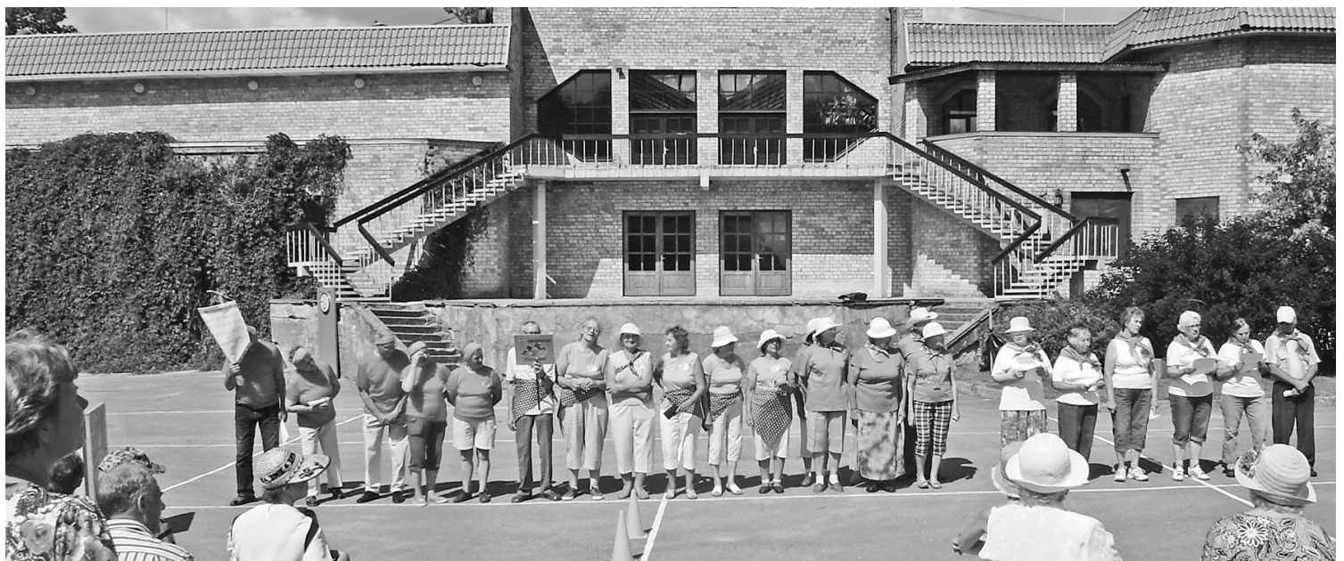
17. jūlijs. Karsta pēcpusdiena Aizkraukles pagasta estrādē. Romantiski atturīgas sporta senioru Sporta dienas dalībnieki un līdzjutēji gatavi startam.

Šis skrējieni ir simboliska vēsts, kas pauž vienotību un sadraudzību starp dažādu tautību un pārliecību cilvēkiem.