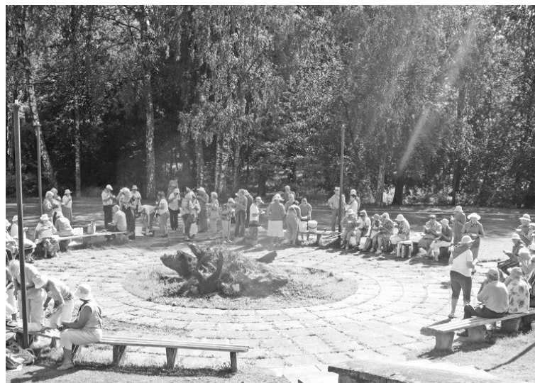
Sporta programmu beiguši, pasākuma dalībnieki uz salātu gatavošanu un izklaides daļu pārcēlās uz ugunsкура laukumu – tuvāk enu sološajai birzītei.