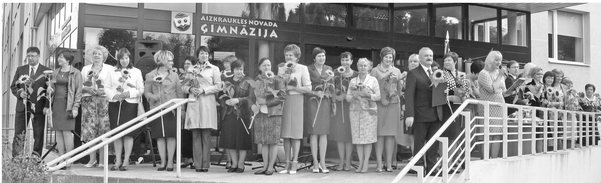
Katrs skolotājs (arī sākumskolas klašu) novada ģimnāzijā vēl pirms skolas gada atklāšanas saņēma pa saulespuķei, kas brīdī, kad skolotāji 1. septembrī iznāca pie skolēniem un vecākiem, radīja ļoti jauku noskaņu.

Uzņēmēji tika iepazīstināti ar Nodarbinātības Valsts aģentūras jaunajiem un Pieaugušo izglītības un inovāciju atbalsta centra iecerēm, aktualitātēm lauku attīstībā, ar ierosinājumu izveidot radio Aizkrauklē. Kopīgi pārrunāja turpmāko sanāksmju tematiku un novada aktualitātes.