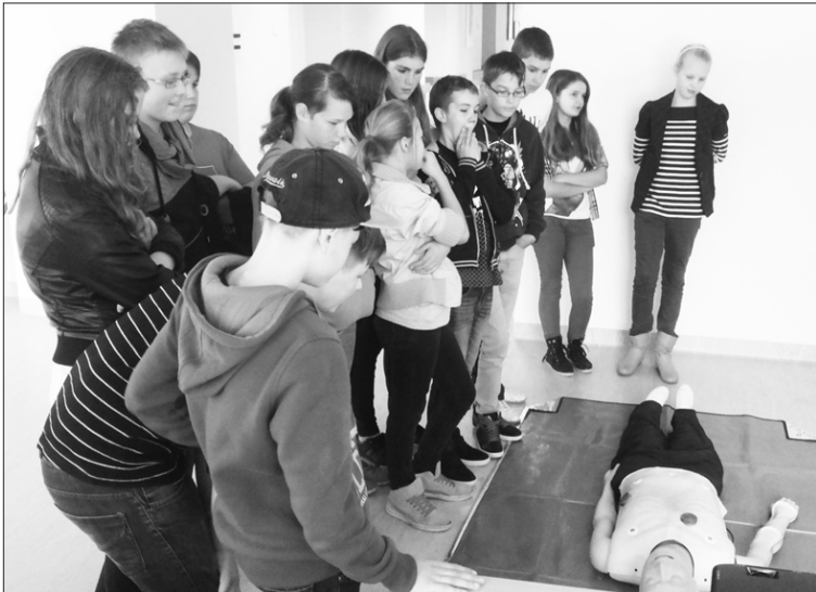
Neatliekamās medicīnas brigādē Aizkrauklē apmeklēja arī sākumskolas 6.klases skolēni.