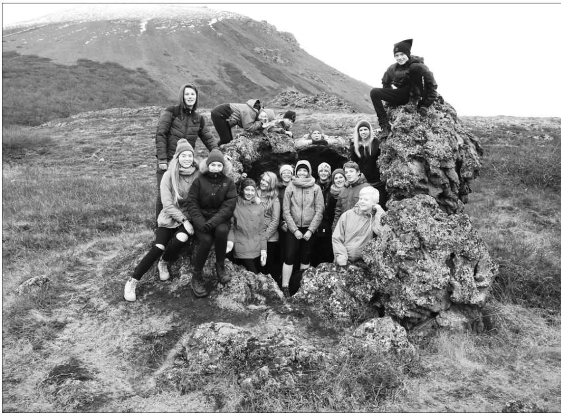
Projekta dalībnieki – Islandes skolēni un aizkraukļieši lavas alā.