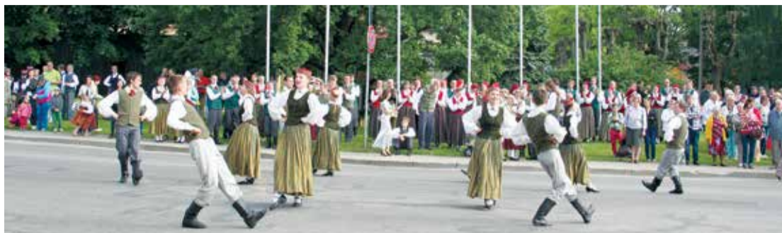
Limbažu novada deju svētki ar lustīgām dejām sākas Baumaņu Kārļa laukumā, kur skatītājiem raitu dejas soli rādīja Limbažu novada deju kolektīvi.

Koncerts idejiski iesākās ar saules lēktu un skaistu rīta idilli