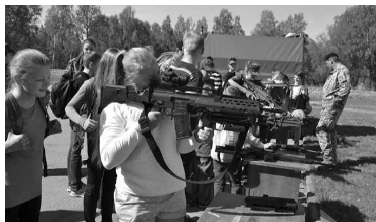
Lielu jauniešu interesi izraisīja Nacionālo Bruņoto spēku pārstāvju un 209. Limbažu Jaunsardzes vienības prezentācija, kurā tika izrādīta tehnika un ekipējums, kā arī notika paraugdemonstrējumi un izspēlētas dažādas veiklības pārbaudes.