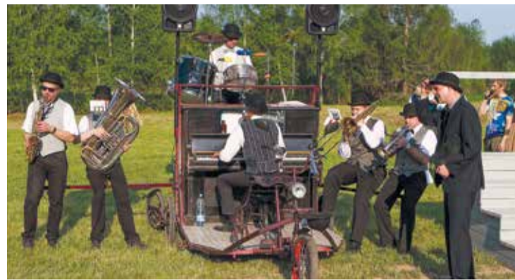
Vakara svētku programma „Melngaiļu, brīvdabas estrādē sākās „ieripojot” Kuldīgas kultūras centra orķestropēdam ar ceremonijorķestri „Miers un Bērziņš”.

Svētku laikā viesi varēja iesaistīties arī Emiļa Melngaiļa iemīļotās aktivitātēs – spēlējot šahu, makšķerējot un braucot ar duirteni (tā komponists dēvējis