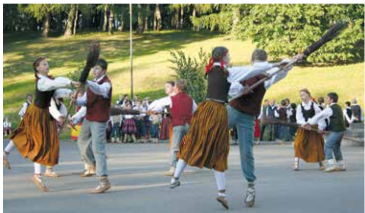
Vakara gaitā skatītāji ar lielu aizrautību varēja vērot gan mazus, gan pieredzējušus dejotājus, kuri izpildīja interesantas dejas – kā, piemēram, „Slotu danci”.