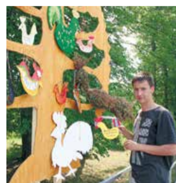
Kori svētkiem bija gatavojušies vien dziedot, bet katrs kolektīvs bija izveidojis arī savu gaiļu, ko, ierodoties estrādē, iekāra Limbažu Profesionālās vidusskolas audzēkņu veidotajos kokos.

velosipēdu). Tajās piedalījās liels skaists dalībnieku, no kuriem godalgotas vietas guva arī koristi. Tāpat visas dienas garumā viesi komponistu vairāk varēja iepazīt, izstaigājot viņa dzimtajās mājās, kurām šogad aprit 100 gadi. Emiļa Melngaiļa Vidrižu novadpētniecības muzejā apmeklētāji varēja aplūkot ne vien dažādas ekspozīcijas, bet arī noskatīties Emilim Melngailim veltītu filmu. LW