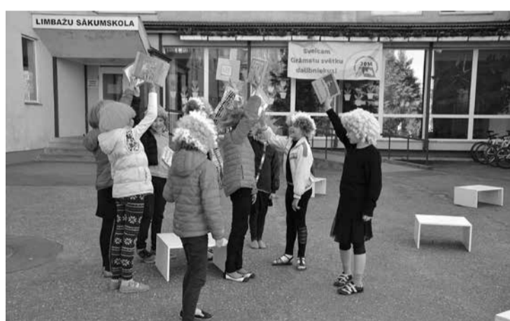
Ar interesantu teatrālu uzvedumu Limbažu un Alojas novadu 13. Grāmatu svētku dalībniekus no rīta sagaidīja Limbažu sākumskolas skolēni.