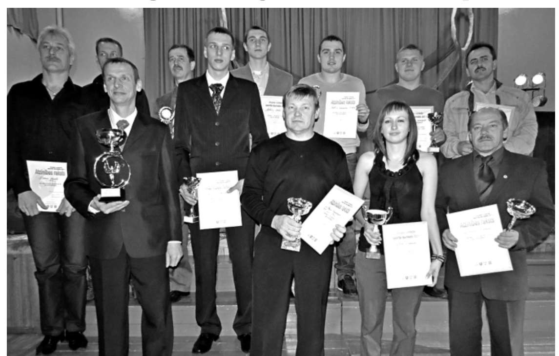
2011. gada labākie Aļoju novada sportisti un komandu pārstāvji vienkopus

Vērtējot aizvadītā gada rezultātus, A. Auseklis uzteica Limbažu novada atklātā čempionāta 5:5 pirmās vietas ieguvējus - VJFC futbola komandu, arī FK Ungurpils , kuri čempionātā 7:7 ieguva 4. vietu. Tāpat atzīmēja divu vīriešu un vienas sievietes basketbola komandas startus Vidzemes basketbola līgas spēlēs, arī volejbolistus, kuri ieguva 6. vietu Limbažu novada atklātajā čempionātā. Aļoju novads īpaši lepojas ar motokluba ASB , kas Latvijas Alternatīvās motosporta asociācijas (L.A.M.A.) rīkotajās motosporta sacensībās kopvērtējumā ieguva 2. vietu. Netika aizmirsti arī zolītes spēlētāji, galda tenisisti un karatē sportisti. Taču salīdzinājumā ar pērn iegūtajiem rezultātiem sasniegumi 2011. gadā nav bijuši tik teicami. Tāpat sporta metodiķis atzina, ka nedaudz samazinājies Aļoju sporta halles apmeklētāju skaits. Vērsa uzmanību uz to, ka nākotnē vajadzētu paplašināt interešu izglītības iespējas tieši sportā, rast iespēju finansiāli atbalstīt trenerus, kuri dodas pie sportistiem no tālienes. Nobeigumā pasākuma vadītājs vēlēja sportistiem labus panākumus un jaunas iespējas. Atzinības rakstus par ieguldījumu sportā un tā popularizēšanā saņēma Kalvis Grāveris, Juris Višņakovs, Jānis Sedlenieks, Oskars Kuzņecovs, Ozolmuižas pludmales volejbola meiteņu komanda, U-13 VJFC futbola komanda un treneris Jānis Valāņins, Elvis Arnavs, Sanija Ozola, Jēkabs Gērmanis, Ustrisovu ģimene, Arnavu, Meinardu, Mieziņu, Gērmaņu, Liniņu un Vītolu ģimenes, Diāna Miezīte, Inga Konrāde, Inga Brente-Mieze,