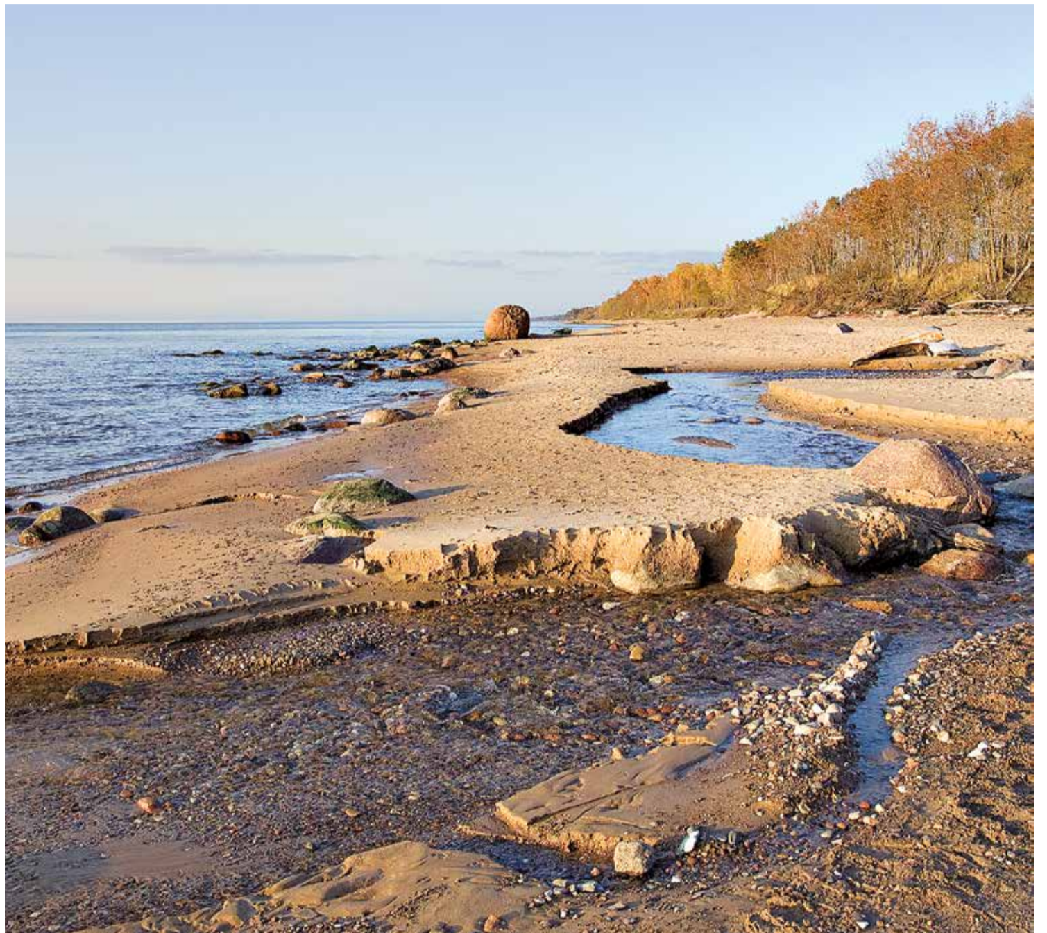
Limbažu novada attālākais pagasts, rēķinot no novada centra, ir viens no svarīgākajiem novadā un var lepoties ar daudzām bagātībām, tostarp – brīnišķīgu jūrmalu.

5,8 kilometrus garā jūras robeža ir tikai viena no pagasta, ja tā var izteikties, bagātībām. Kā uzsver pagasta pārvaldes šefs, tad visvairāk jāpriecējas par pagasta uzņēmīgajiem cilvēkiem: „Ir prieks par uzņēmējiem, kas sakārto lauksaimniecības zemi, līdz ar to apkārtējā vide tiek padarīta daudz pievilcīgāka. Pie mums vērsušies vairāki uzņēmēji, kuri būtu gatavi attīstīt savu uzņēmējdarbību pagastā, bet nav varējuši atrast sev piemērotus brīvos zemes gabalus vai ēkas. Tāpēc vēlos aicināt visus, kam pieder vecās kūti,