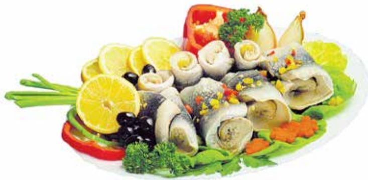
Skultes uzņēmums Baltijas zivis – 97 ir lielākais uzņēmums pagastā, kas pazīstams visā Latvijā un aiz mūsu valsts robežām.

not ekoloģiski drošus apstākļus ražotnes darbībā, darbinieku finansiālo stabilitāti un izaugsmi, kā arī veidojot komfortablu, labvēlīgu apstākļu kolektīvu. Uzņēmumam ir vairāk nekā 300 sadarbības partneri Latvijā, kā arī Lietuvā un Igaunijā, uzņēmums piedalās izstrādēs un pārtikas gadatirgos. SIA Baltijas zivis – 97 ir vairākkārtēji konkursa MADE IN LATVIA laureā-