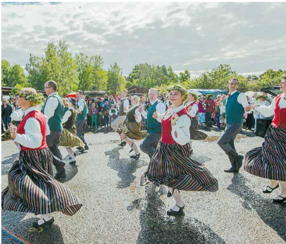
Jāņu ieligošanas koncerts, Skultes tirgus laukumā.