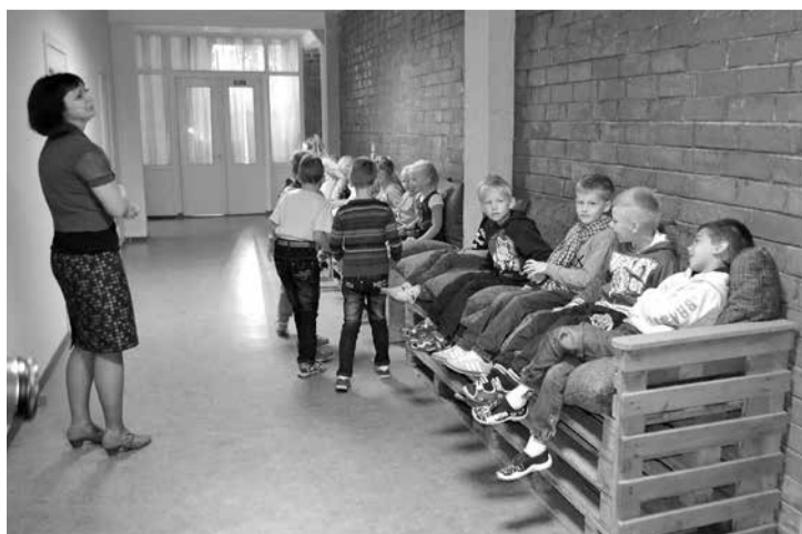
Atpūtas dīvēns Umurgas skolā.

Limbažu novada pašvaldības Attīstības un projektu koordinatore