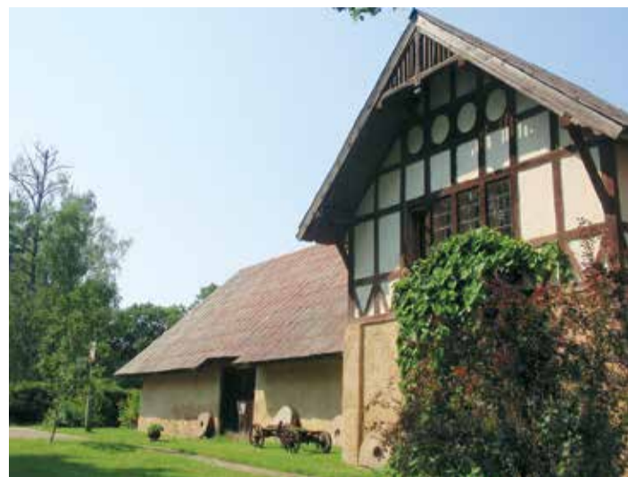
Ķirbižu meža muzejs ir viens no visplašāk apmeklējamiem apskates objektiem Vilķenes pagasta teritorijā.