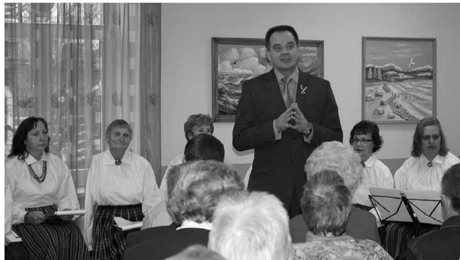
Limbažu pilsētā deklarētās politiski represētās personas pulcējās svinīgajā pasākumā Limbažu novada Sociālā dienesta telpās.