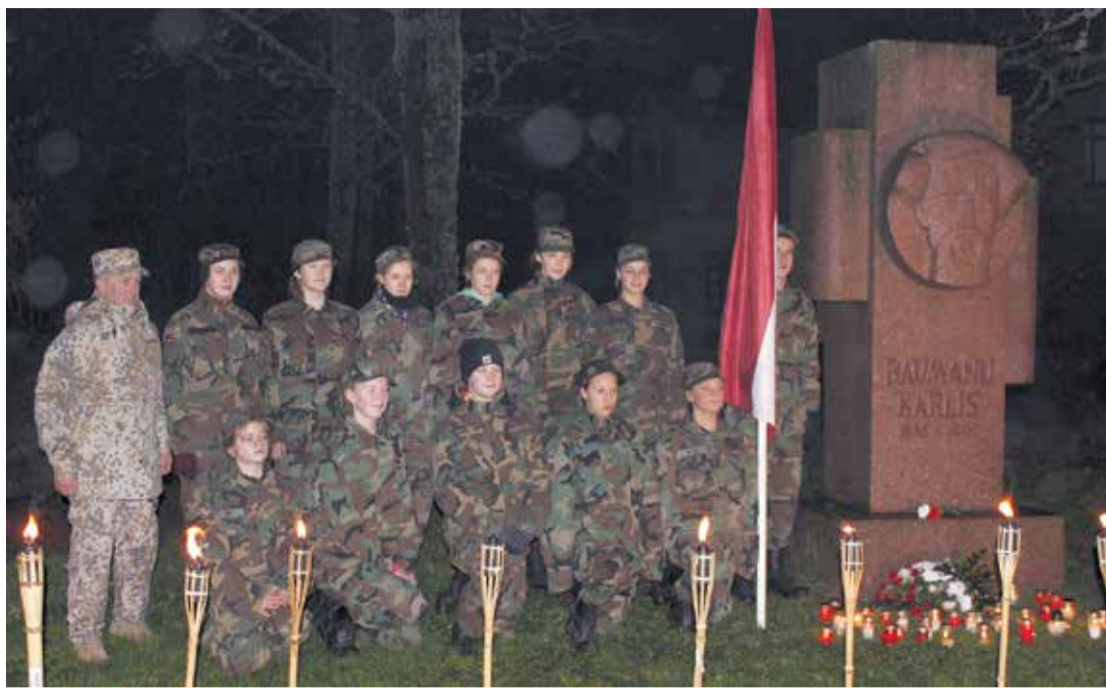
Lāčplēša dienas svinības ir tikai viens no daudzajiem patriotiskajiem pasākumiem Viļķenē. Pasākumi parasti pulcē ļoti daudzus apmeklētājus.

Ilmārs Dzenis, pagasta pārvaldes vadītājs, īpaši uzsver pagasta aktīvo sabiedrisko dzīvi, kas ļauj ne vien iesaistīt iedzīvotājus pagasta infrastruktūras objektu izveidē un sakārtošanā, bet arī nodrošina iedzīvotājiem pie-