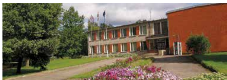
Vilķenes kultūras nams jau 70 gadus ir visa pagasta kultūras un sabiedriskās dzīves centrs.

gada karnevāli – tradīcija vairāk nekā 40 gadu garumā, Lielās balles, kurās kopā atpūšas pagasta uzņēmumu, iestāžu, biedrību kolektīvi, koncerti – konkursi „Tu tikai dzied”, amatiermākslas kolektīvu sezonas noslēguma koncerti, muzikantu saiets „Spēlē, muzikanti!” un, protams, pasākumi, atzīmējot Latvijas Republikas proklamēšanas gadadienu. Ar iedzīvotāju aktīvu līdzdalību notiek arī kopīga latvisko svētku un tradīciju kopšana – Lieldienas, Jāni, Ziemassvētki. Šogad tika aizsāktas arī jaunas tradīcijas – Vilķenes pagasta svētki, pasākums „Kā balta puķe bērns ir uzdziedējis” – jaundzimušo bērniņu uzņemšana pagasta iedzīvotāju saimē. „Domāju, ka mums ir, ar ko lepoties, jo reti kurā pagastā