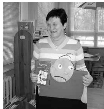
Īpaši gatavotie spilveni Viļķenes bibliotēkā rada krāsainu un pasakainu noskaņu.

Limbažu novada pašvaldības Sabiedrisko attiecību speciāliste