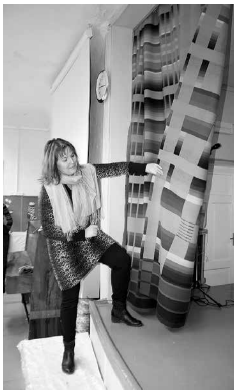
Aušanas pulciņa Katriņa darinātie Viļķenes skolas skatuves aizkari.

Iedzīvotāju grupa AC Pāle projekta aktivitātēs bija paredzējusi Pāles pamatskolas hokeja komandas izveidi un vārtsargu ekipējumu iegādi. Diemžēl vērtēšanas komisijai izdevās apskatīt tikai vienu no iecerētajiem 2 vārtsarga ekipējuma komplektiem. Arī biedrībai Sporta klubs „Limbaži” nebija izdevies realizēt pilnībā visu projektu iecerē-