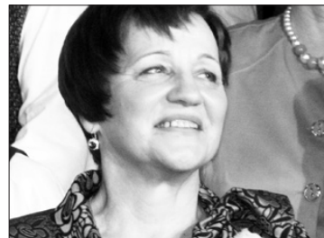
Aijai Melnei pieder ne tikai pirmās dejotājas, bet arī kolektīva izveidotājas gods.

Ar skaistu un sirsnīgu koncertu iepriekšējā gada nogalē vidējās paaudzes un senioru deju kopa „Aizkrauklis” kopā ar draugiem – deju kolektīviem „Aija” no Ogres, „Talderi” no Preiļiem, „Atvars” no Jaunjelgavas, „Biguļi” no Bauskas nosvinēja kolektīva pastāvēšanas 30 gadu jubileju.