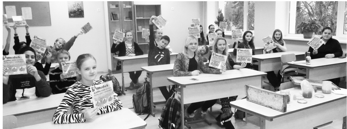
Pilsētas sākumskolas 6. a klase Medus brokastis.