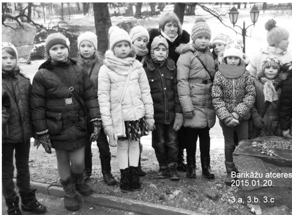
Barikāžu atceres 2015.01.20.