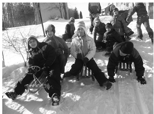
Atmiņām par bērniņu, kura tik ātri pāiet...