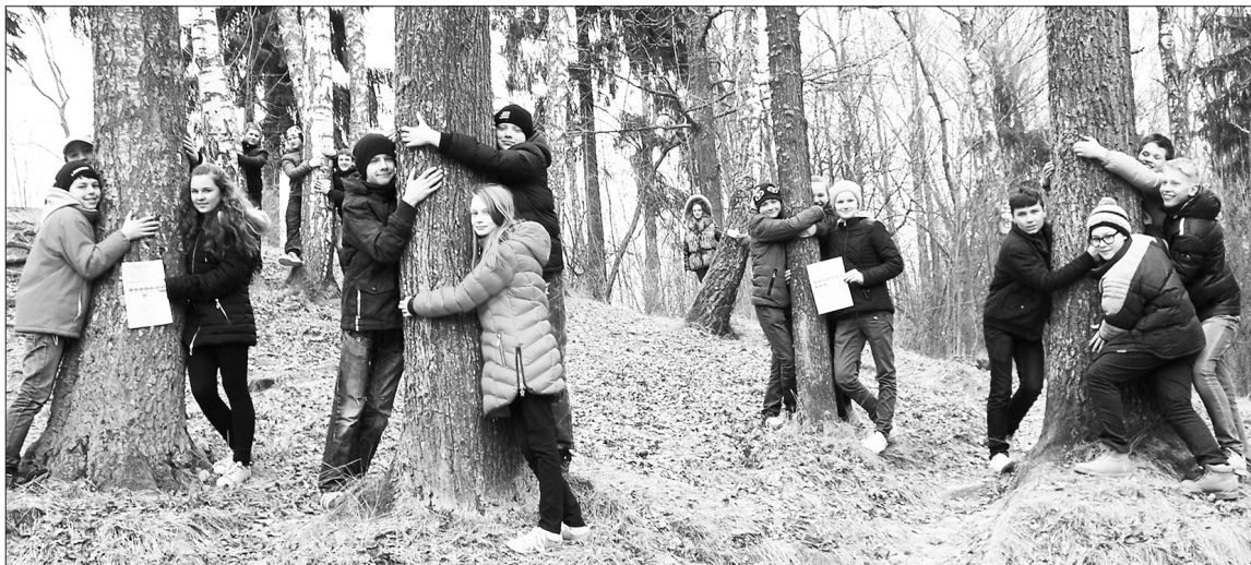
7. klases skolēni jūtas izglābūši šos skaistos Aizkraukles kokus.