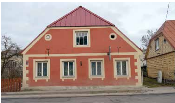
Ēka Cēsu ielā 9.

Ēkai Ģildes ielā 2 renovēta fasāde pret Baumaņu Kārļa laukumu, pret Parka ielu. Pašvaldības