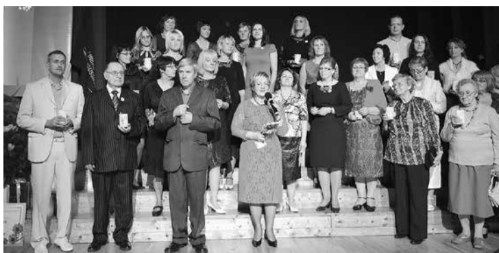
Limbažu vakarskolas bijušie un pašreizējie pedagogi un darbinieki sarīkojuma noslēgumā.