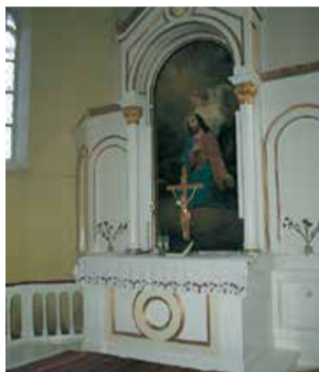
Viļķenes Sv. Katrīnas evaņģēliski luteriskās draudzes aktīvākie pārstāvji veikuši baznīcas altāra un mācītāja kanceles restaurāciju.