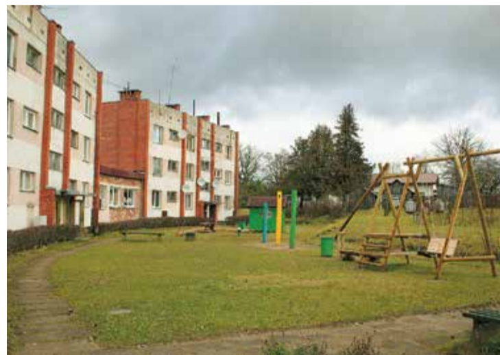
Pāles pagasta aktīvo iedzīvotāju grupas „K.A.M.” īstenojotais projekts.

šumkrūmu stādījumiem, lai skolēniem būtu iespējams lietderīgi pavadīt no mācībām brīvo laiku svaigā gaisā.