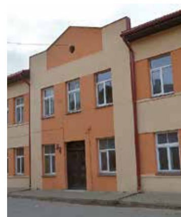
Ēka Dārza ielā 16.

Ēkai Cēsu ielā 13 nomainīti vecie apšuvuma dēļi, nosiltinātas un nomainītas logu aplodas un palodzes un nokrāsota ēkas fasāde. Pašvaldības līdzfinansē-