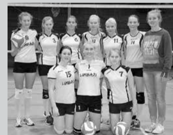
Limbažu un Salacgrīvas novadu sporta skolas U-16 grupas volejbolistes izcīnījušas 4.vietu Latvijas Volejbola federācijas “Kausa izcīņā”.

Limbažu un Salacgrīvas novadu sporta skolas volejbolistes dažādās vecuma grupās aizvada cīņas Latvijas Volejbola federācijas “Kausa izcīņā”. U-14 volejbolistes sacensības jau noslēgušas ar 8. vietu kopvērtējumā. U-16 vecuma grupas meitenes izcīnījušas augsto 4. vietu valstī, savukārt U-17 volejbolistēm finālspeles norisināsies novembra beigās Talsos, U-12 un U-19 – decembrī Rīgā. Veiksmi meitenēm!