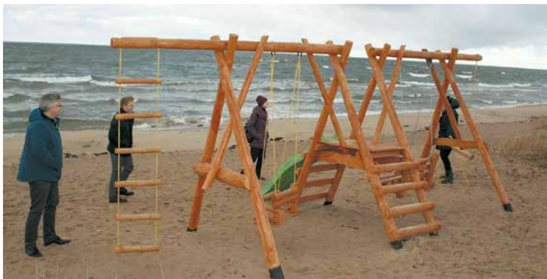
Skultes volejbola sporta biedrības īstenotais projekts.

Limbažu sākumskolas mazpulka organizācija īstenoja projektu „Estētiskas un veselību veicinošas vides labiekārtošana Limbažu sākumskolā”, kur pie skolas tika izveidota zaļā zona ar spāres formas soliņiem, ziemciešu un ko-