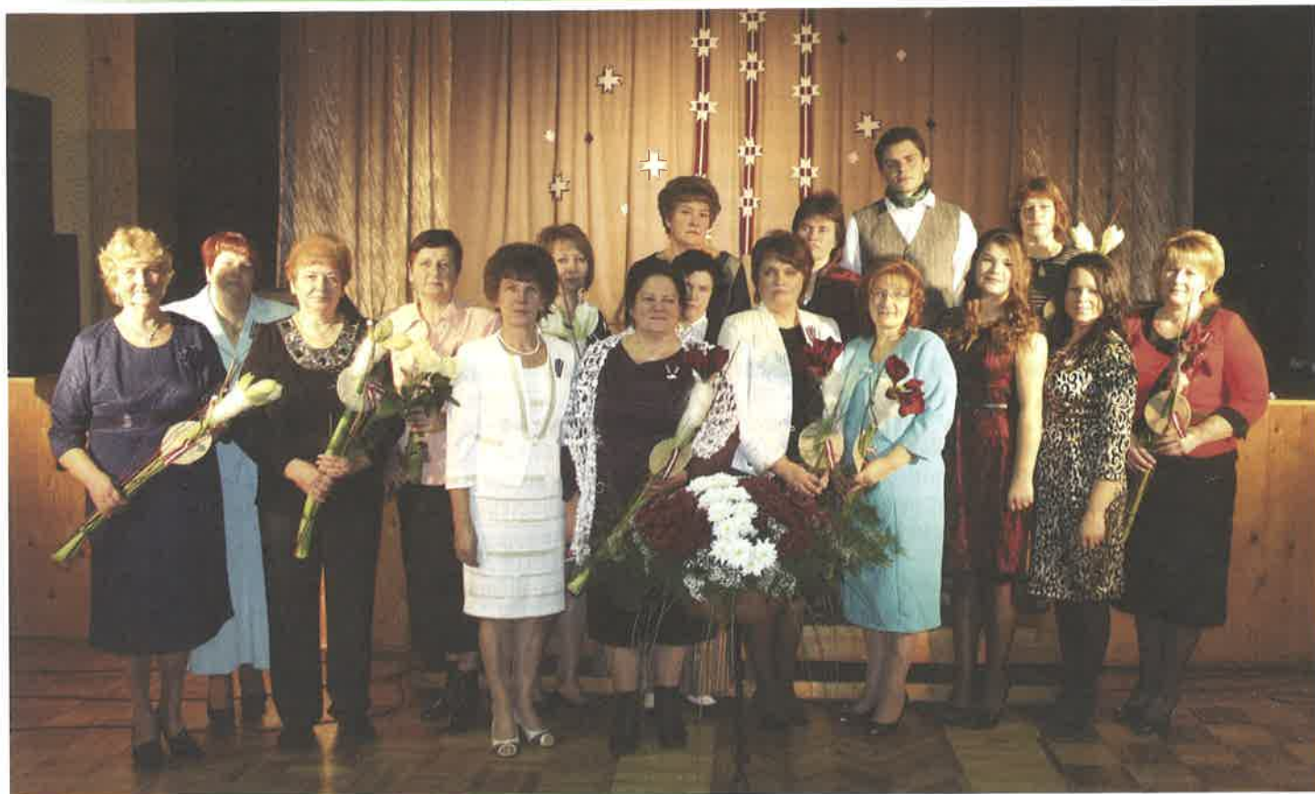
Valsts svētkos Aknīstes novadā godina labākos. Turpinājums 13. lpp.