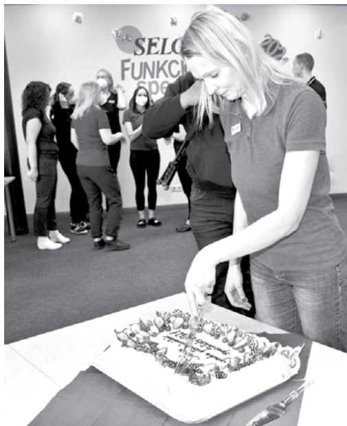
Kolēģi sarūpējuši pārsteigumu: torti un ziedus.