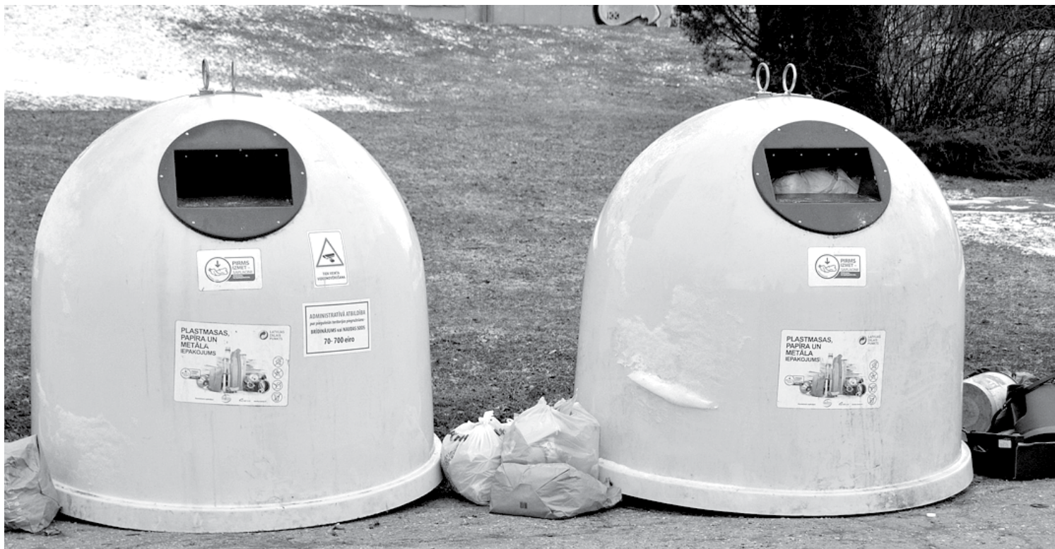
Pie šķiroto atkritumu konteineriem nereti vērojama šāda aina. Daļa sašķirotā netiek iemesta tvertnē, ne viss noģādātais ir šķirojami atkritumi, daļa konteinerā neietilpst izmēra dēļ.