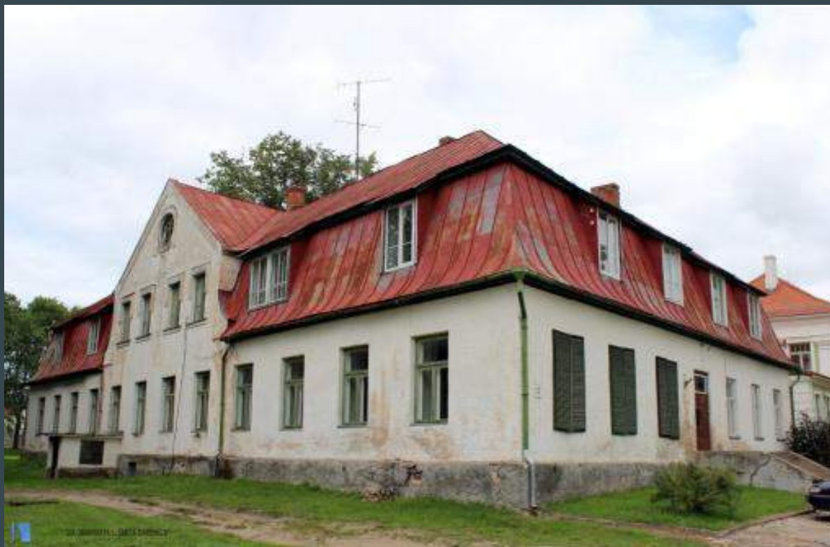
Ēka Alūksnē, Ojāra Vācieša ielā 2a, kuru plānots izveidot par mūsdienīgu bibliotēku