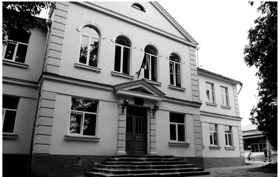
Līgatnes novada vidusskolas ēka Augšlīgatnē

Tik nelielam skolēnu skaitam darba rezultāti ir pārsteidzoši augsti, ja ņem vērā, ka vienīgā iespēja papildus izglīties Līgatnē ir Mākslas un mūzikas skola. Bērniem konkursos, olimpiādēs ir ļoti labi sasniegumi. Priečajos, ka skolā mācās gudri bērni un ar viņiem strādā isti sava darba entuziasti. Piemēram, atzinīgus vārdus gribu vēltīt sporta skolotājiem, kuri spējuši ieinteresēt skolēnus aktīvi sportot ne tikai skolā, stundās, bet motivējuši viņus iesaistīties arī ārpus skolas un ārpus novada sporta norisēs. Atšķirībā no pilsētas vides, te, kā jau plašā lauku teritorijā, bērniem pie fiziskajām aktivitātēm pieskaitāma arī kājām nākšana no rīta uz skolu un pēcpusdienā mājup, kad iespējams baudīt veselīgu vidi, dabu, tas norūda, uztur formā un stiprina.