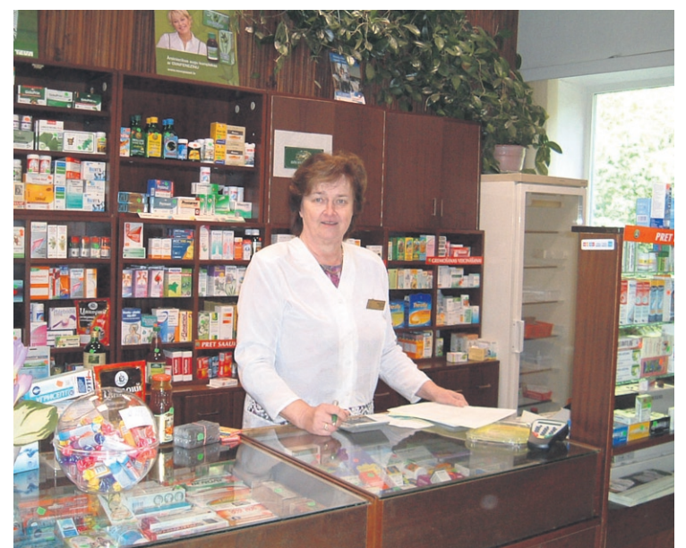
Kopš 1973.gada Maija strādā Ligatnes pilsētas aptiekā

Aptuveni divdesmit cilvēkus esmu apmācījis skārdnieka arodā. Darbs gan nav no vieglajiem – pamatā roku darbs, arī matemātiskās zināšanas nepieciešamas – jābūt precīziem aprēķiniem, lai nekļūdotos. Tagad jau skārdnieku darbu ir atvieglojušas mašīnas, piemēram, skārda valcējamās