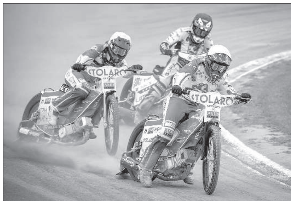
Пришлось бороться в каждом заезде.