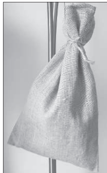
Высушенные цветки мать-и-мачехи.

поступали. Думаю, что у заваривания на водяной бане есть своя логика, но человек – существо ленивое!