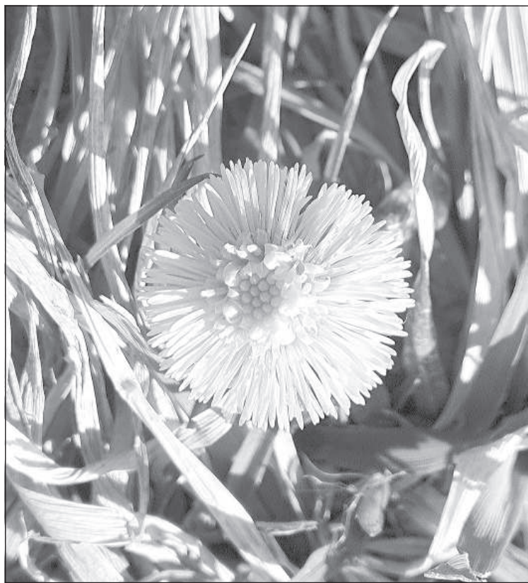
Как весеннее солнышко.

В Латгалии издавна считалось, что землю можно пахать, когда цветет мать-и-мачеха. Это поверье возникло в то время, когда помощником для крестьян в полевых работах была лошадка, но отголоски этого