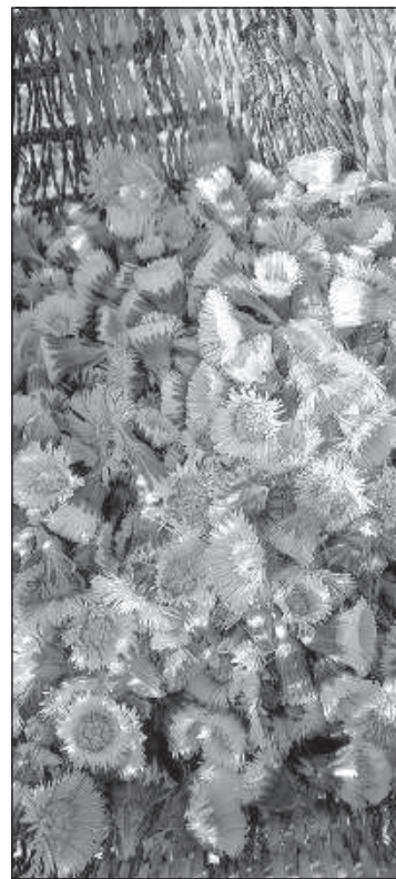
Будет чай из мать-и-мачехи.

Из цветков мать-и-мачехи получается визуально красивый, вкусный, ароматный и, конечно же, полезный чай. Также можно использовать листья, такой вариант чаще всего продается в аптеках. Знаю, что мать-и-мачеху рекомендуют заваривать на водяной бане, но я обычно так не делаю. И лень, и я никогда не видел, чтобы люди так