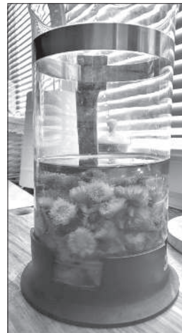
Чай из цветков мать-и-мачехи.