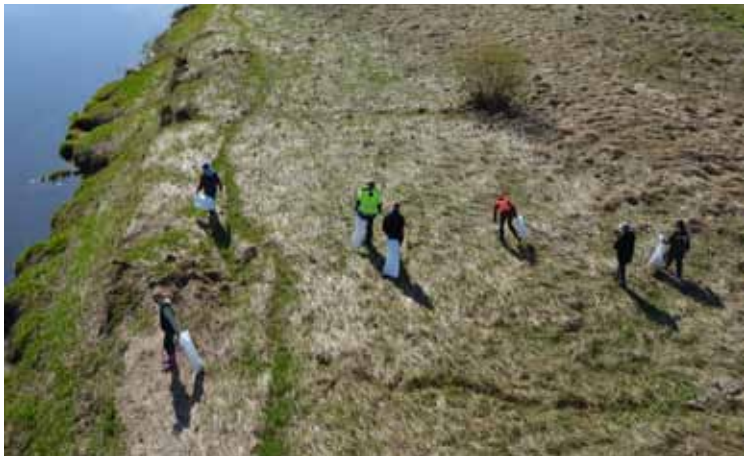
Sadales tīkla darbinieki sadalīti četrās grupās, katra nogājusi aptuveni 2 km gar upes krastu no dzelzceļa tilta, no Cieceres ietekas, no Vijandru un Viļņu mājām uz Skrundas tiltu.

Fotoaparāti, velosipēdi, krūzītes un daudz tukšu pudeļu – tās ir vien dažas lietas, ko Lielajā talkā Ventas krastā atrada gan a/s Sadales tīkls darbinieki, gan Nīkrāces iedzīvotāji.