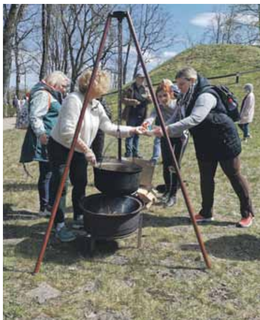
Šoreiz apmeklētāji varēja nogaršot ne vien tradicionālo zivju zupu, bet arī pie mums atbraukušo ukraiņu vārīto boršču.