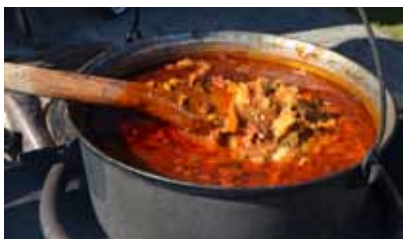
Pēc labi padarīta darba neizpalika gards cienasts. Uz ugunsкура vārtajā soļankā bija gan cūkgaļa, gan medijuma gaļa.