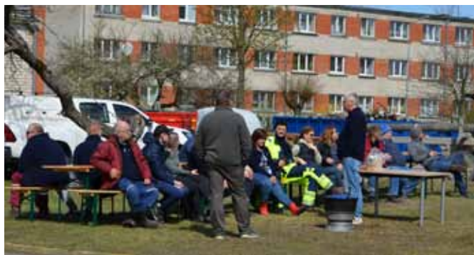
Talkā piedalījās aptuveni 30 elektriķi no Skrundas, Liepājas, Ventspils, Kuldīgas, Rīgas un Jelgavas.