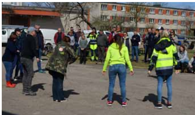
Katrai grupai pēc talkas bija divas iespējas: atskaitīties par atradumiem vai rādīt priekšnesumu.