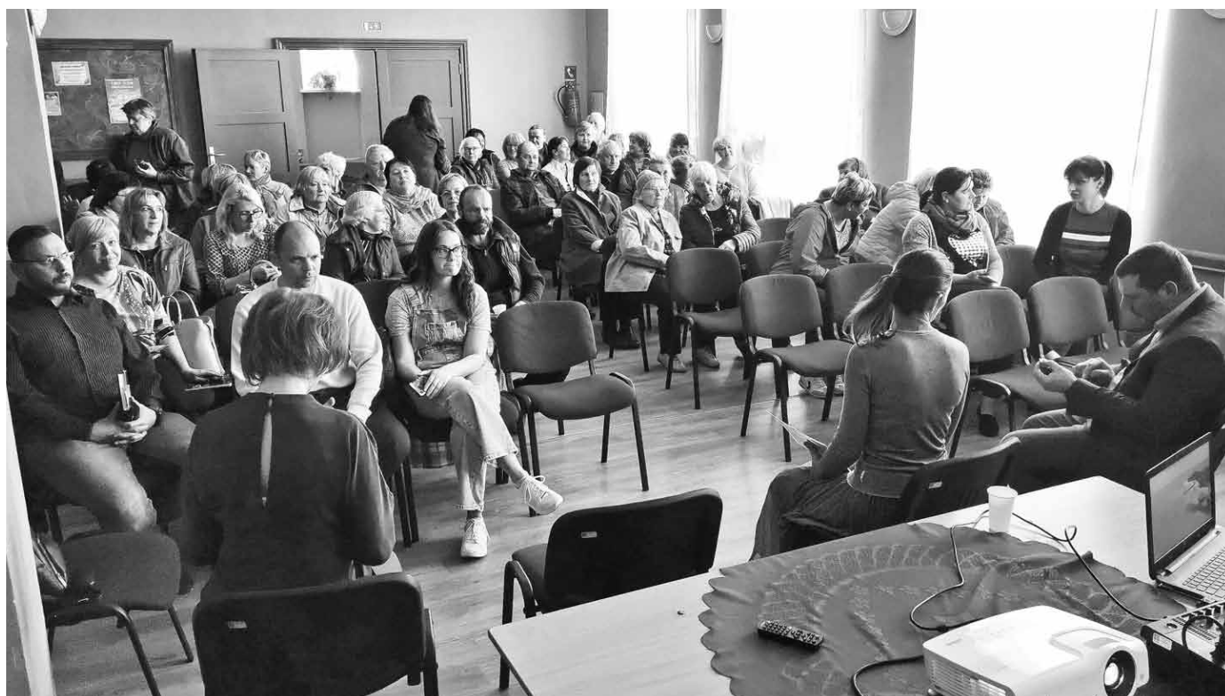
Nīkrācē uz sapulci sanāca kupls iedzīvotāju skaits – tukša palika vien niecīga daļa krēslu. Diskusijas bija par plašu tēmu loku: no ēku uzturēšanas līdz atkritumu šķirošanai.