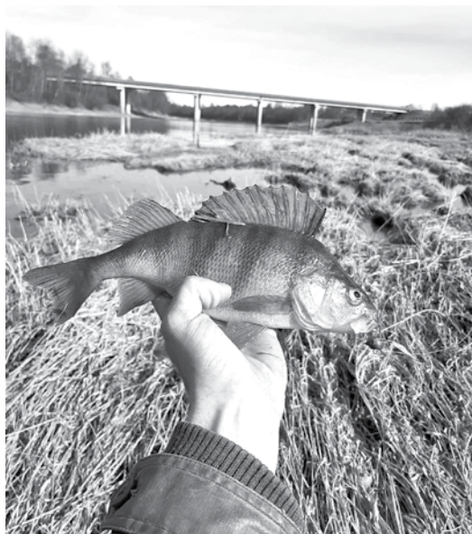
Desmit gadus Roberts dzīvo Kuldīgas pusē un par savu likteņupi sauc Ventu. Tur makšķerējot diezgan bieži. Fotogrāfija – asaris.