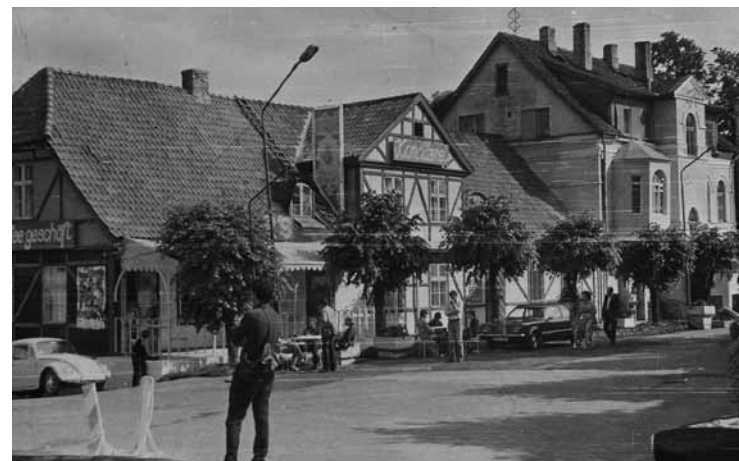
Kuldīgas vecais rātsnams filmā iejūtas Berlīnes ādā.