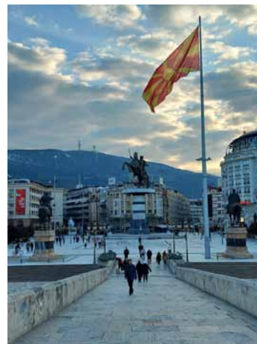
Skats uz Skopjes centrālo laukumu ar Maķedonijas Aleksandra grandiozo pieminekli, blakus plīvo valsts karogs.

tūrību un daudziem pieminekļiem. Visgrandiozākais ir Maķedonijas Aleksandrs centrālajā laukumā vecpilsētā pie Senā tirgus. Skopje lepojas ar faktu, ka tajā dzimusi Māte Terēze, 2009. gadā atklāta jaunuzcelta māja viņas piemiņai, kurā esot iedzīvotāju ir arī oficiālā valoda un liela ir albaņu kultūras ietekme dažādās jomās.