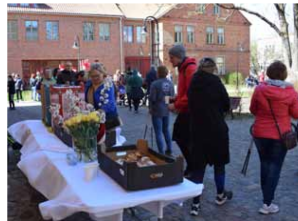
12.30 Liepājas ielā pie krustojuma ar Dzirnau ielu piecu kilometru gājienā vai skrējienā par godu Latvijai devās gan lieli, gan mazi. Finišs bija mūzikas skolas sētā (attēlā), kur pilsētas piknikā dalībniekiem uzklāts galds ar uzkodām un dzērieniem. Sētā krāšņi plīvoja vairāki Latvijas un Kuldīgas karogi.