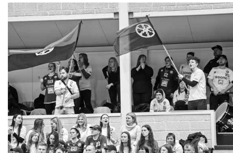
Florbolistus atbalsta līdzjutēji.