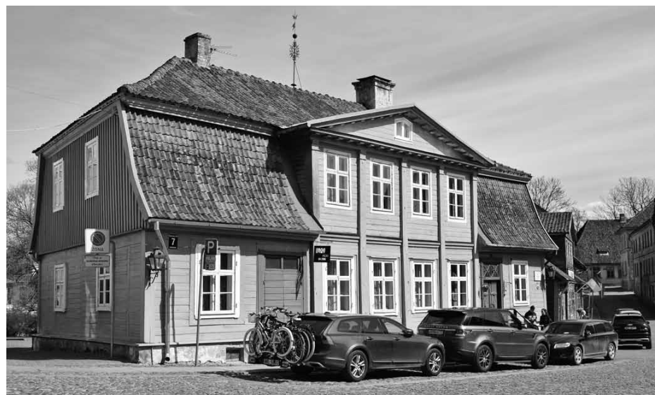
Koka nams Baznīcas ielā 7 ar senatnīgo izskatu piesaista gan tūristu, gan vietējo skatus.