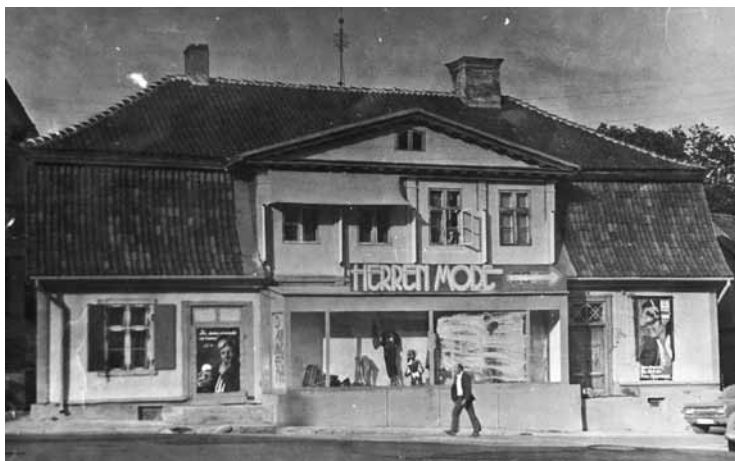
Filmas Krasts uzņemšanas laikā 1983. gadā.