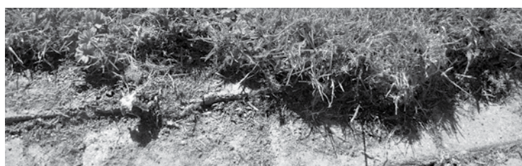
Celiņi no nezālēm attīrīti, taču tas nav izdarīts rūpīgi, turklāt no malām izgrieztā zāle atstāta turpat.

Celiņu malās nogrieztā zāle ar visu zemi samesta turpat zālienā. „Vieta tik skaista, celiņi sataisīti, cilvēki strādājuši, nauda ieguldīta, bet tagad nevienam vairs nepieder? Kā tagad varēs nopļaut zālienu?”