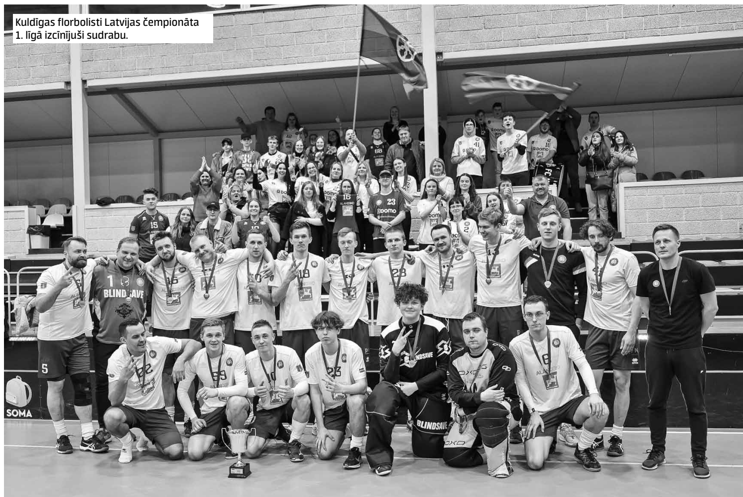
Kuldīgas florbolisti Latvijas čempionāta 1. līgā izcīnījuši sudrabu.

I.S.: Mēs jau arī šajā trenējāmies kā virslīgas komanda. Nedēļā četri treniņi; ja iekrīt, tad vēl divas vai viena spēle nedēļas nogalē. Tika izveidots pareizs fiziskās sagatavotības process: bedre bija līdz regulārā čempionāta beigām,