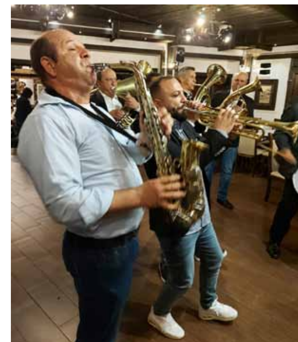
Vakara pārsteigums – atraktīvs romu pūtēju un bungu ansamblis, kas spēlē gan tradicionālo mūziku, gan pasauleslavenus gabalus. Mūzika tāda, ka kājas cilājas pašas.