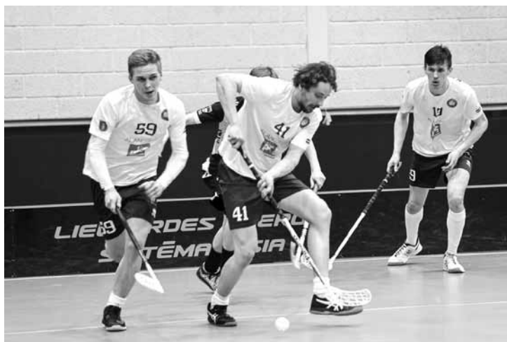
Kuldīdznieki spēles brīdī.

un labākā forma parādījās izslēgšanas spēlēs. Tāpēc tur nospēlējām tik labi – aspēlējām līderus, piemēram, Madonu un Valku.