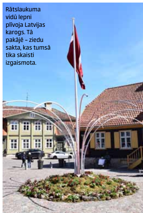
Rātslaukuma vidū lepni plīvoja Latvijas karogs. Tā pakājē – ziedu sakta, kas tumsā tika skaisti izgaismota.