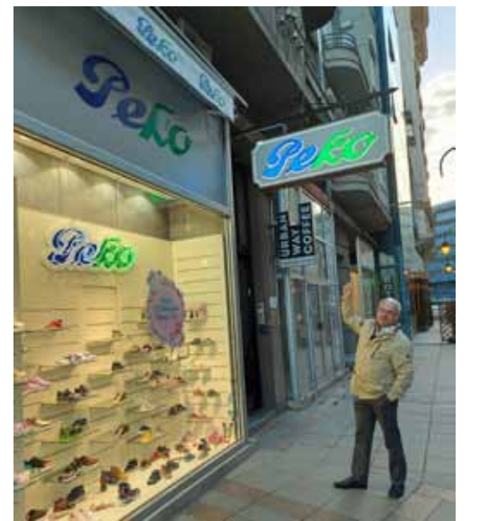
Setu dalībnieks Ārne Leima no Igaunijas Maķedonijā pozē pie kurpju veikala Peko – tāpat sauc leģendāro setu karali, kurš atdusoties Pečoru klosterī.