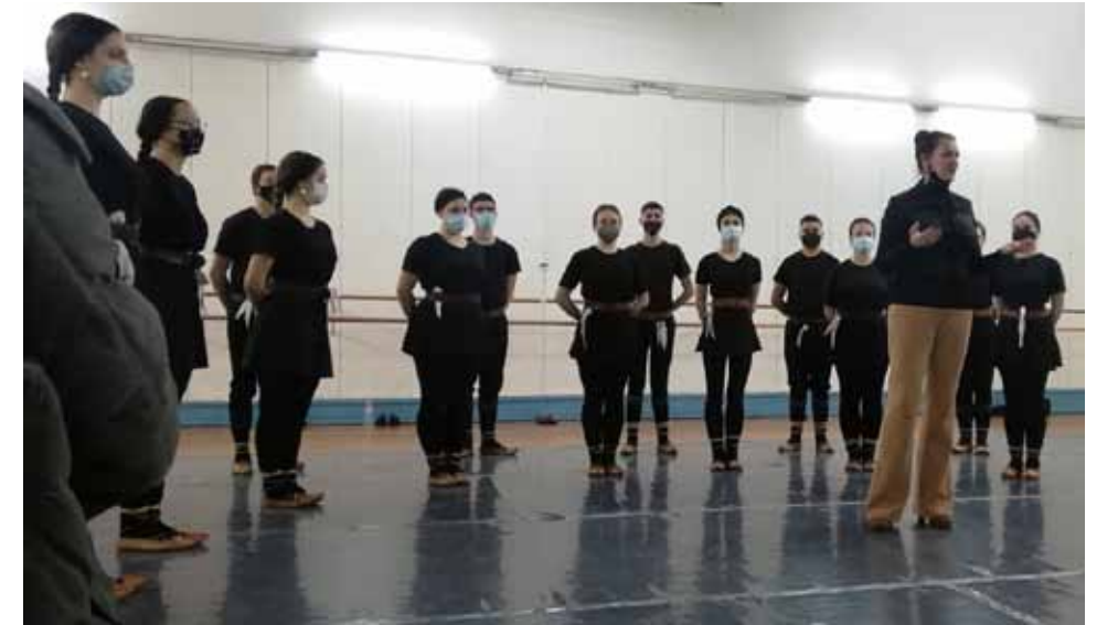
Mūzikas un baleta vidusskolā tiekamies ar tradicionālās mūzikas klases audzēkņiem un pedagogiem, mums par godu – mācību paraugstunda.