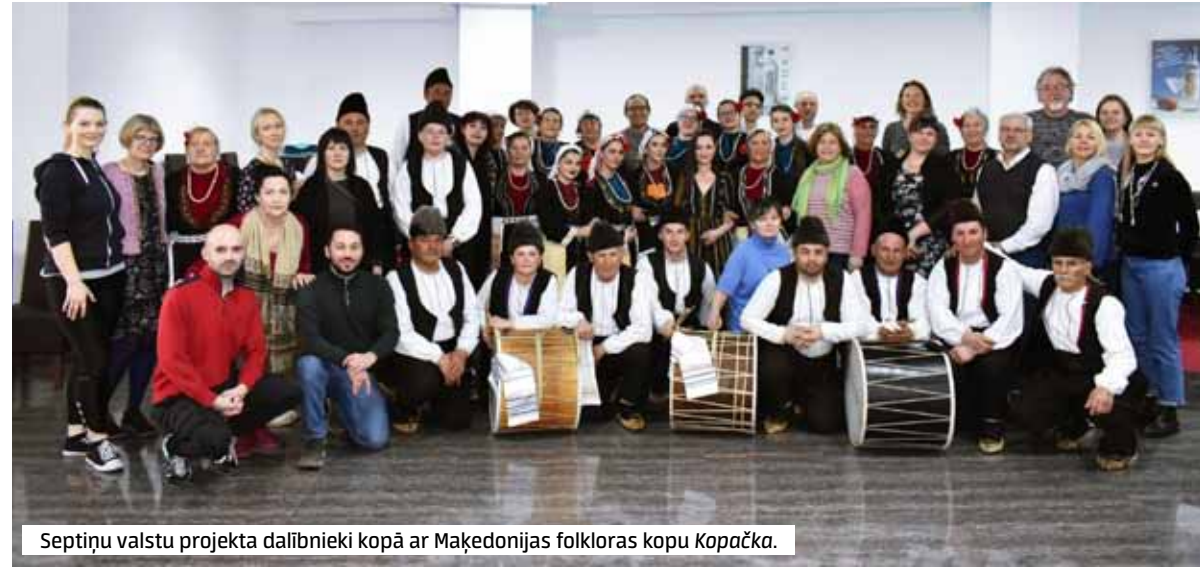
Septiņu valstu projekta dalībnieki kopā ar Maķedonijas folkloras kopu Kopačka .

Piemiešanas vērtā ir dzimumu līdzsības attīstība šajā deļā – vēsturiski tā bijusi vīriešu deļa, taču 20. gs. otrajā pusē arī sievietes sākušas to deļot, un uz UNESCO sarakstu pieteikums jau aizgājis bez vārda vīru sākotnējā nosaukumā Kopačka – vīru deļa . Taču tradīcija tiek ievērota – vīri un sievas deļo katrs savā pusapļā. Interesanti, ka šai deļai bungu pavadījumu tradicionāli vienmēr izpildījuši tieši romu muzikanti, bet tikai pēdējos gados sadarbība pajukusi. Viņi gan uzsver, kas tas bijis galvenokārt finansiālu iemeslu dēļ, jo pandēmijas laikā uzstāšanās tikpat kā nav bijis (šeit tradīcija tāda, ka skatītāji muzikantiem aiz cepures vai bungām aizsprauz papīra naudas zīmes). Tāpat bungas sākušas mācīties folkloras kopas dalībnieki, kuri lepojās, ka arī tie sākušas iemācīties meitenes, ne tikai puīši. Pēc stāstījuma un prezentācijas arī mūs aicina kopīgā apļā deļā. (Turpmāk vēl.)