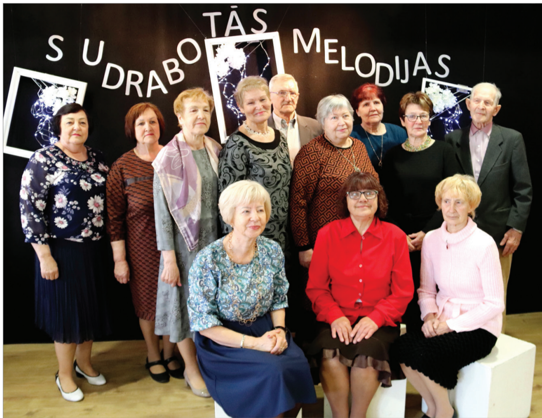
Tārgalnieki ieradās kuplā skaitā. Viņu vidū ir daudz aktīvu cilvēku.

Pēc divu gadu pārtraukuma Puzes pagasta kultūras namā notika tradicionālais pasākums "Sudrabotās melodijas", pulcējot seniorus ne tikai no Ventspils novada, bet arī viesus no Talsu novada Spāres, Stendes, Laidzes, Vandzenes, Dundažas, no Tukuma novada Kandavas un Kuldīgas.