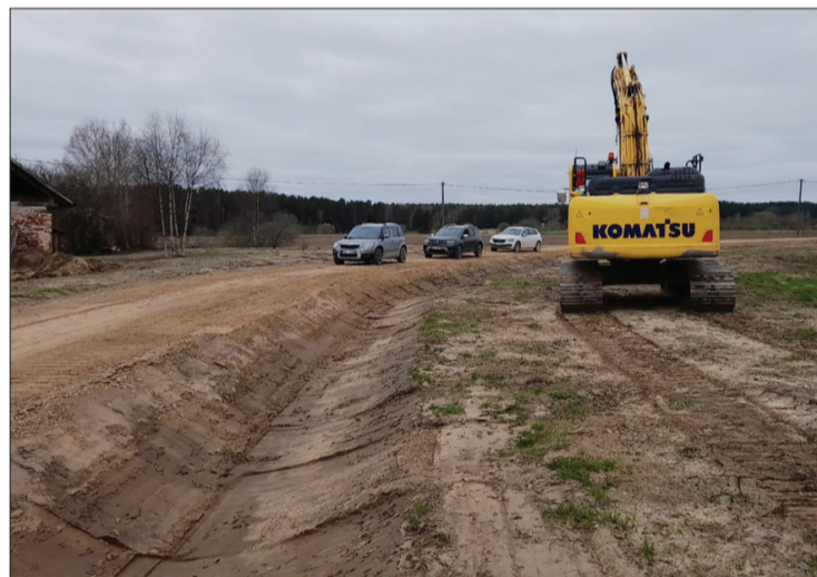
Uz autoceļa "Vilniši" notiek brauktuves seguma pārbūve.

Zlūku pagastā notiek pašvaldības autoceļa ZI-29 "Vilniši" brauktuves seguma pārbūve no 0,00 līdz 0,70 km. Pēc darbu pabeigšanas ceļš būs klāts ar grants segumu.