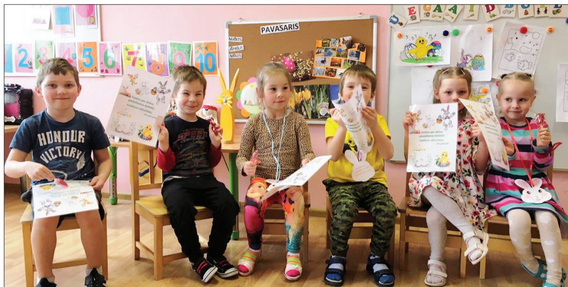
Bērni par aktīvo rosību saņēma apbalvojumus.

1. aprīlī grupā bija dažāda jokošanās. Brokastis tika pasniegtas šašlikpankūkas un piens bija ieliets burciņās. Pusdienas ar neparastiem piederumiem bija jāēd dažādās vietās, bet launags bija kā pikniks.