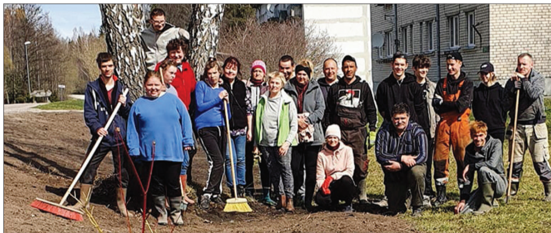
Čaklie talkotāji atjaunoja košumkrūmu stādījumus.