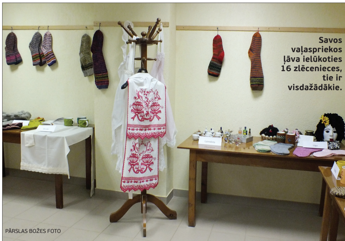
Savos vaļaspriekos ļāva ielūkoties 16 zlēcnieces, tie ir visdažādākie.