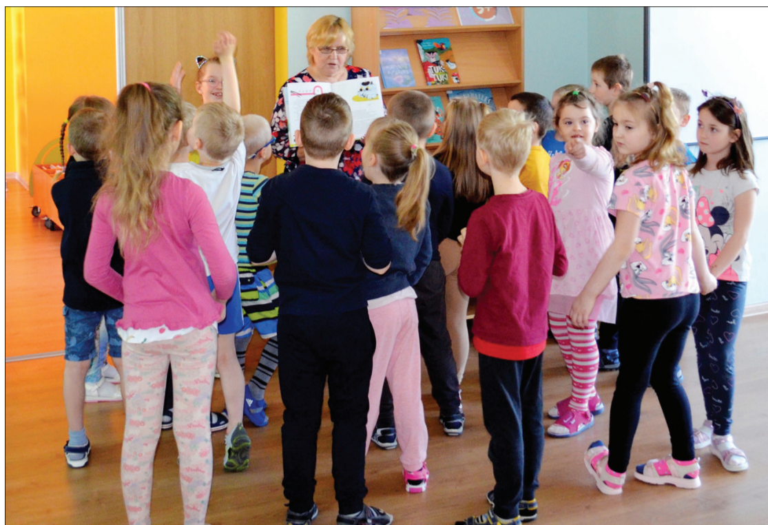
Jaunie uģālnieki iepazīst pagasta bibliotēkas piedāvājumu.