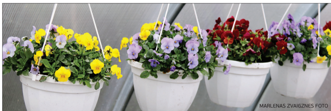
MARLENAS ZVAIGZNES FOTO

Uzņēmuma piedāvājumā aprīlī bija sīkziedu, lielziedu un nokarenās atraitnītes.