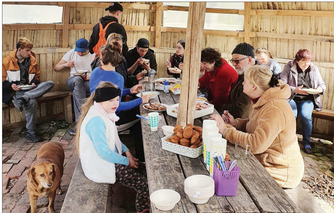
Pēc kopīgi paveikta darba varēja nobaudīt gardu soļanku.