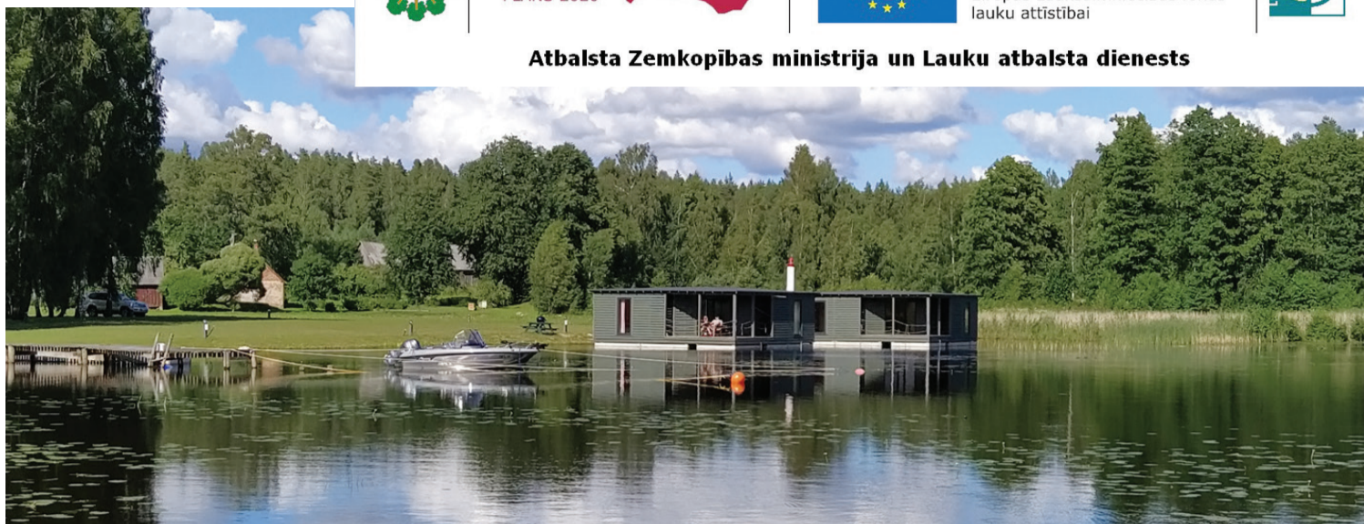
Peldošie namiņi Usmas ezerā.