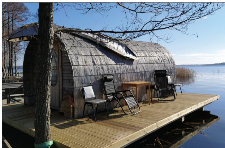
Peldošais ports uz pontona Elku ragā.