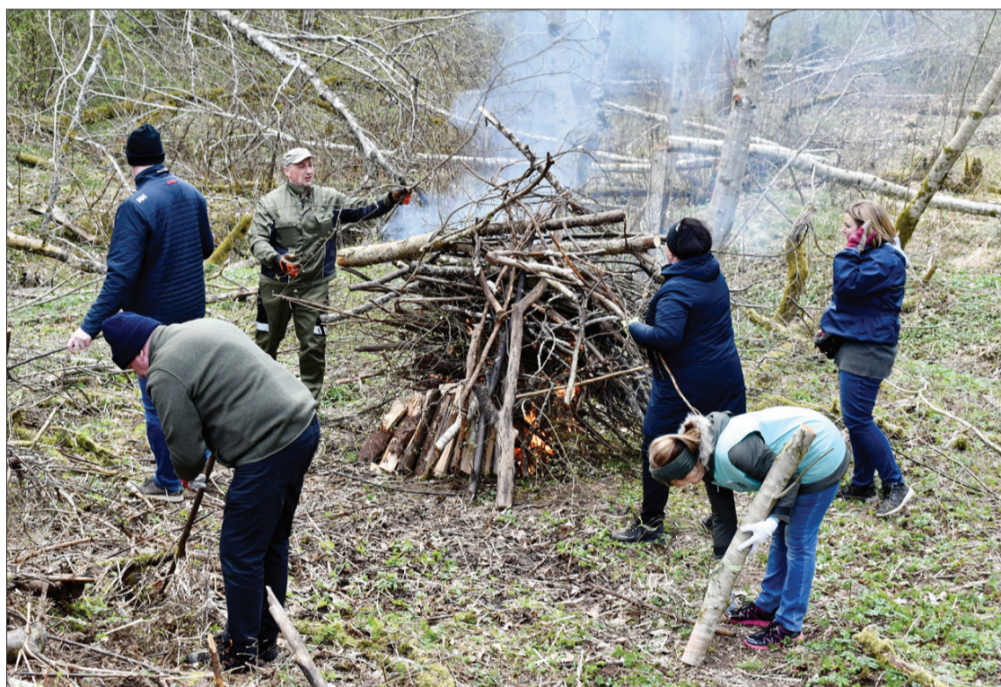
Visi cītīgi strādā, lai sakoptu pilskaļņa un dabas takas teritoriju.