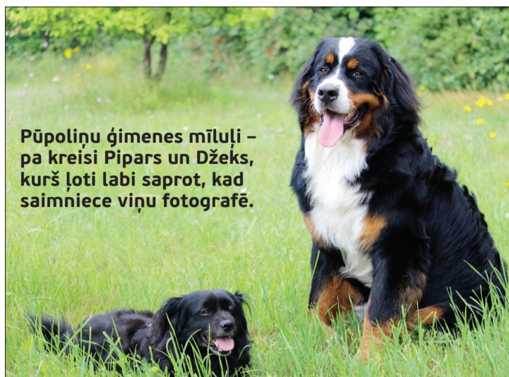
Pūpoliņu ģimenes mīluļi – pa kreisi Pipars un Džeks, kurš ļoti labi saprot, kad saimniece viņu fotografē.