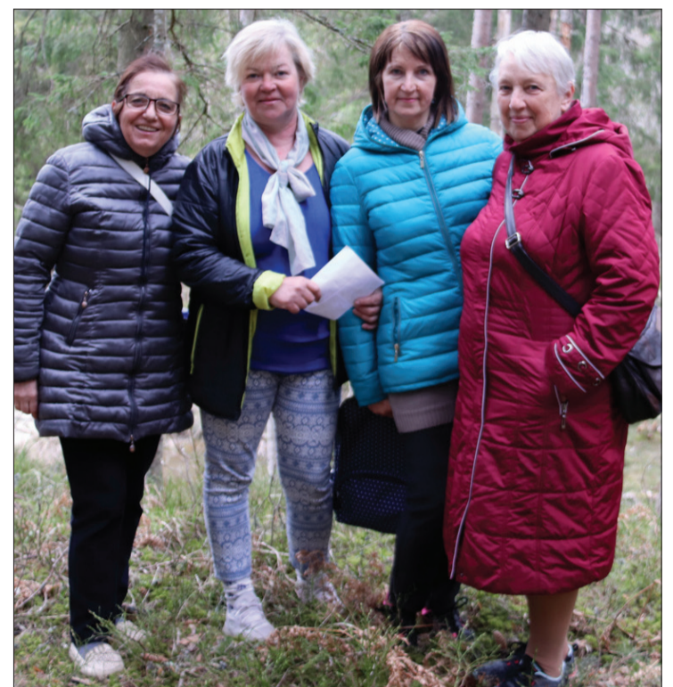
Vārvē pagasta dāmu klubiņa "Kalīzija" pārstāves neslēpa prieku par kopā būšanu un atrašanos dabā.

ūdēns. Reiz kādu dienu viņš, sadusmojies par kārtējo aizpūsto māju, izlēma uzcelt salu un dzīvot uz tās. Viņa prātā tas bija neiespējami, ka arī tur viņš izgāzīsies, jo nevar taču būt, ka viņam pilnīgi nekas neiznāks. Kaut kam taču beidzot ir jāizdodas! Un tā viņš uzcēla salu un dzīvoja tur visu savu dzīvi. Vēl līdz šai dienai nav pārliecināts, kā viņam tas izdevās, bet nu ir Moricsala. Estere Māra Bērzkalne