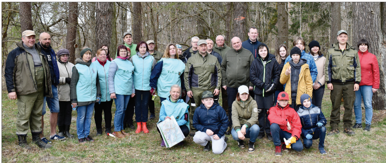
Atvērto meža dienu dalībnieki, kuru vidū bija gan pieaugušie, gan bērni.

Atvērto meža dienu dalībnieki Ugālē sadalījās trīs grupās. Pirmā