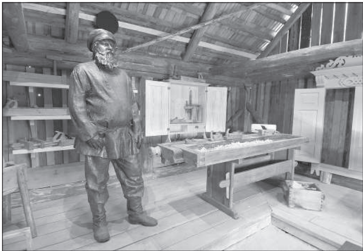
Плотницкая мастерская Исаяи.

В пятницу, 13 мая, в Науенской волости Аугшдаугавского края в деревне Слутишки в рамках проекта «Ценности завтрашней Европы» при поддержке Европейского фонда регионального развития открылась отреставрированная старообрядческая усадьба «Urāņi», в которой представлены три экспозиции Науенского краеведческого музея – «Молитвенная комната», «Ремесло плотника в Латгалии в 1-й половине 20 века» и «Животноводство в Латгалии в 1-й половине 20-го века».