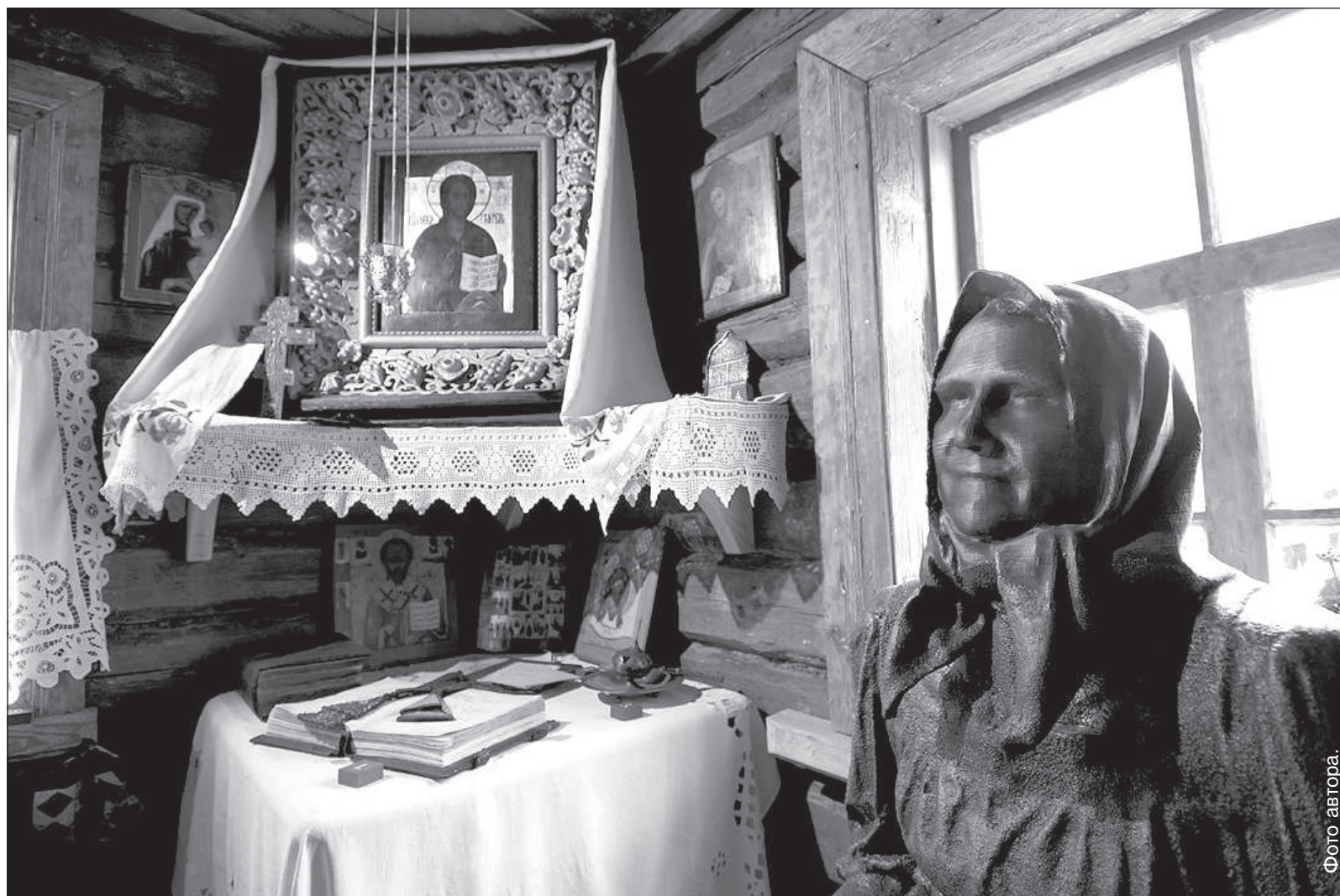
«Красный угол» Феодосии.