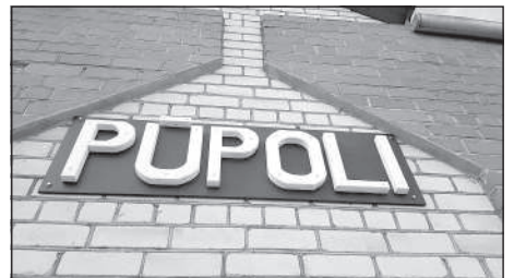
Надпись на железнодорожной станции.

Предположительно, народные песни этой группы являются не только образа-