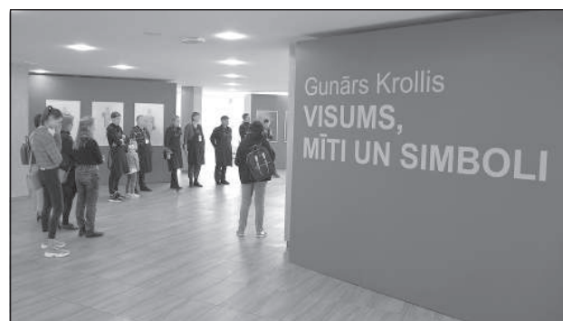
Симпозиум начался с открытия выставки работ Гунара Кроллеса.

графики, открытия, увиденные и прочувствованные, основанные на различных религиях и культурах, – весь широкий и богатый круг тем, в рамках которых он мыслит и творит.