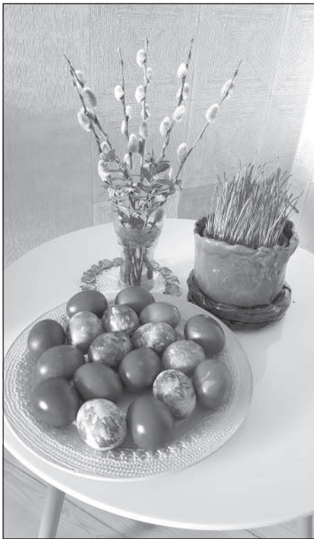
Соцветия вербы очень тесно связаны с Пасхой.

Поэт Ромонс Спайтанс, чей поэтический язык игриво резвый и лингвистически развитый, в одном из своих стихотворений от-