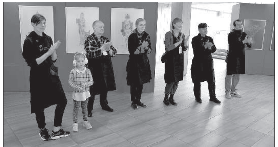
Участники овациями приняли новость об открытии симпозиума.