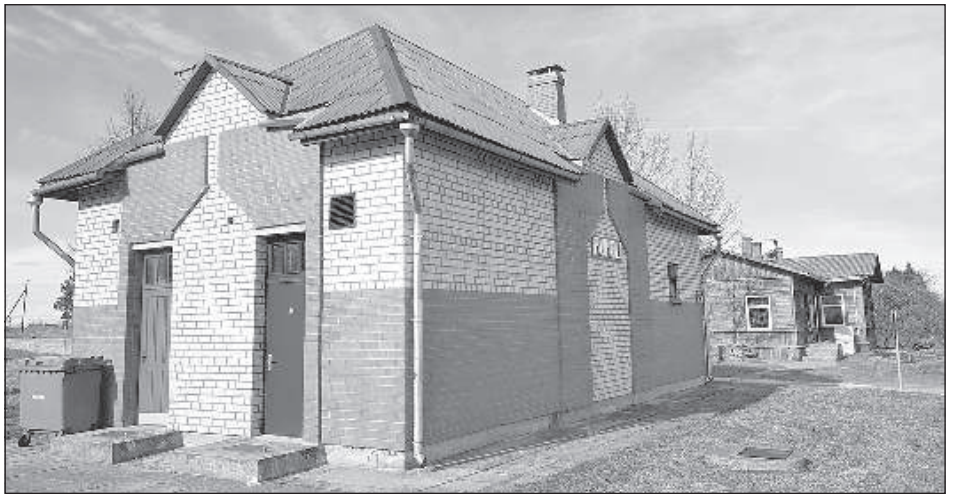
Железнодорожная станция «Rūpoli» (2019).