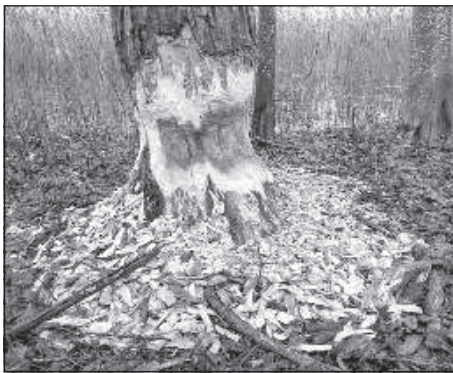
Объединенная бобрами ива у озера Солошниеки.

мечает серебристость ивы. «Pīkaļņē dreiši saulē vizēs / Veitūlcakuls sudrobbizēs.» 7