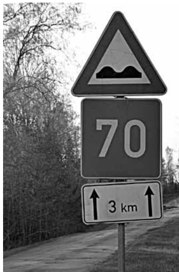
Par trim kilometriem no Aizputes šosejas līdz Vilgālei būtu pārāk maigi teikt: „Nelīdzens ceļš.” Ar ieteicamo ātrumu līdz 70 km/h tur brauc tikai pārgalvīgi. Runāts jau gadiem, bet prioritāro valsts ceļu remonta programmā tas nav iekļauts.

Lai arī Covid-19 noteica dažādus ierobežojumus, kultūras dzīve nebija mirusi. Pateicoties kurmālnieku atsaucībai, no idejas par pagasta kalendāru izvērtusies plaša gadalaiku fotoizstāde. Gan jau arī kalendāru varēs izdot. Tāpat notikuši konkursi bērniem un