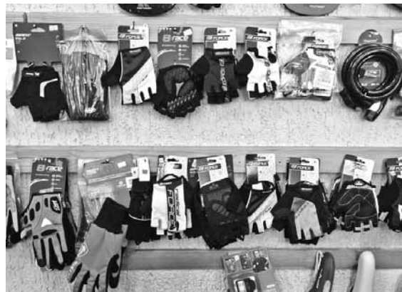
Braukājot pa skeitparku un pumpu trasi, noderēs speciāli velocimdi. No rokas lūzuma tie diemžēl nepasargās, bet no nobrāztām plaukstām gan.