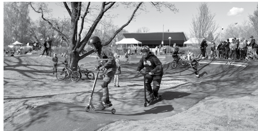
Kuldīgas bērni un jaunieši Estrādes parkā izmēģina jauno asfalta velotrasī.

Apvienoto Nāciju izglītības, zinātnes un kultūras organizācijas (UNESCO) Pasaules mantojuma komitejas sēdē, kas tika plānota jūnijā, bija paredzēts lemt par pasaules mantojuma sarakstā