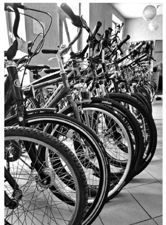
Cena kāpusi ne vien pārtikai vai degvielai, bet arī divriteņiem – vidēji par 50 eiro.

parūpējas par bērnu drošību. Kuldīgā atkal atvērts skeitparks, atklāta arī jaunā pumpu