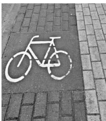
Piedaloties satiksmē, jāievēro pieklājība – tikai tā visi spēsim sadzīvot.

Divritenim vienmēr jābūt lieliskā tehniskā stāvoklī ar bremžu sistēmu un priekšējiem un aizmugurējiem lukturiem, lai velosipēds un tā īpašnieks būtu