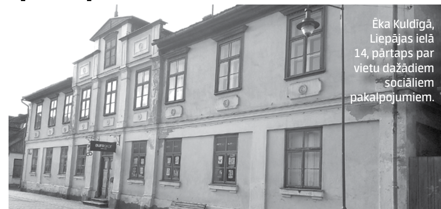
Ēka Kuldīgā, Liepājas ielā 14, pārtaps par vietu dažādiem sociāliem pakalpojumiem.

jumiem bez atbalsta aprūpē. Plānotas telpas skatuves mākslas pilnveidei, vingrošanai, mūzikas un mākslas terapijai. Sešas vietas paredzētas pieaugušajiem ar garīgiem traucējumiem, kuriem aprūpē ir atbalsts. Tur notiks ergoterapijas, fizioterapijas, digitālās attēlu apstrādes, rokdarbu un citas nodarbības. Būs virtuve un