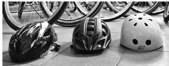
Daudzi vecāki bērniem neliek braukšanas laikā uzlikt ķiveri. Vai pārsista galva būs labāka?