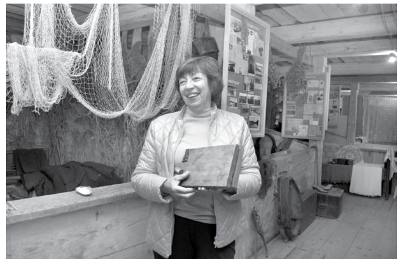
Lailas Liepiņas teksts un foto

Atbildē – mūsu sīktais strauji un mērķtiecīgi aizver kad mūsas salīdusās, grāmatai piemēram, medu, ievāriņim un uzsmērē kaut ko garšīgu. Atvērtā veidā uz dēļiem.