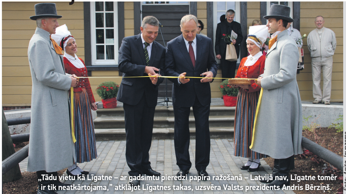
„Tādu vietu kā Līgatne – ar gadsimtu pieredzi papīra ražošanā – Latvijā nav, Līgatne tomēr ir tik neatkarojama,” atklājot Līgatnes takas, uzsvēra Valsts prezidents Andris Bērziņš.