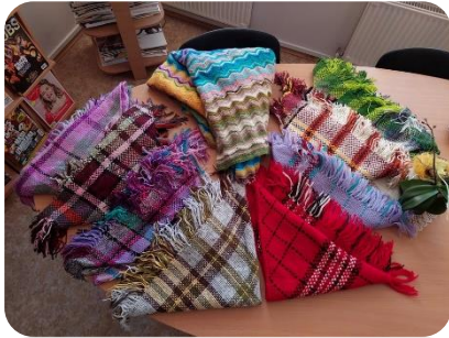
Mārītes Birzītes austu lakatu izstāde Šķibes bibliotēkā