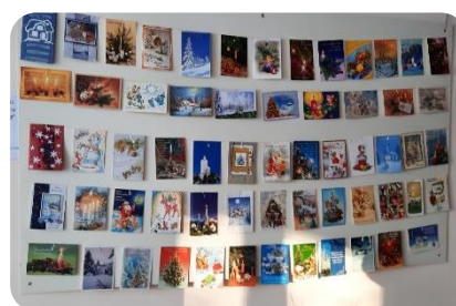
Apsveikuma kartīšu izstāde Bukaišu bibliotēkā