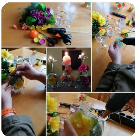
Zebrenes bibliotēkas video meistarklase “Svečtura gatavošana”