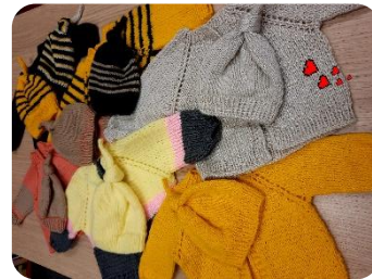
3 gadus Jaunbērzes bibliotēkas lietotāji piedalās projektā "Sirds siltuma darbnīca"