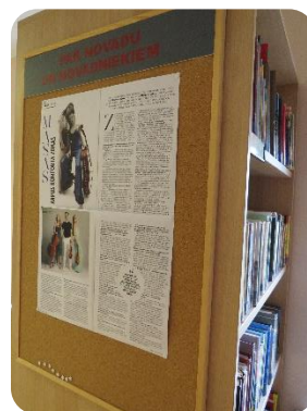
Novadpētniecības ziņojumu dēlis – aktuālās informācijas izvietojšanai par novadu un novadniekiem