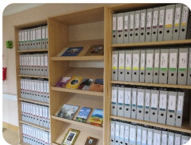
Dobeles NCB novadpētniecības tematiskās mapes