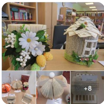
Konkursa "Grāmatas brīnumainās pārvērtības" dalībnieku darbu izstāde