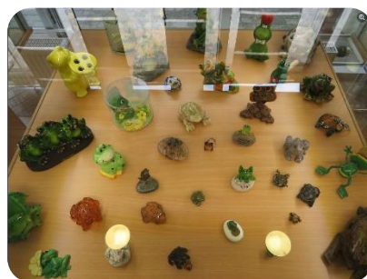
Novadnieces Liesmas Sāvičas vārdiņu kolekcija