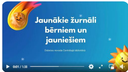
Virtuālā izstāde sociālajos tīklos Jaunākie žurnāli bērniem un jauniešiem