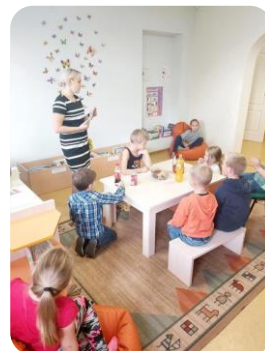
Bibliotēkā stunda ar Bēnes bibliotēkas bibliotekārēm