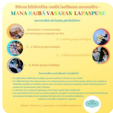
Lasīšanas sacensības Bēnes bibliotēkā