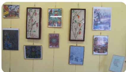
Bērzupes speciālās skolas audzēkņu darbu izstāde Lejasstrazdu bibliotēkā