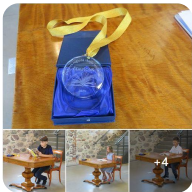
Nacionālās Skaļās lasīšanas sacensības DNCB (pusfināls)