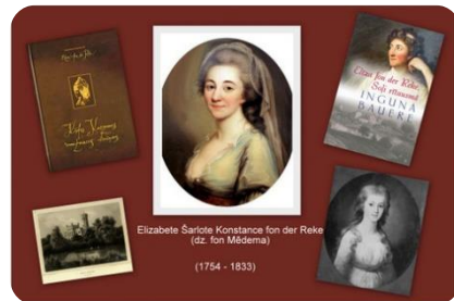
No Auces bibliotēkas virtuālā izstāžu cikla ‘‘Mīlestībā...’’ (ievērojami aucenieki)