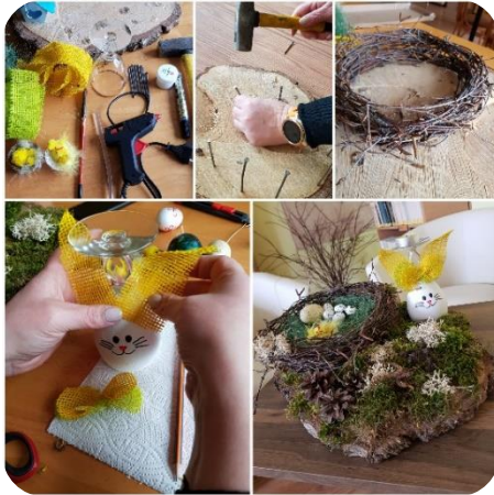
Zebrenes bibliotēkas video meistarklase “Lieldienu dekors”