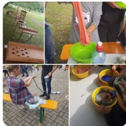
Zebrenes bibliotēkas rīkotā meistarklase (Zebrenes pagasta svētkos) “Slaima gatavošana”