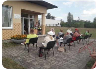
Uztura speciālista lekcija pie Šķibes bibliotēkas