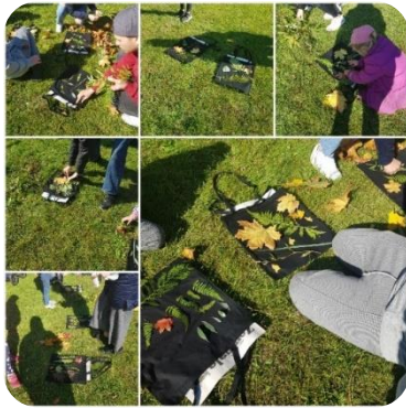
Zebrenes bibliotēkas rīkotā meistarklase “Dabas glezna uz auduma maisiņa”