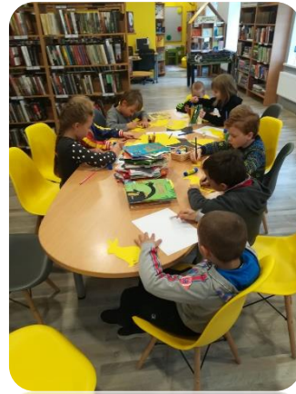
Bibliotekārā stunda Penkules bibliotēkā