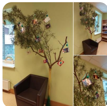
Akcija "Izrotā savus Ziemassvētkus" (ikviens varēja sūtīt fotogrāfijas ar svētku noformējumu)