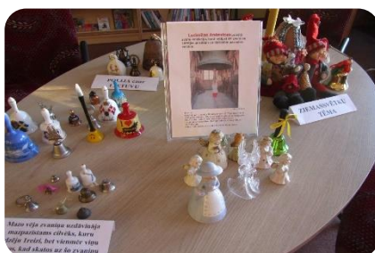
Ludmilas Anševicas zvanīņu kolekcija Lejastrazdu bibliotēkā