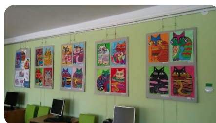
Bērzupes speciālās internātskolas audzēkņu izstāde Annenieku bibliotēkā