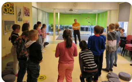
Tikšanās ar rakstnieci Lauru Vinogradovu