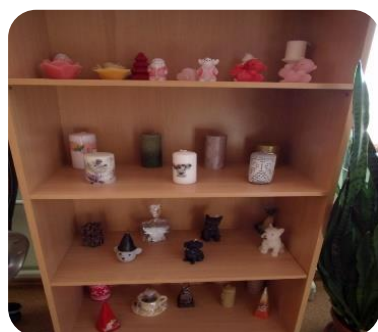
Ivetas Mītrevičicas svecīšu kolekcija Tērvetes bibliotēkā