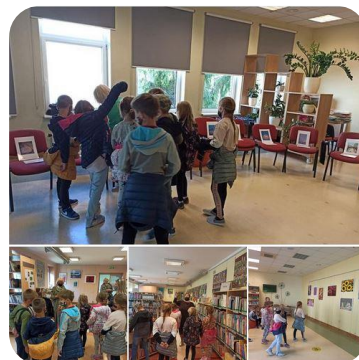
Bibliotēkārā stunda Tukuma novada bērniem