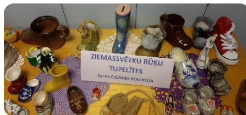
Bibliotēkas vadītājas Gītas Čīgānes tupelīšu kolekcijas izstāde Bites bibliotēkā