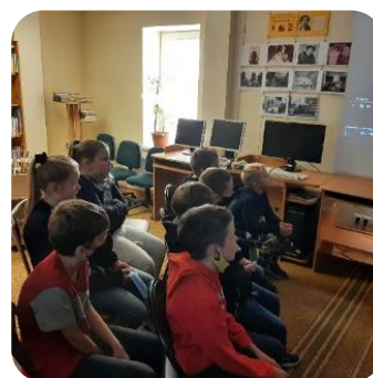
Bibliotekārā stunda bērniem Bites bibliotēkā