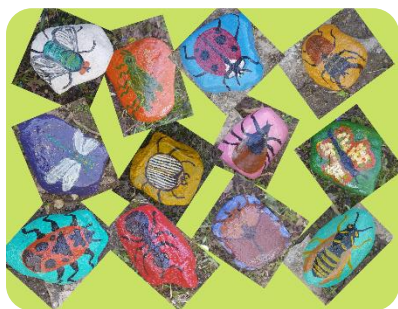
Radošās darbnīcas “Dārza rota” darbiņi Bikstu bibliotēkā