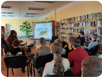
Valsts augu aizsardzības dienesta ceļojošās izstādes "Skaistie un bīstamie augu kaitnieki" atklāšana Jaunbērzes bibliotēkā