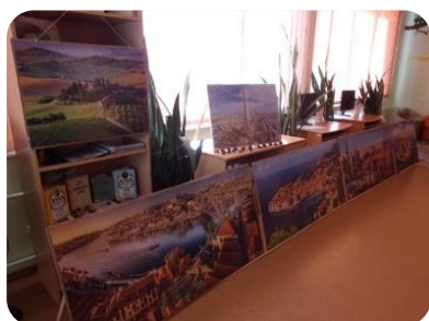
Anda Rauša gleznu "Brīnumainā puzles pasaule" izstāde Tērvetes bibliotēkā