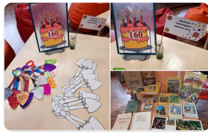
Akcija ‘‘Sprīdīša lāpsta’’ Bērnu lit. nodaļā Auces bibliotēkā