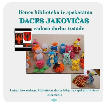
Daces Jakovičas radošo darbu izstāde bibliotēkā