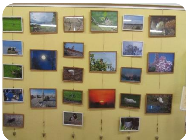
Foto izstāde “Ar putniem...” Lejasstrazdu bibliotēkā Fotogrāfiju autore Sandra Kazimiraite- Eglīte