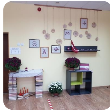
Latvju zīmju izstāde Zebrenes bibliotēkā