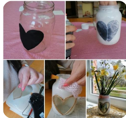
Zebrenes bibliotēkas video meistarklase “Vāzes gatavošana”