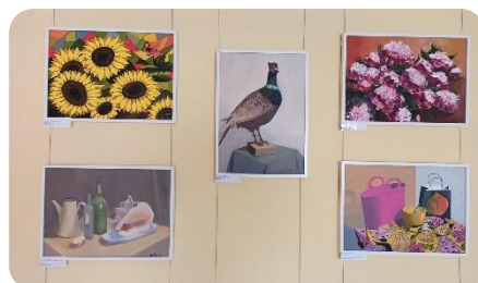
Novadnieces Ivetas Skrastiņas gleznu izstāde "SievietEs & uzdrīkstēšanās"