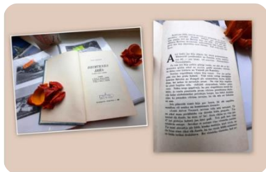
Slaidis no Auces bibliotēkas virtuālās izstādes ‘‘Auces vārds literatūrā’’