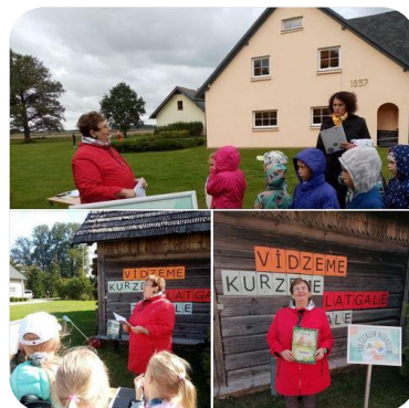
DNCB ar staciju pasākumā "Vari, dari pirmklasniek"