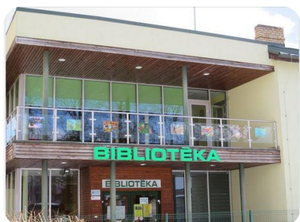
Dobeles novada bērnu vizuālās mākslas olimpiādes darbu izstāde