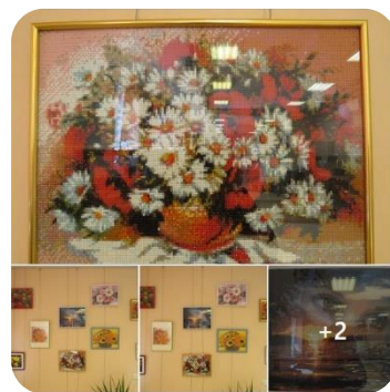
Novadnieces Maijas Strazdas rokdarbu izstāde