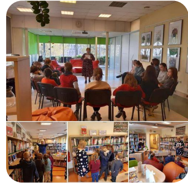
Bibliotekārā stunda Penkules pagasta bērniem