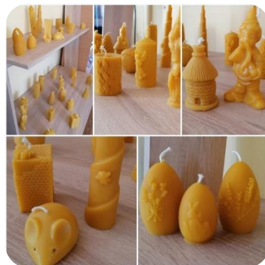
Vaska svecīšu izstāde Zebrenes bibliotēkā