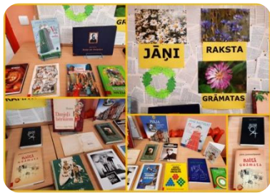
Izstāde ‘‘Jāņi raksta grāmatas’’ Bērnu lit. nodaļā Auces bibliotēkā