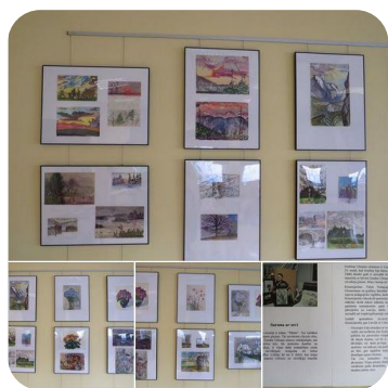
Novadnieces Gražinas Ulmanes akvareļu izstāde