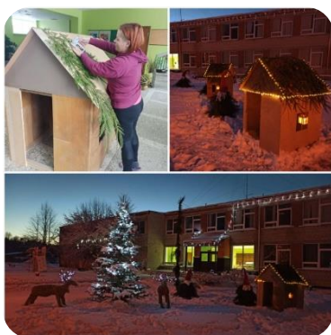
Zebrenes bibliotēka piedalās Zebrenes pagasta noformēšanā svētkos