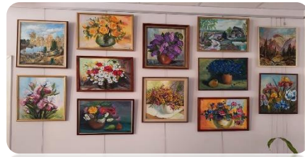
Mārītes Birzītes gleznu izstāde "Ziedu apskāvienos" Šķibes bibliotēkā