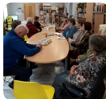
Penkules bibliotēkas rīkotā lekcija "Daiļdārzniecība un ainavu plānošana"