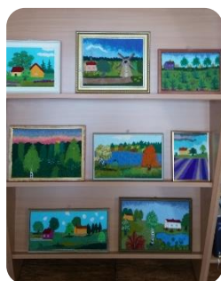
Ainas Liepas šūto glezniņu izstāde Annenieku bibliotēkā