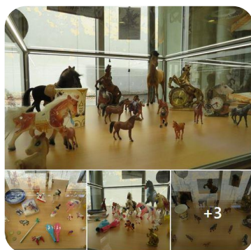
Novadnieces Zintas Grantes zirgu kolekcija