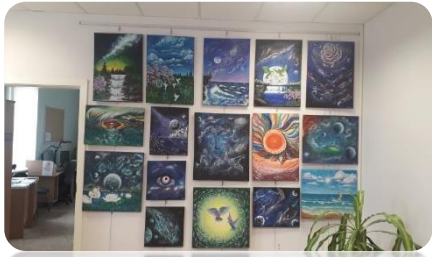
Līvas Laugales personālizstāde "Kosmiskais lidojums"