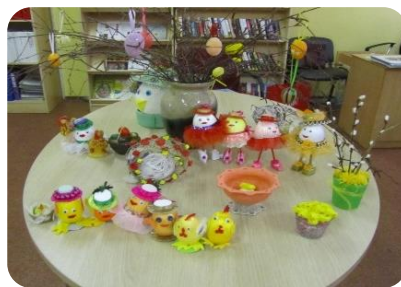
Radošo darbu izstāde ”Lieldienas klāt” (Lejasstrazdu bibliotēkā)