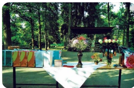
Almanaha atvēršanas svētki Annenieku estrādē