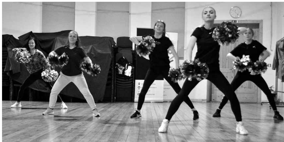
Kuldīgas karsējmeiteņu komanda Goldingen Cheerleading Team gatavojas gaidāmajam čempionātam.

Karsējmeitenes atbalsta arī vietējās sporta komandas. Savulaik volejbolā tā bijusi komanda Elvi , vēlāk sadarbība turpinājusies