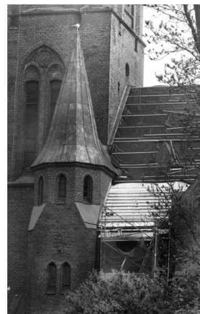
Kuldīgas Sv. Annas baznīcai arī jumts ir kritiskā stāvoklī, tur tiek mainītas lubiņas un dakstiņi.