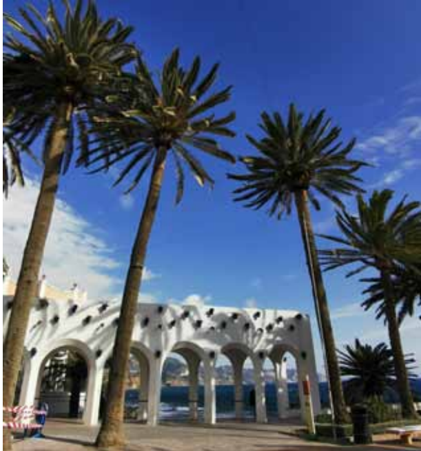
Spānijas pilsētas Nerjas simbols – Eiropas balkons.

Kad Latvijas ziemas drūmums bija pamatīgi nogurdinājis arī mani, februārī uzaicināju divas draudzenes attālināto darbu pārcelt uz Spānijas dienvidiem. Tā mēs trīs nedēļas strādājām un atpūtāmies Kosta del Solas piekrastē.