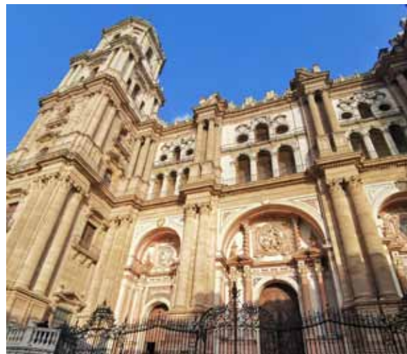
Malagas katedrāle ir milzīga, tāpēc pat atkāpjoties to grūti ietilpināt vienā foto.