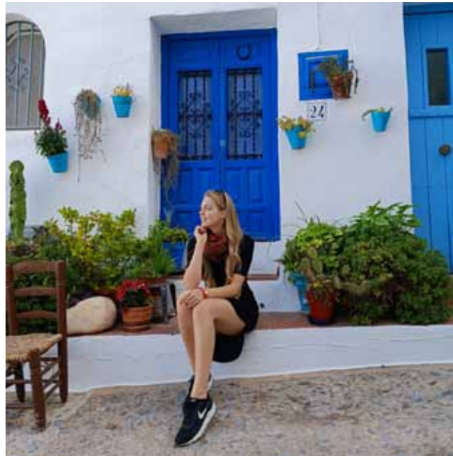
Baltos ciematiņus atsvaidzina koši logu rāmji un durvis.