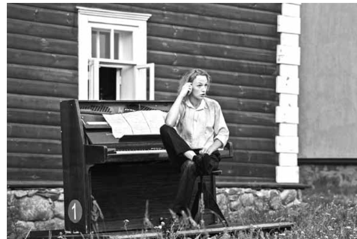
Rēzeknes teātra Joriks izrādi Mans kaimiņš ebrejs arī Ventspili varēs noskatīties pilsētā, proti, Rātslaukumā.