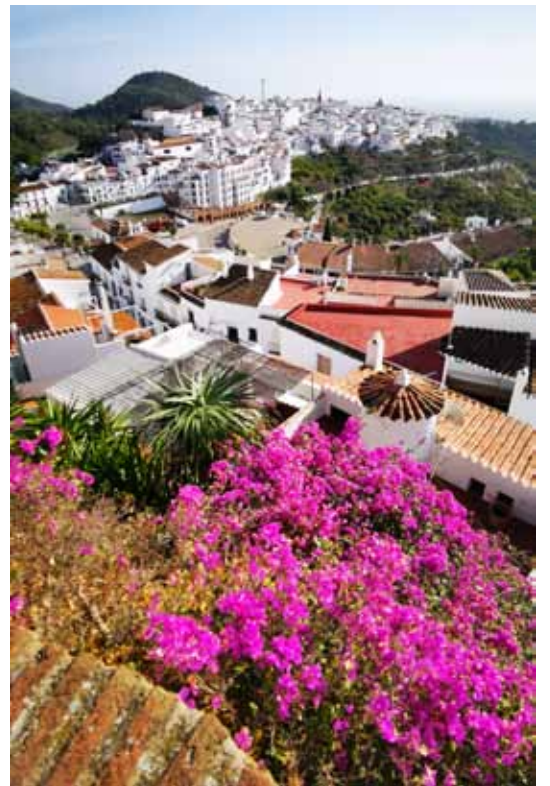
Baltie ciemati Andalūzijā ir ļoti izplatīti. Attēlā – Frigiliana.