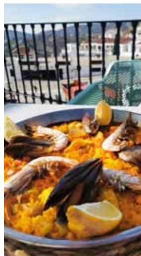
Spānijas iepazīšana noteikti jāpapildina ar gardajiem ēdieniem.