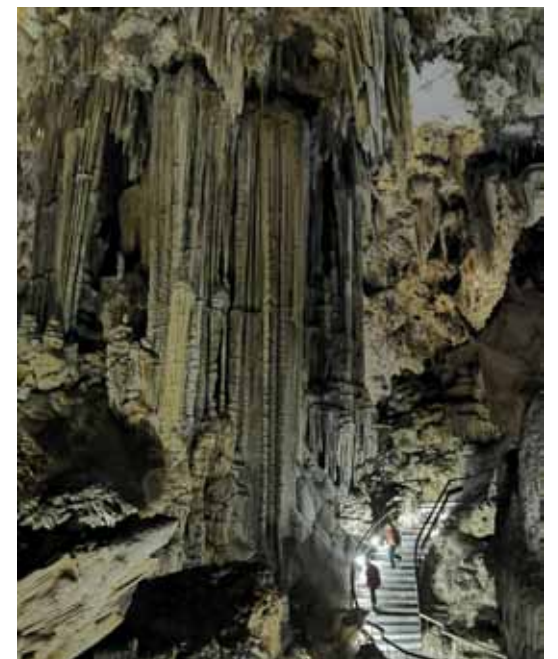
Pasaulē lielākais stalagmits atrodas Nerjas alās, un tā augstums ir 32 m.