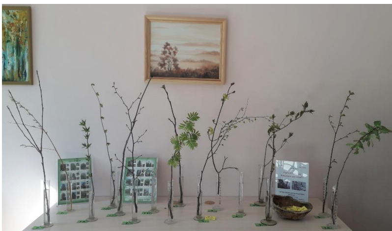
“Pazīsti Latvijas kokaugus pavasarī”

“Pazīsti Latvijas kokaugus pavasarī” – izpēti dotos koku zarus un pieliec klāt atbilstošos nosaukumus.