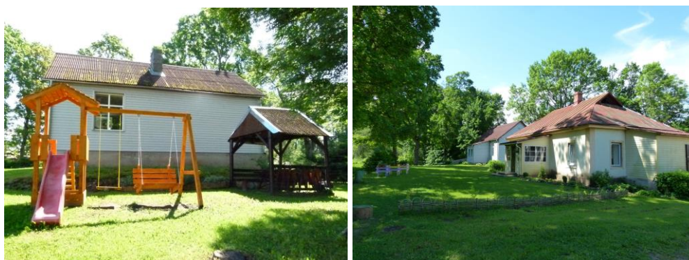
Projekts “Tiekamies pie šūpolēm”

Pateicoties “Viduslatgales pārnovadu fonds” konkursam “Iedzīvotāji veido savu vidi”, Ārdavā iniciatīvas grupa “Noktirne” kopā ar Ārdavas bibliotēku īstenoja projektu “ Tiekamies pie šūpolēm ”. Ārdavas ciema vēsturiskajā centrā tika atjaunota atpūtas un brīvā laika pavadīšanas vieta, uzstādītas jaunas šūpoles ar bērnu slidkalniņu, izveidots dzīvžogs, kas nodala ceļa daļu no pagalma, kur atrodas bibliotēka un Ārdavas Saietu nams. Pretī Ārdavas bibliotēkai izveidota velosipēdu stāvvietā. https://www.facebook.com/viduslatgalesparnovadufonds/posts/3883303955131875/