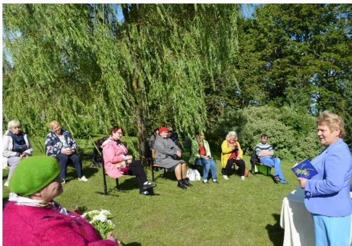
Aizkalnes bibliotēkas publikācija laikrakstā "Vietējā Latgales avīze 10.09.2021.

Pārskata periodā notika Aglonas bibliotēkas vadītājas tikšanās ar Rēzeknes augstskolas pasniedzējiem Valsts pētījumu programmas "Humanitāro zinātņu digitālie resursi: integrācija un attīstība (2020-2022)" projektā, kura dalībnieki iepazīnās ar latgaliešu valodas lietošanu Aglonā, bibliotēkā, ģimenē. Projekta dalībniekiem, t.sk. Lietuvas un Polijas augstskolu studentiem tika sniegtas un ierakstītas intervijas latgaliešu valodā.