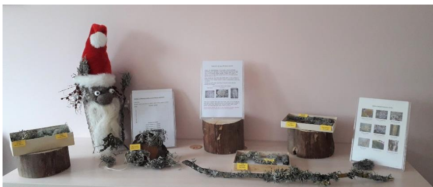
“Ķērpji Riebiņu parkā”

Riebiņu vidusskolas projekta "Atbalsts izglītojamo individuālo kompetenču attīstībai" ietvaros Riebiņu bibliotēkā bija skatāmas izstādes, kurās bērni un jaunieši varēja aktīvi līdzdarboties: “Ķērpji Riebiņu parkā” – paņemot gatavu darba lapu skolēni varēja pārbaudīt savas zināšanas dodoties uz Riebiņu parku, lai sameklētu kādi ķērpji tur aug, aplūkotu ķērpju daudzveidību.