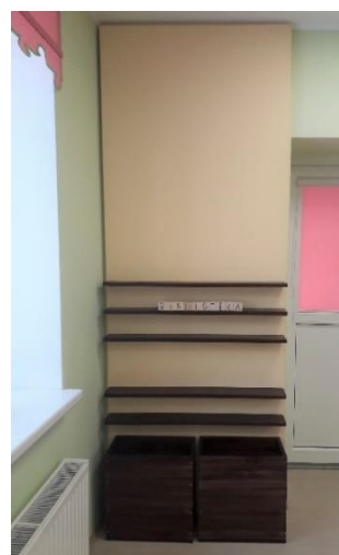
Riebiņu bibliotēkas pasaku istabas jaunie plaukti