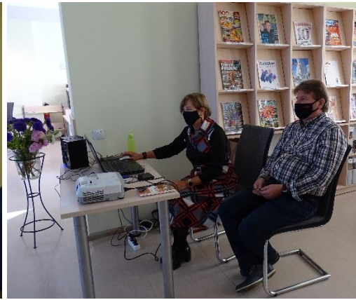
Ceļojumu pasākumi Riebiņu bibliotēkā par Gruziju un Madeiru