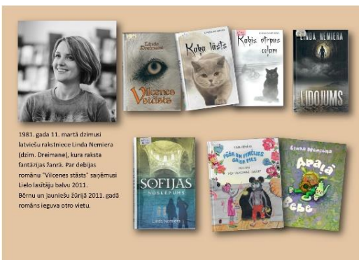
Riebiņu bibliotēkas rakstnieku jubileju digitālās izstādes

Tiešsaistes platformu iespējas ļāva bibliotēkām apvienoties kopīgos pasākumos: