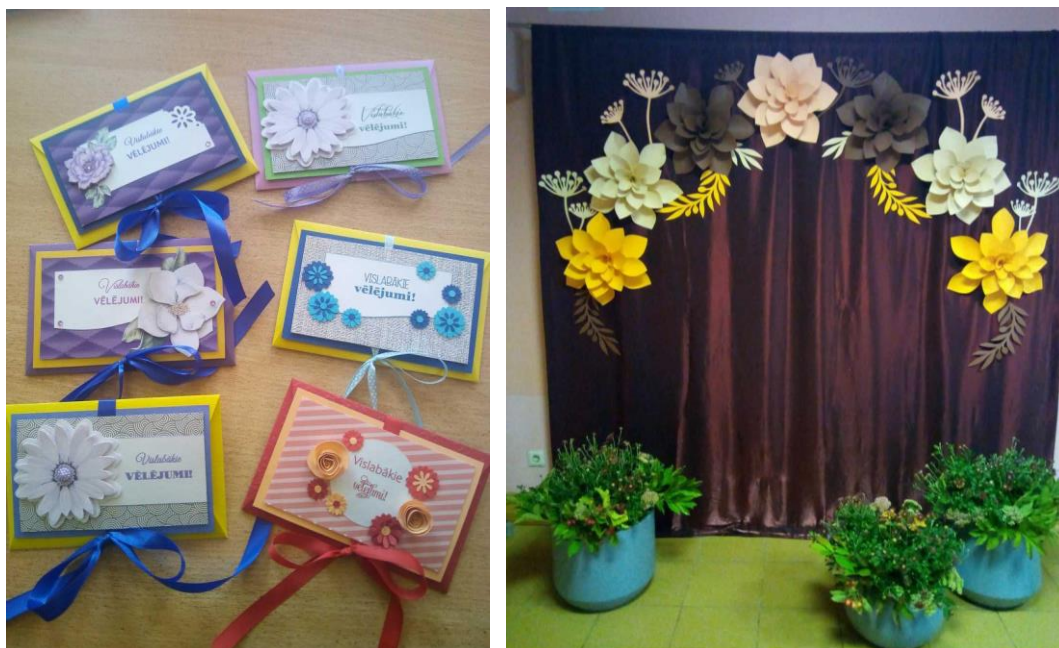
Rožkalnu bibliotēkas noformējums

Silajāņu bibliotēka pasākumus organizē sadarbībā ar Silajāņu Kultūras namu (Jaunais gads, Lieldienas, Līgo svētki u.c. svētki).