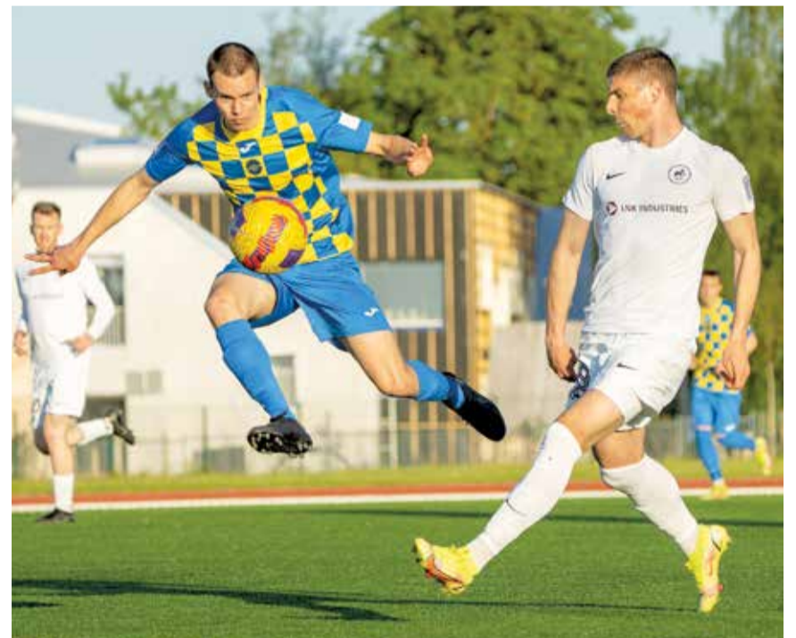
Optibet Virslīgas spēle Salaspilī 23. maijā.