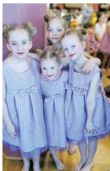
“Buru” mazie dejotāji.

Konkursa pārstāvju vidū vairākas “Buru” grupas – “Micro Buras A”, “Micro Buras B”, “Mini Buras”, “Burix” un “Nano Buras”. Un visas grupas