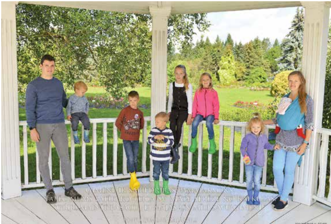
Pintu ģimene Nacionālajā botāniskajā dārzā.