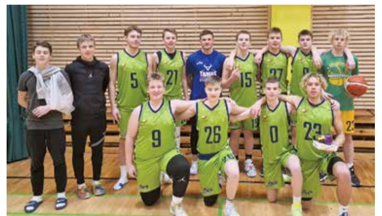
Salaspils sporta skolas U16 basketbolistu komanda.

Kopvērtējumā Salaspils sporta skolas basketbolisti 40 komandu konkurencē iekļuva Top 8 un ierindojās 7. vietā, noslēdzot Latvijas Jaunatnes basketbola čempionātu U16 grupā.