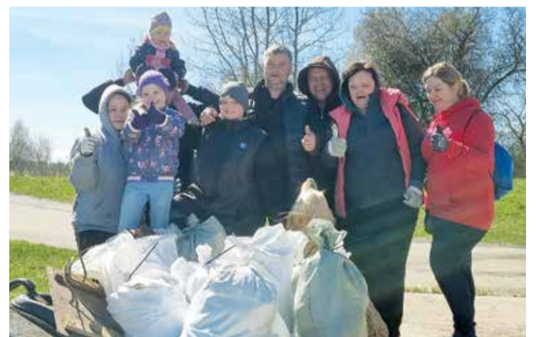
Talkotāji Doles salā.

Kopā strādājot, esam savākuši vairāk nekā 6 tonnas balto