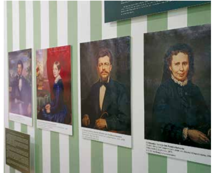
No izstādes "Salaspils muižas" ekspozīcijas.

Izstāde Daugavas muzejā apskatāma līdz 2022. gada 15. septembrim muzeja darba laikā.