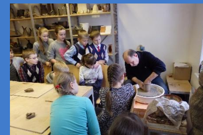
Materiālais un nemateriālais kultūras mantojums