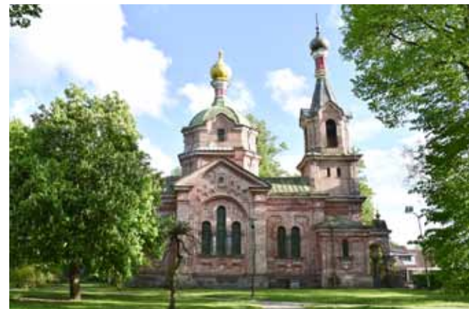
Krāšņo Kuldīgas pareizticīgo baznīcu ieskauj Semināra parka vasarīgais zaļums.