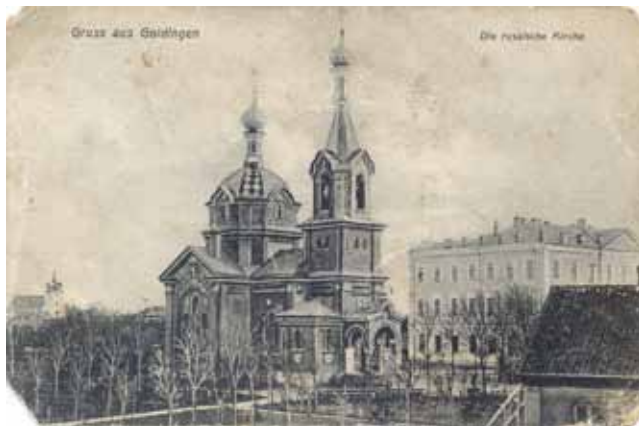
Senlaicīgajā pastkartē redzama Sv. Dievmātes Patvēruma pareizticīgo baznīca Kuldīgā 20. gs. sākumā. Blakus – Baltijas skolotāju seminārs.

Kā skaists un eksotisks zieds Kuldīgas Sv. Dievmātes Patvēruma pareizticīgo baznīca Semināra parkā rotā senatnīgās pilsētas centru. Cauri dažādiem laikiem sakrālā celtne ir saglabājusies, un draudze te joprojām satiekas dievkalpojumos.