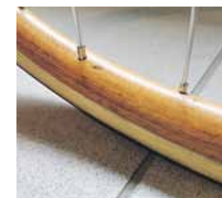
Velotreka ritenis. Leģenda vēsta, ka šo Valsts prezidents Kārlis Ulmanis 1938. gadā uzdāvinājis Vienības brauciena uzvarētājiem. Tās ir sacensības amatieriem, kas notika no 1936. līdz 1939. gadam un ir atjaunotas 1995. gadā. Tam ir koka felļas jeb rati.