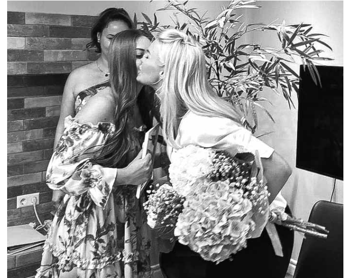
Diplomu pasniegšanā IColor akadēmijā Rīgā.

Viņa sevi raksturo kā mērķtiecīgu, apņēmīgu, izturīgu, bet arī nedaudz kautrīgu. Lielāko prieku sniedzot darbs, sports un laiks kopā ar ģimeni.