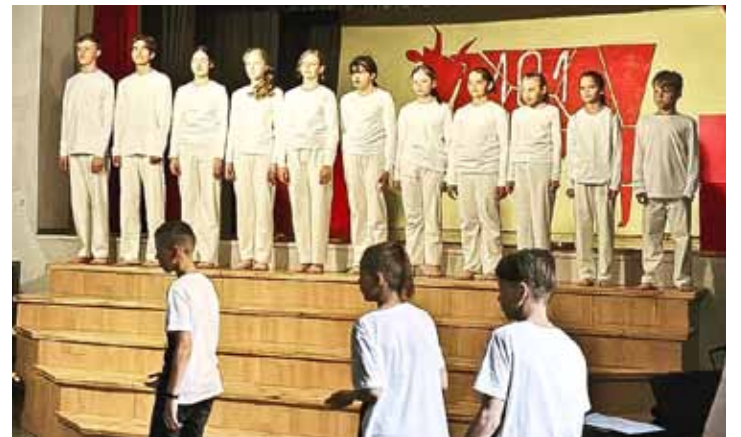
Laidu pamatskolas teātra kustību izrāde Laidu leģendas bija viena daļa no atmiņām bagātā pasākuma, kurā ikviens varēja no turpmāk slēgtās skolas atvadīties.

„Staiģāju pa visu ēku, un visur bija dzirdamas sarunas par skolas laiku,” saka E.Tisjaka. „Neatceros, kas bija tā kundze, kura stāstīja, ka viņas klasē meitene, sēžot pirmajā solā, iemācījusies lasīt grāmatu, kas uz skolotāja galda atvērta otrādi. Kontroldarbu laikā to lasījusi un pārējiem teikusi priekšā.”