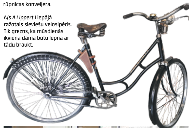
A/s A.Lippert Liepājā ražotais sieviešu velosipēds. Tik greznas, ka mūsdienās ikviena dāma būtu lepna ar tādu braukt.