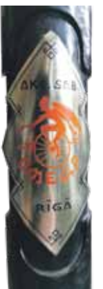
Pirmskara ražotāji centušies, lai katra detaļa padarītu braucamo krāšņāku, prestižāku. Te ir smalki atstarotāji, izdekorēti lukturi un citi papildinājumi. Pat ventiļa micīte piestiprināta ar smalku ķēdīti, lai nepazustu. Mūsdienu ražojumos neko tādu vairs neieraudzīt.