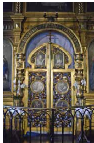
Cara vārti altārī dievkalpojumā tiek atvērti tikai noteiktu lūgšanu laikā, bet lielākajos baznīcas svētkos Lieldienās paliek vaļā visu nākamo nedēļu.