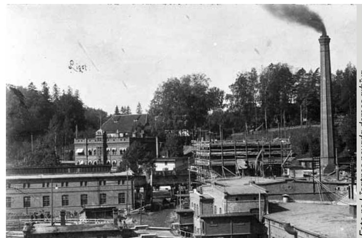
Līgatnes papīrfabrika 1911.gadā