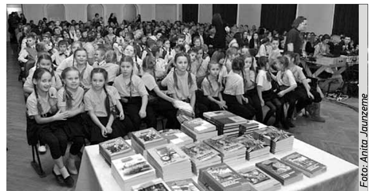
Ziemassvētku egles pasākumā galds ir pilns ar grāmatām, ko dāvināt Līgatnes novada vidusskolas labiniekiem.