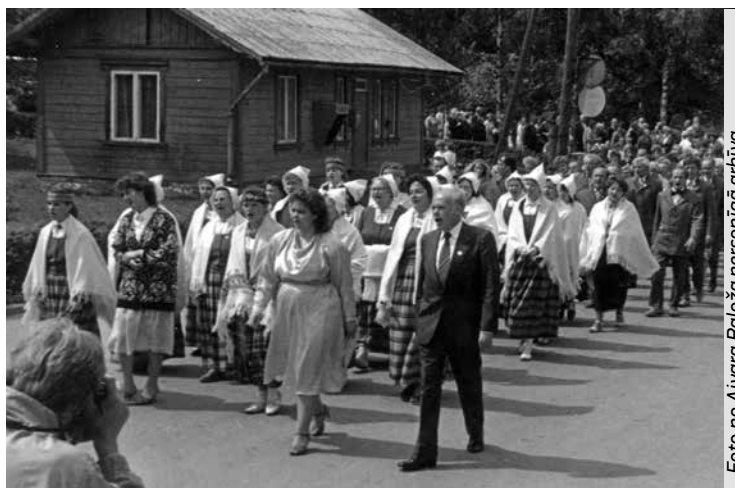
175 gadu jubilejas gājiens 16.06.1990.

3. Līgatnes pilsētas centrā jubilejas reizē uzstādīt dzimamkmeņus ar uzrakstu „CONRADSRUHE 1815 – LĪGATNE 1990”. Šajos dzimamkmeņos centrā pie Līgatnes TIC jeb bijušā Līgatnes papīrfabrikas sardzes namiņa 16.06.1990. gadā nerūsējoša tērauda kapsulā tika ievietoti materiāli ar veltījumu nākamajam paaudzēm par Līgatnes papīrfabrikas vēsturi.