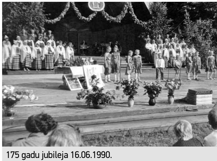
175 gadu jubileja 16.06.1990.

Nākamā zīmīgā diena, kas palikusi atmiņā, ir 1991. gada 20. janvāris, kad visi Latvijas iedzīvotāji satraukti vēroja televīzijā vai pie