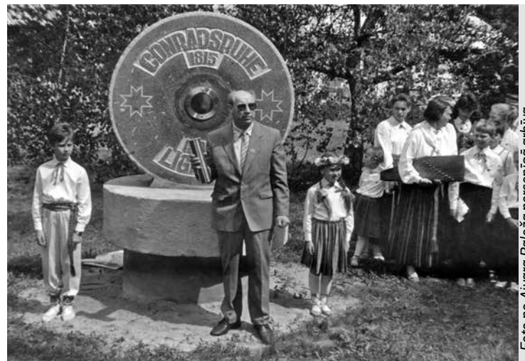
175 gadu jubileja 16.06.1990.