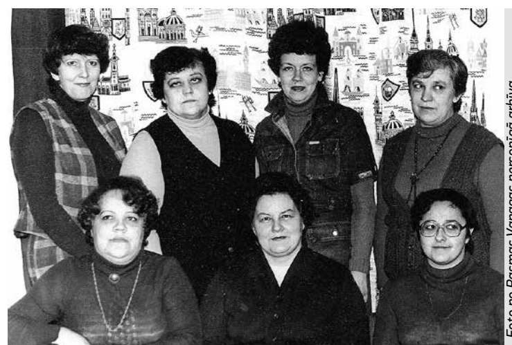
Papīrfabrikas plānu daļas darbinieces, 1986. gads.

90. gados plānu – ekonomiskās daļas darbinieku pienākums bija arī sagatavot visus materiālus papīra, izstrādājumu un pakalpojumu cenām, tās saskaņot ar pircējiem, ar augstākstāvošo organizāciju un panākt