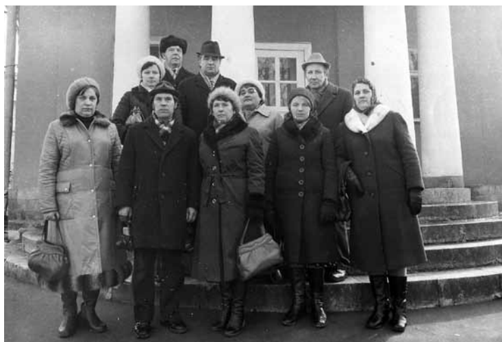
Līgatnes papīrfabrikas darbinieki ekskursijā Gorkos 1983. gada martā.