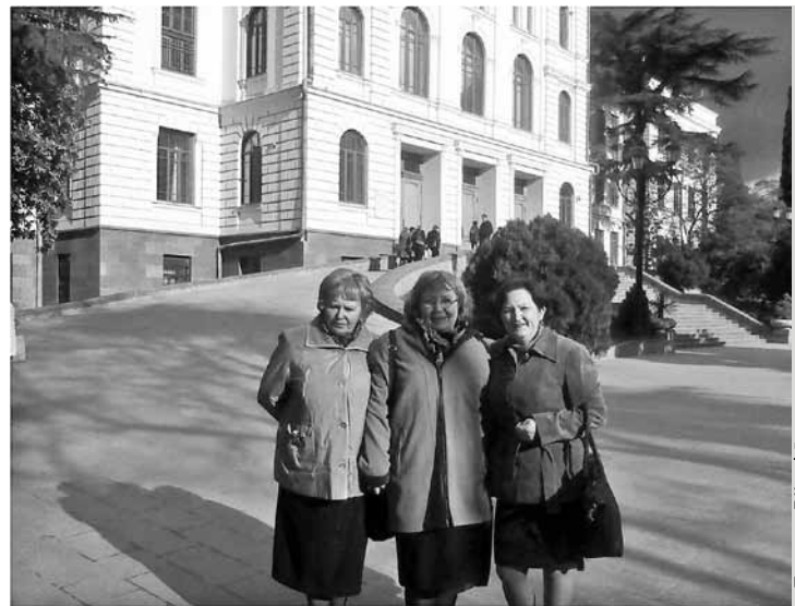
Līgatnes PII pedagoģes pie Tbilisi Universitātes ēkas.

Bērnu centrā ir arī trīs pirmsskolas grupiņas, kuras apmeklē bērni no 3 gadu vecuma. Materiālā bāze nav īpaši bagāta, bērni zīmē,