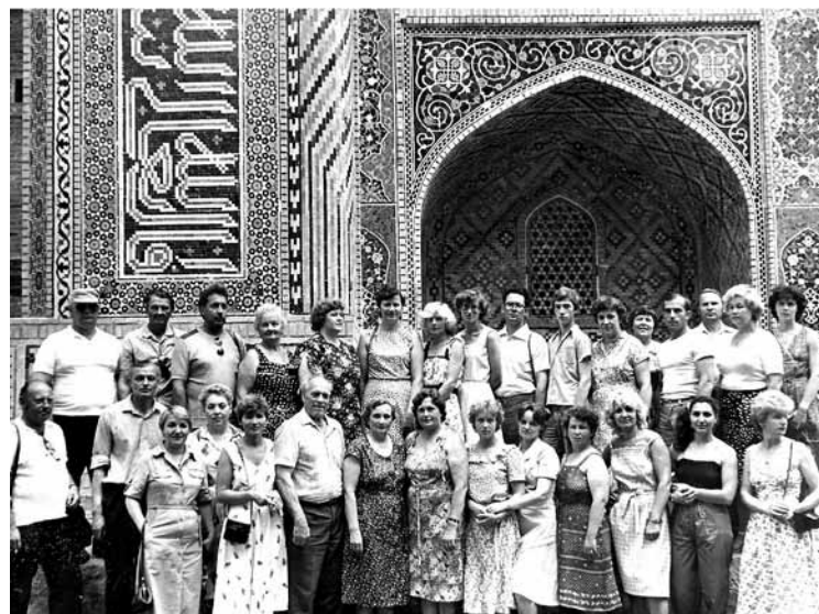
Līgatnieši kopā ar citiem papīraražotājiem Buhārā 1983.g.

ka” akcijām, kas ilga no 1997. gada 14. aprīļa līdz 25. aprīlim. „Akciju sabiedrības pamatkapitāls: Ls 222 550, vienas akcijas nominālvērtība: Ls 1,-.