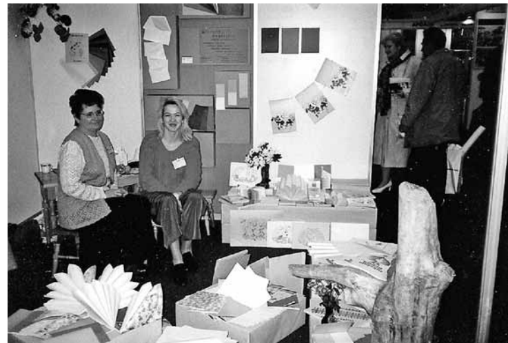
Papīrfabrikas izstādē Sporta manēžā 1996. gadā.