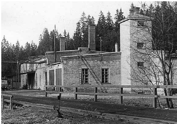
Līgatnes papīrfabrikas ugunsdzēsēju depo līdz 1994. gadam.

jot gāzes un elektrības parādus. Tos turpinām dzēst joprojām, maksājot pa 8000 līdz 9000 latu mēnesī. Bet visbriesmīgākais ir tas, ka, pakāpe-