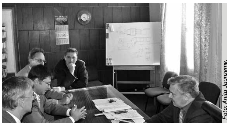
Fabrika, Jaunais laiks, 15.09.2006.