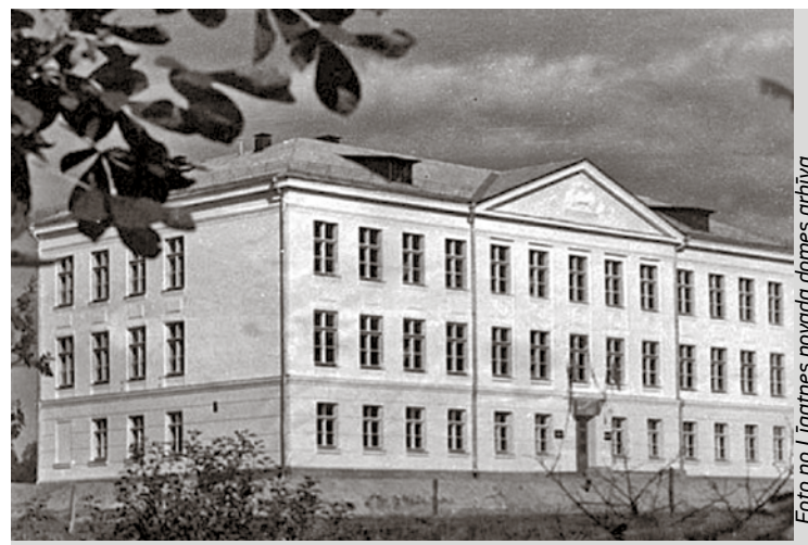
Jaunatklātā Līgatnes vidusskola 1959. gadā.