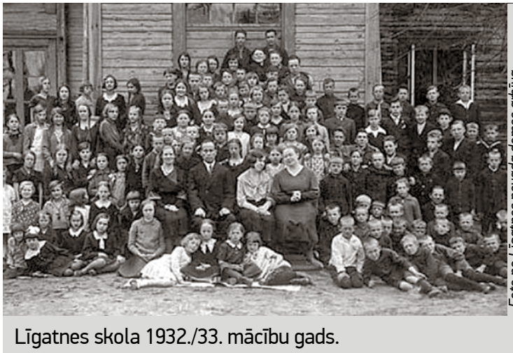
Līgatnes skola 1932./33. mācību gads.

Vēlāk jau tradicionālais, krāšņais svētku gājiens no „Lāču migas” vedīs uz kultūras namu, bet šoreiz salidojuma dalībnieki, kas iepriekš pulcēsies vidusskolas ēkā, pievienosies gājenam Gaujas un Dārza ielas krustojumā.