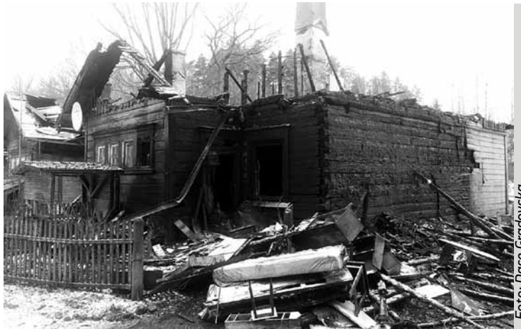
Brīvības iela 1 pēc ugunsnelaimes.

Un vēl – mani arvien vairāk apbēdina un satrauc situācija Brīvības ielā un tās tiešā tuvumā. Brīvības iela ir pavi-