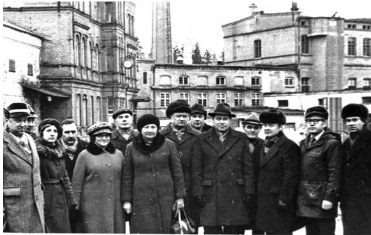
Latvijas komisija 26.12.80 Fabrikas gazifikācija Fabrikas gazifikācija, 2.12.1980.

Uzņēmuma darbiniekiem un pensionāriem pārdodamo akciju īpatsvars objekta pamatkapitālā: 20%. Vienas akcijas nosacītā cena: Ls 1,-. Uzņēmuma darbiniekiem un pensionāriem pārdodamo akciju skaits: 44 510. Maksāšanas līdzekļi: 100% privatizācijas sertifikāti,” – no sludinājuma