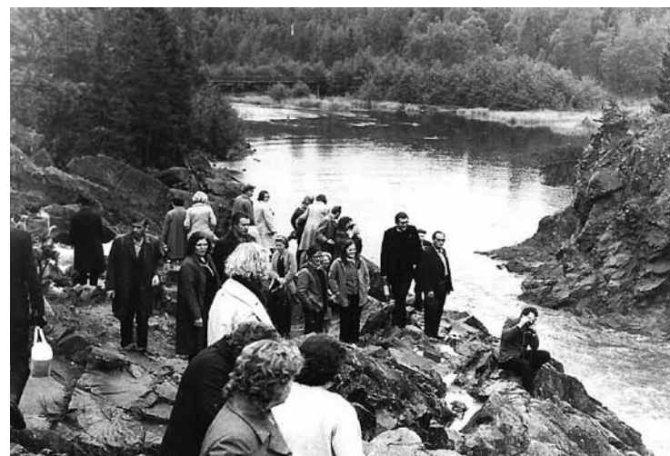
Papīrfabrikas ZTB ekskursijā Karēlijā, 80. gadi.

– Līgatnes papīrfabrikā top astoņu šķirņu pamatpapīrs: avižu, ofseta, zīmēšanas, akvareļu, papīrs ar ūdenszīmēm, kartona pamatne, sērkojiņu