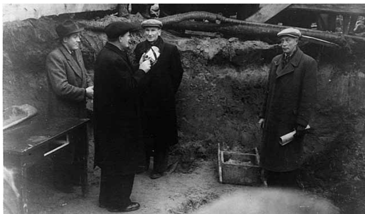
Pamatakmens iemūrēšana Līgatnes vidusskolai.