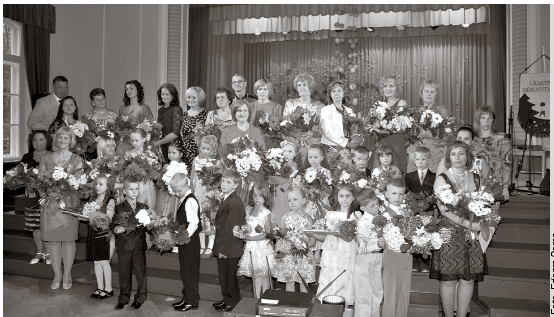
Līgatnes PII izlaidums Līgatnes kultūras namā 29.05.2014.