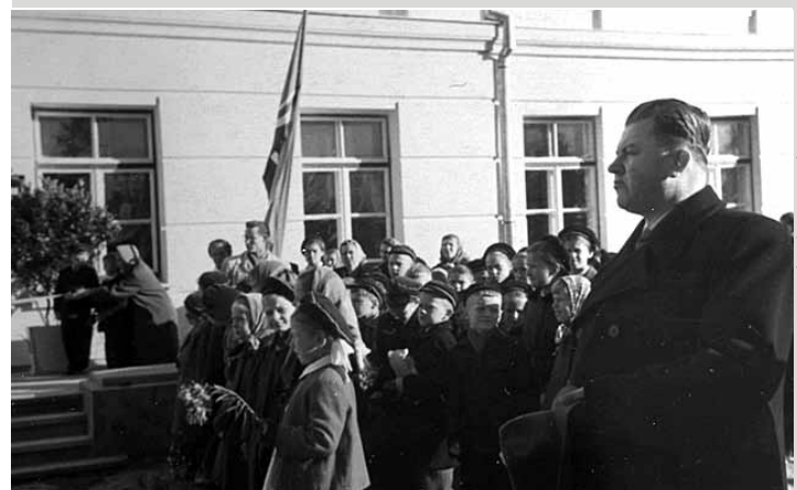
Līgatnes vidusskolas atklāšana 1959. gada 1. oktobrī, priekšplānā Latvijas PSR izglītības ministrs un Padomju Savienības varonis Vilis Samsons.