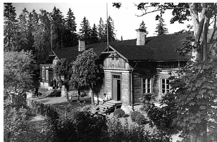
Līgatnes mazā skoliņa, 50. gadi.