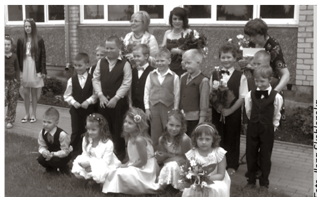
Līgatnes PII izlaidums „Zvaniņos” 29.05.2014.