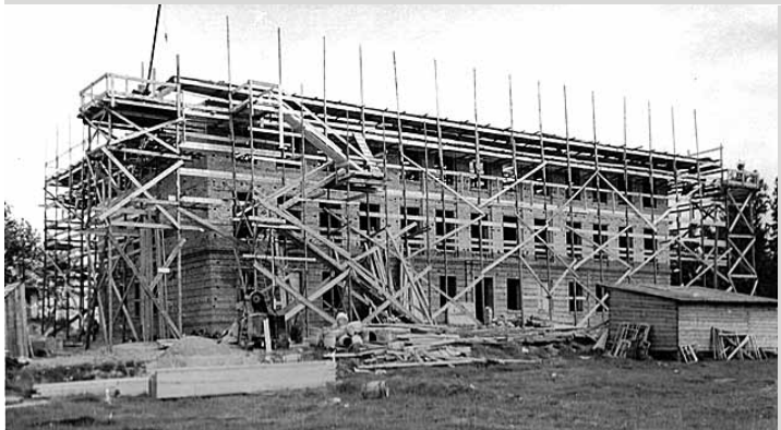
Top jaunā Līgatnes vidusskola, 50. gadi.