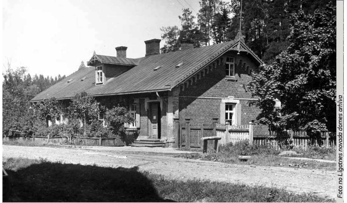
Aptieka ap 1949. gadu.

(8. turpinājums. Sākums – 2014. gads: LNZ, jūnijs, Nr. 6; augusts, Nr. 7; septembris, Nr. 8; oktobris, Nr. 9; novembris, Nr. 10; decembris, Nr. 11; 2015. gads: janvāris, Nr. 1; februāris, Nr. 2)